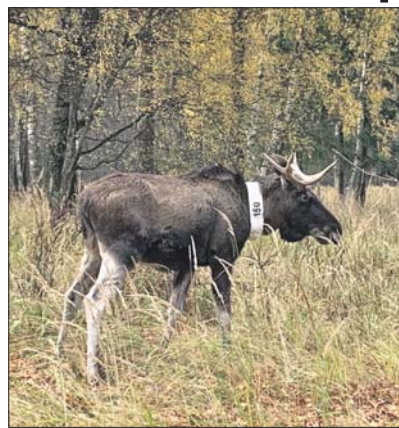
Лось Миша успел стать звездой соцсетей

Как сообщили сотрудники национального парка «Лосиный Остров», лося Мишу после годичного содержания на биостанции под приглядом ветеринаров выпустили в естественную среду обитания.