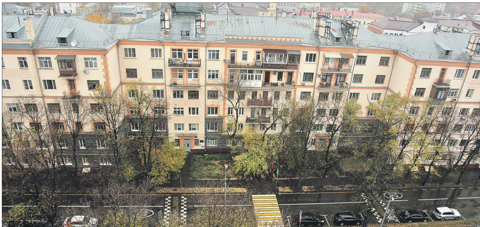
Дом на улице Буженинова, 22, благодаря изысканиям в архивах «повзрослел» на 30 лет