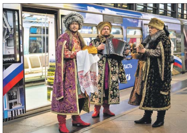
Поезд «Сибирь здесь» выпустили на линию с музыкой