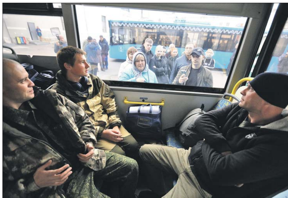
План выполнен, но добровольцам отказа не будет