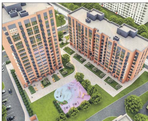
Вести многоэтажку в строй планируют в следующем году

Фасад облицуют керамической плиткой под кирпич натуральных оттенков и тёмно-серыми плитами. Во дворе сделают детскую и спортивную площадки, а рядом парковку.