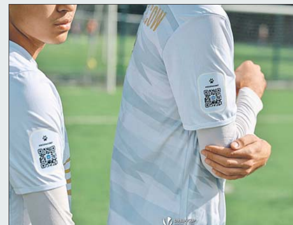
Подготовила Виола СЕРГЕЕВА