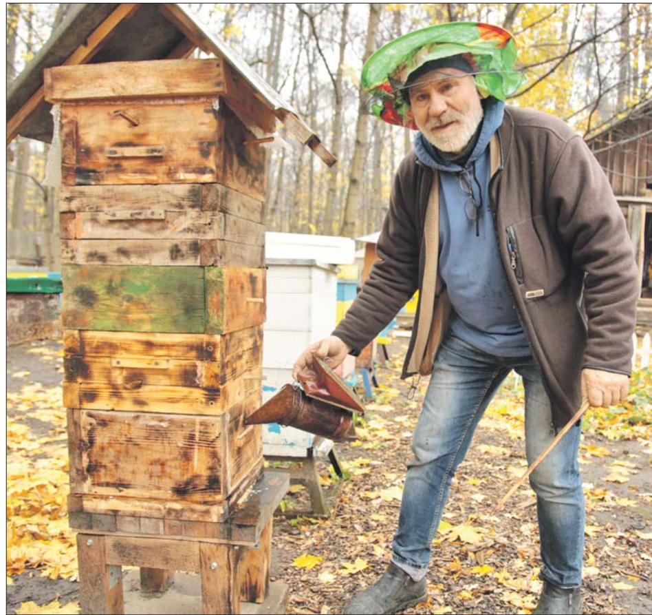
«Царскую пасеку» уже готовят к зиме