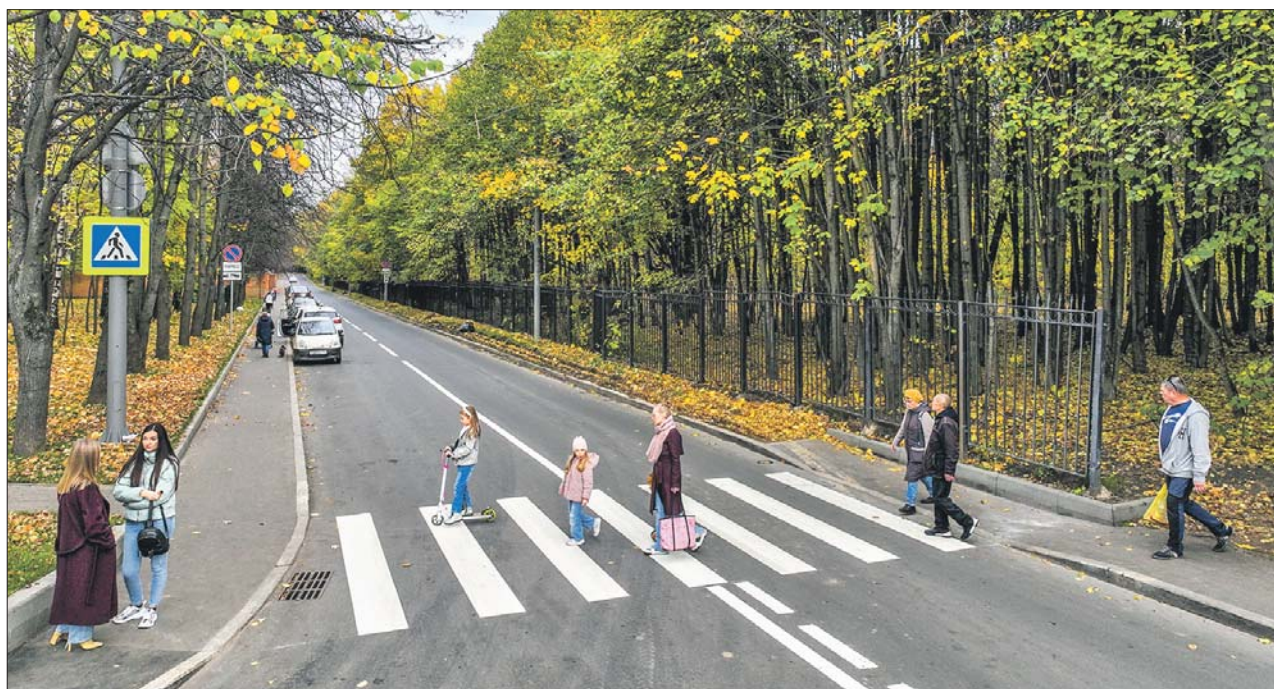
На Терлецком проезде уложили новый асфальт и бордюрный камень

На трёх улицах обновлены тротуары, отремонтированы пешеходные дорожки общей площадью 6,8 тысячи кв. метров, вдоль всей территории установлен бордюрный камень, а также заменён асфальт на проезжей части и на парковках.