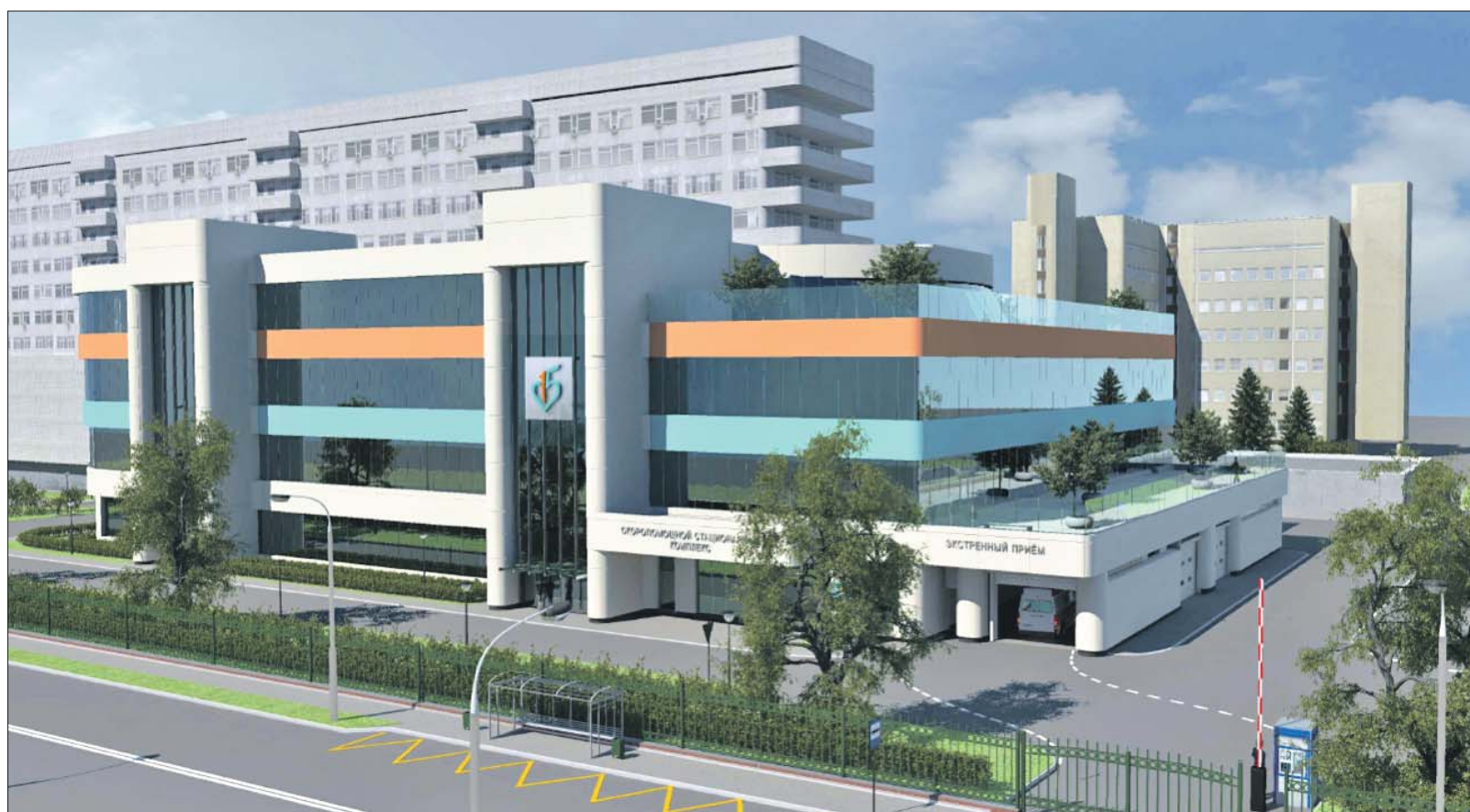
Так будет выглядеть новый корпус ГКБ №15 имени Филатова

Также соцкоординаторы помогут решить бытовые вопросы — например, если пациент не смог забрать ребёнка из школы, не может дозвониться близким, дома остался питомец, о котором больше никому позаботиться. Особое внимание уделят пожилым людям с инва-