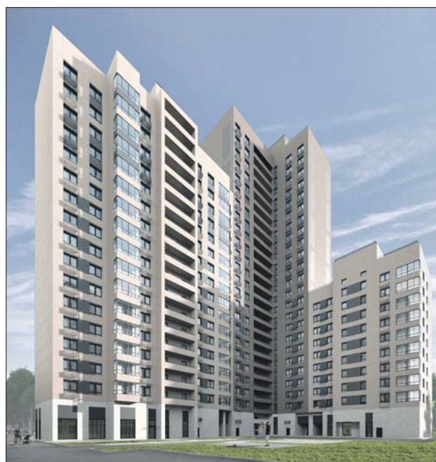
Дом рассчитан на 270 квартир и несколько нежилых помещений на первых этажах