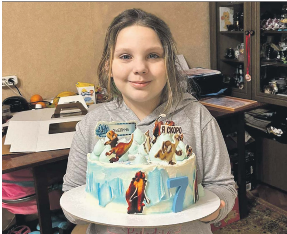
Не каждая семья может позволить себе детский праздник, тогда помогают волонтеры