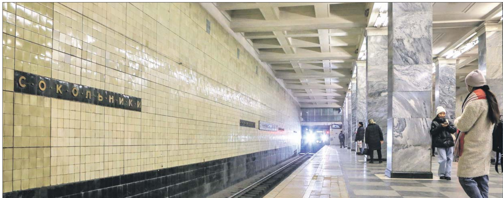
Станция «Сокольники» признана объектом культурного наследия