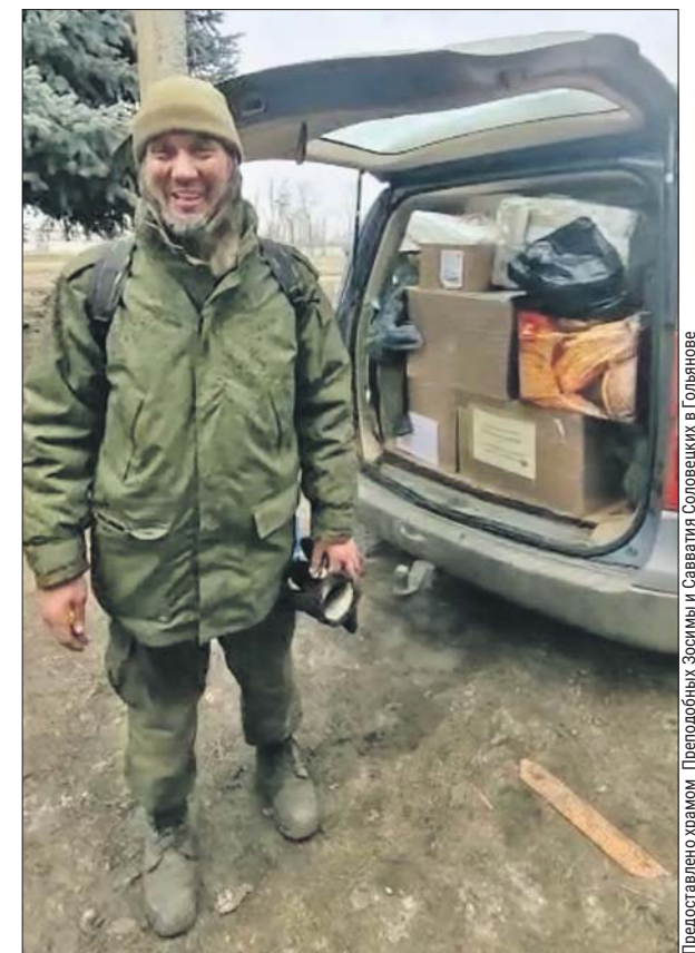
Очередной груз от прихожан храма в Гольянове уже в Донбассе

Подробная информация о других видах гуманитарной помощи в телеграм-каналах «Храм Зосимы и Савватия Соловецких» и «Гольяново для фронта»