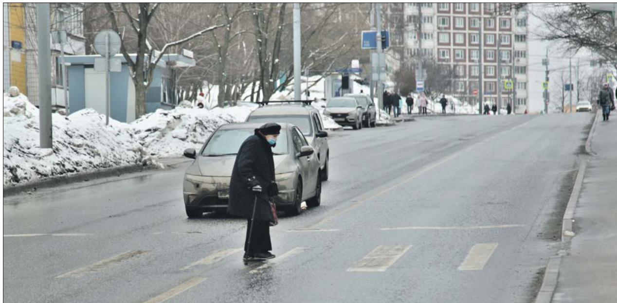
Пожилые люди полагают, что водители их обязательно пропустят

— При этом проезжая часть была занята автомобилями, а тротуар чист, — удивляется инспектор. — Пенсионерка погибла на месте.