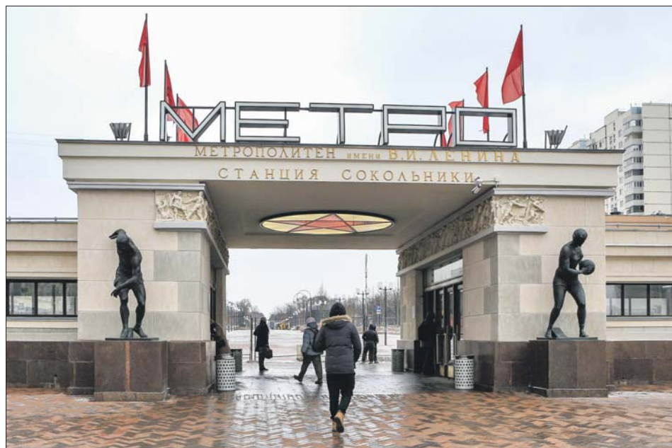
Вход в метро должен был привлечь москвичей в подземку