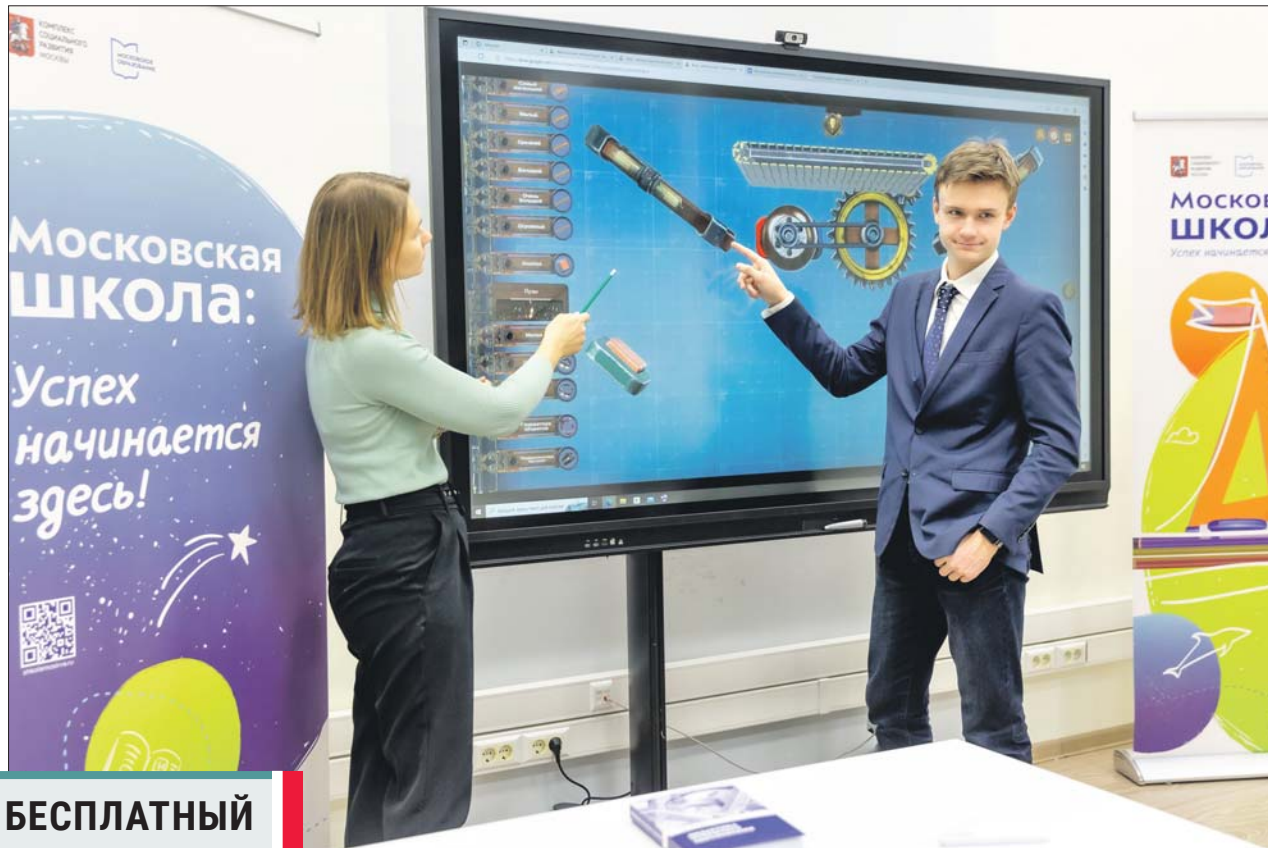
Благодаря МЭШ объяснение нового материала стало более наглядным