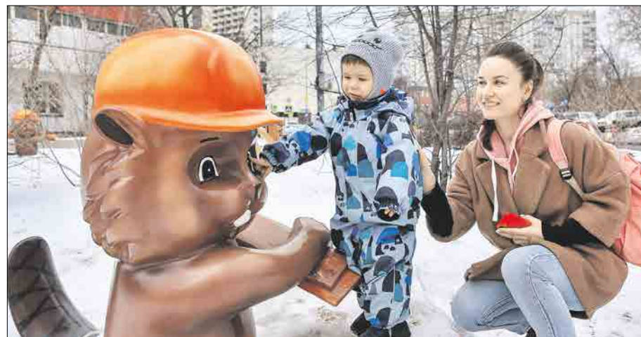
Похищенного бобра заменили новым