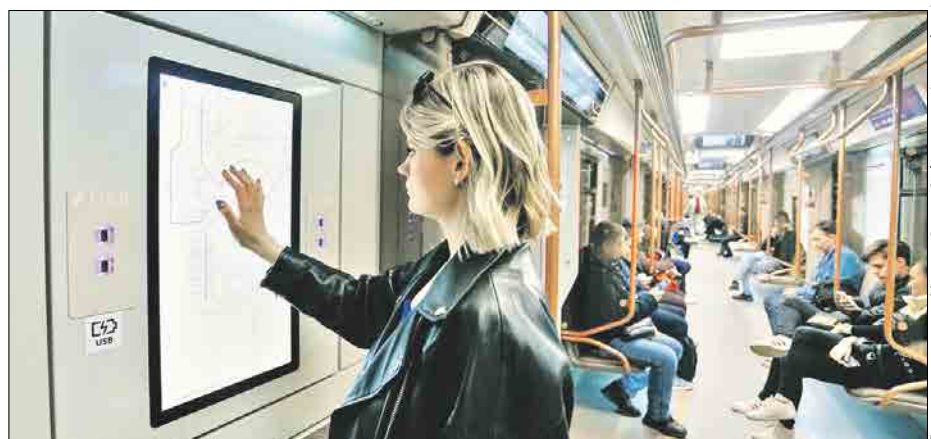
За три года Москва планирует закупить более 800 таких вагонов

Кроме того, идёт работа над созданием поезда нового поколения, который сможет выйти на линии начиная с 2026 года. По словам мэра, он вместит больше пассажиров, его двери будут рекордно широкими, а внутри станет ещё тише и комфортнее. Также прорабатывается возможность внедрения беспилотного управления поездом.