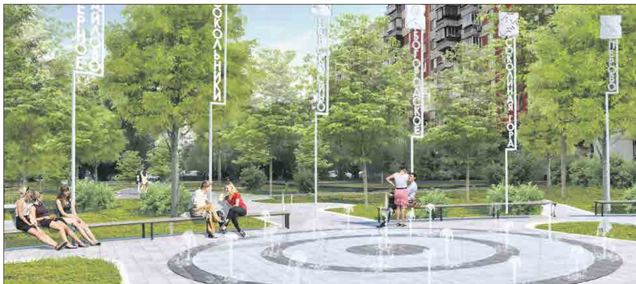
У пересечения Новокосинской и бульвара Дружбы районов появится сухой фонтан

Здесь планируют сухие фонтаны, спортивные и детские площадки