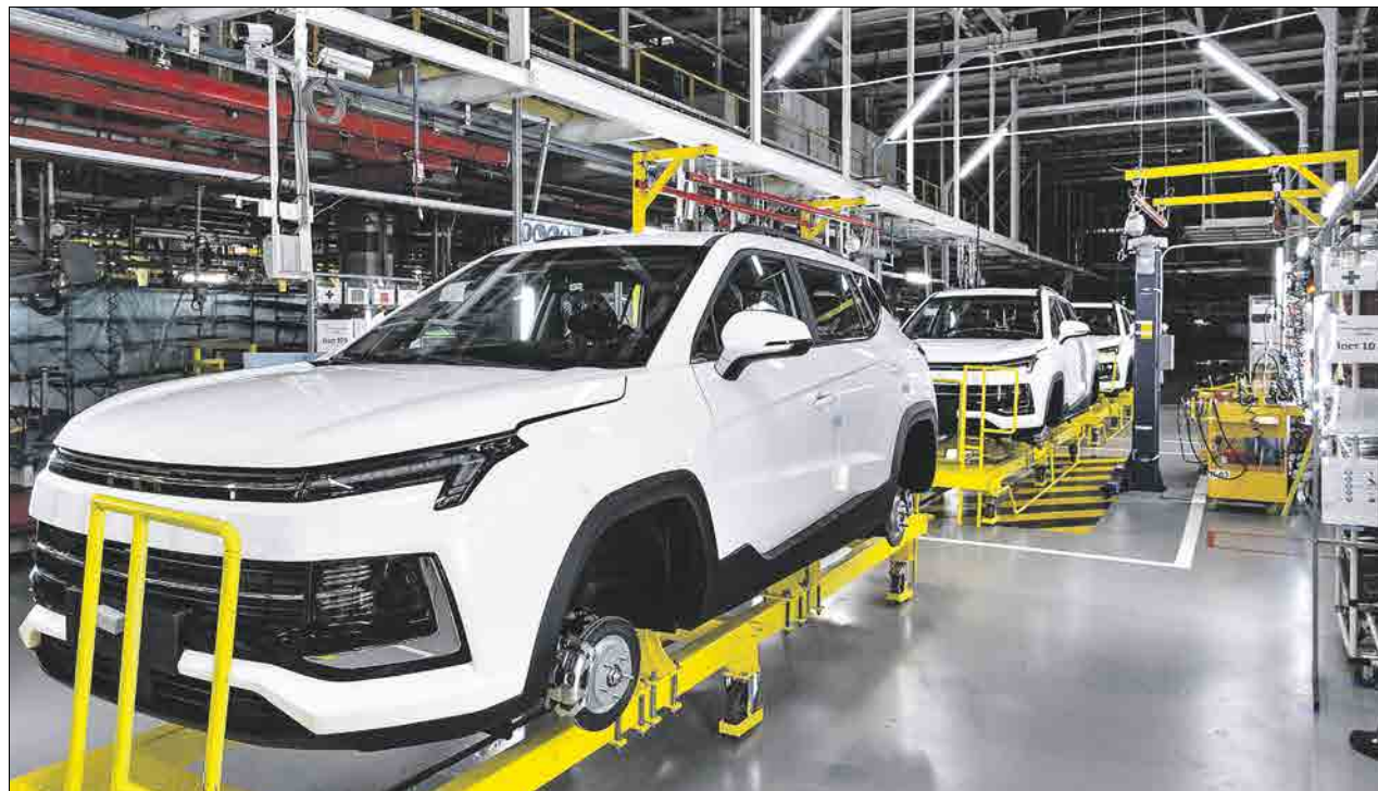
На базе бывшего производства «Рено» возобновлена сборка автомобилей «Москвич»

Мы в этом году закончим реконструкцию половины всего поликлинического фонда Москвы, и будет 200, по сути, новых зданий, оснащённых по новому, самому современно-