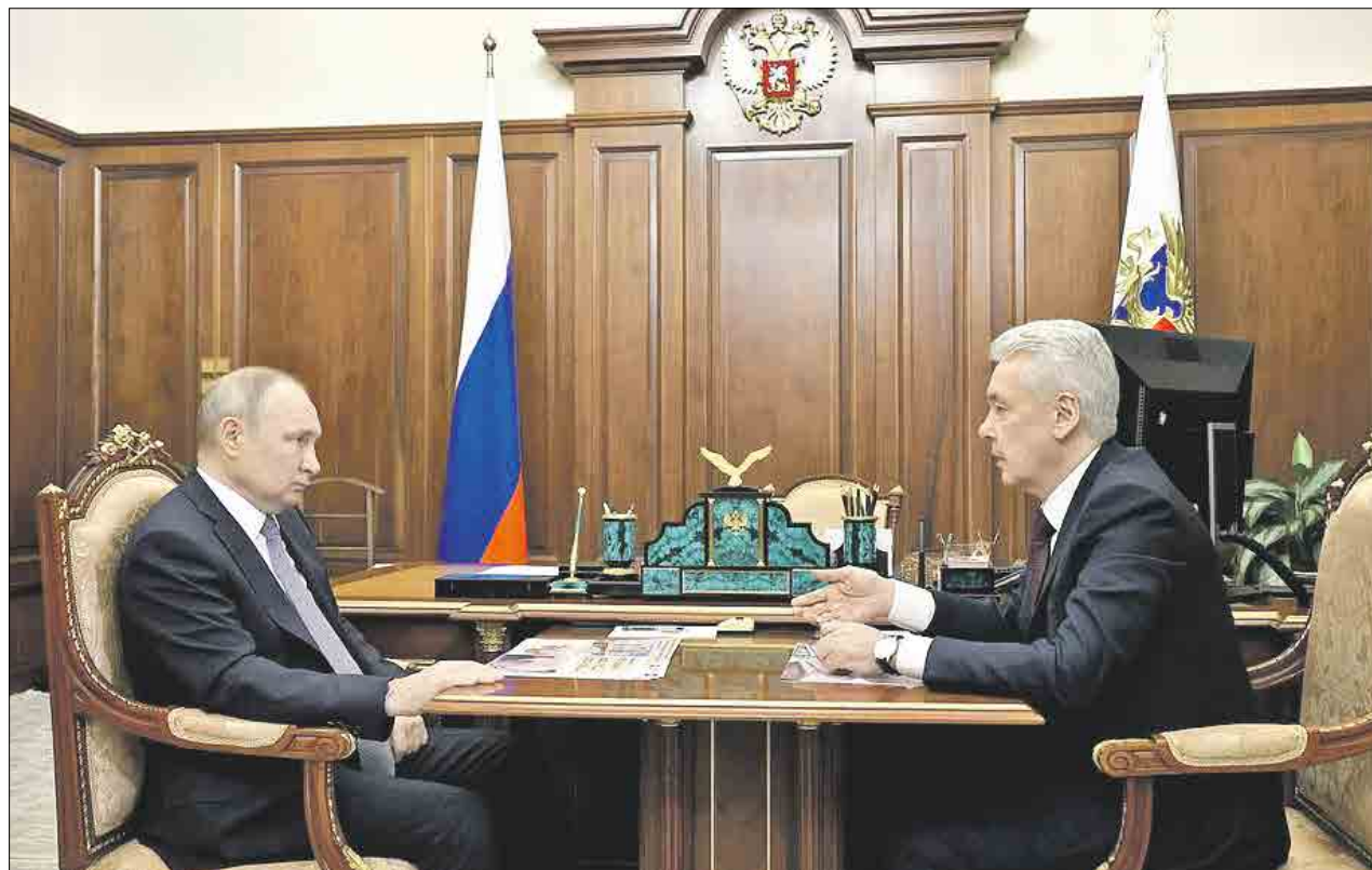
Сергей Собянин доложил президенту об основных программах развития Москвы

Мы реализуем в области экономики ряд интересных проектов, которые будут драйверами развития в ближайшие годы. Мы уже говорили о беспилотных летательных аппаратах. В «Руднёво» на промплощадке мы развернули большую площадку, сегодня уже там 120 тысяч квадратных метров промышленных площадей, в ближайшие годы будет в три раза больше. И ядром этого промплощадки будут