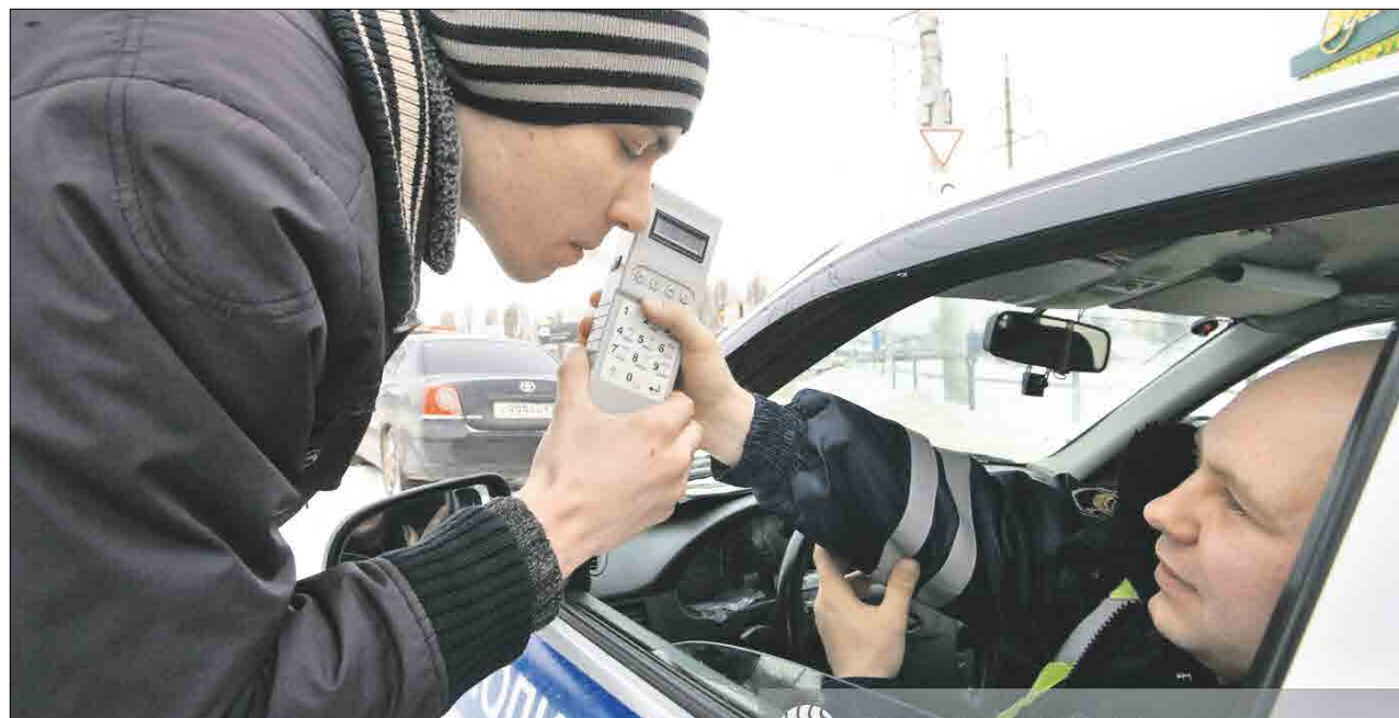
Инспектор вправе предложить «продуться», если автовладелец ведёт себя странно

Найти понятых в городе для проведения экспресс-теста несложно: машин на дорогах немало даже ночью. Но за пределами столицы ситуация другая. Например, ночью на загородной дороге прохожих или проезжающих может и не быть. Быстро понятых тут не най-