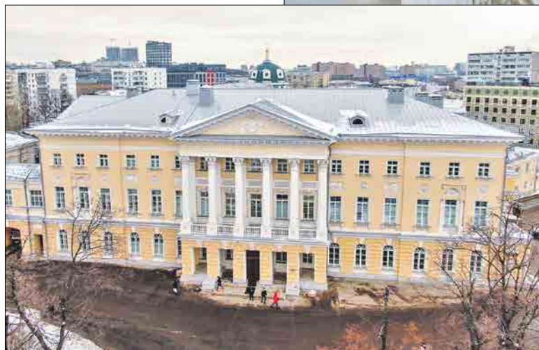
С именем бывших владельцев усадьбы связано множество легенд

Сейчас ГКБ им. И.В.Давыдовского — современный многопрофильный стационар на 385 коек, включая 45 реанимационных и семь дневного стационара.