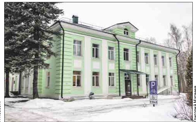
Здание биоцентра на Ростокинском проезде