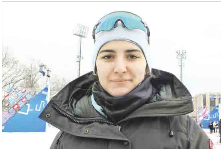
Конькобежка Ангелина Голикова

В Лужниках состоялся зимний фестиваль, посвящённый 100-летию московского спорта. Его посетили свыше 15 тысяч человек.