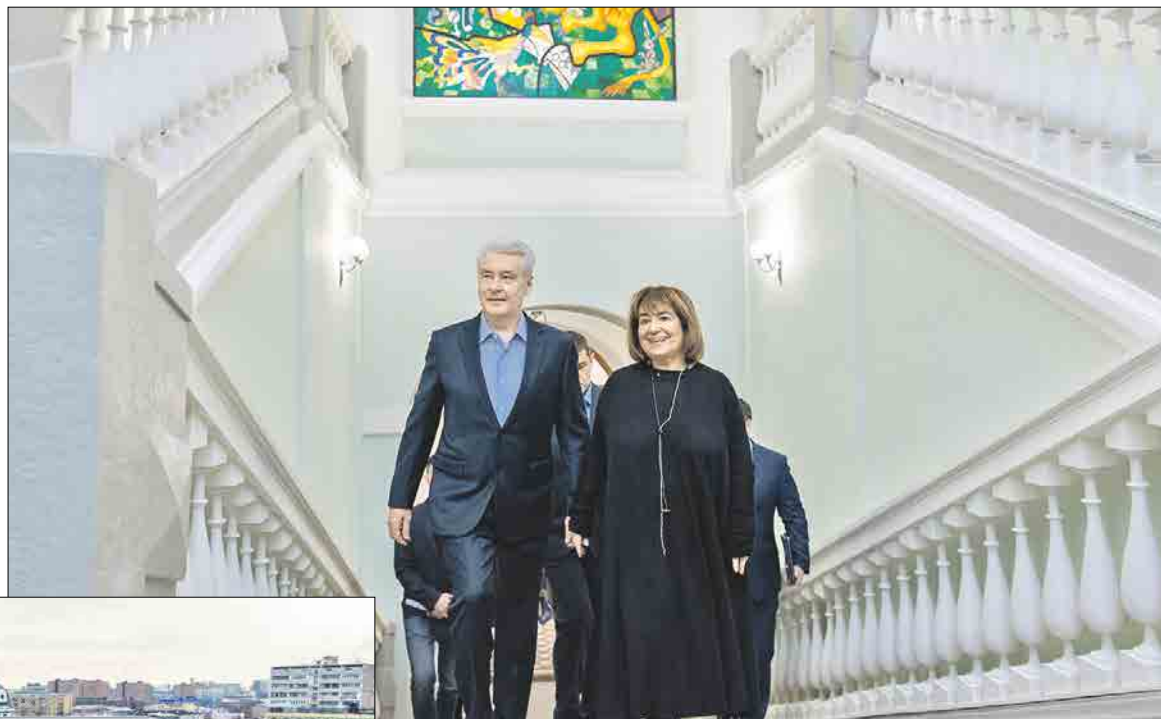
Мэр Сергей Собянин в главном корпусе с реставраторами

Завершается реставрация главного корпуса больницы на Яузской улице, памятника архитектуры