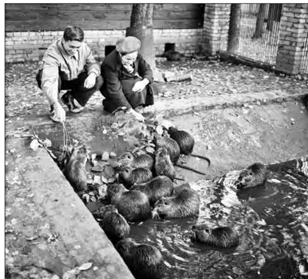
Юные натуралисты кормят нутрий. 1959 год

105 лет назад в Сокольниках создали первую в СССР биостанцию юннатов