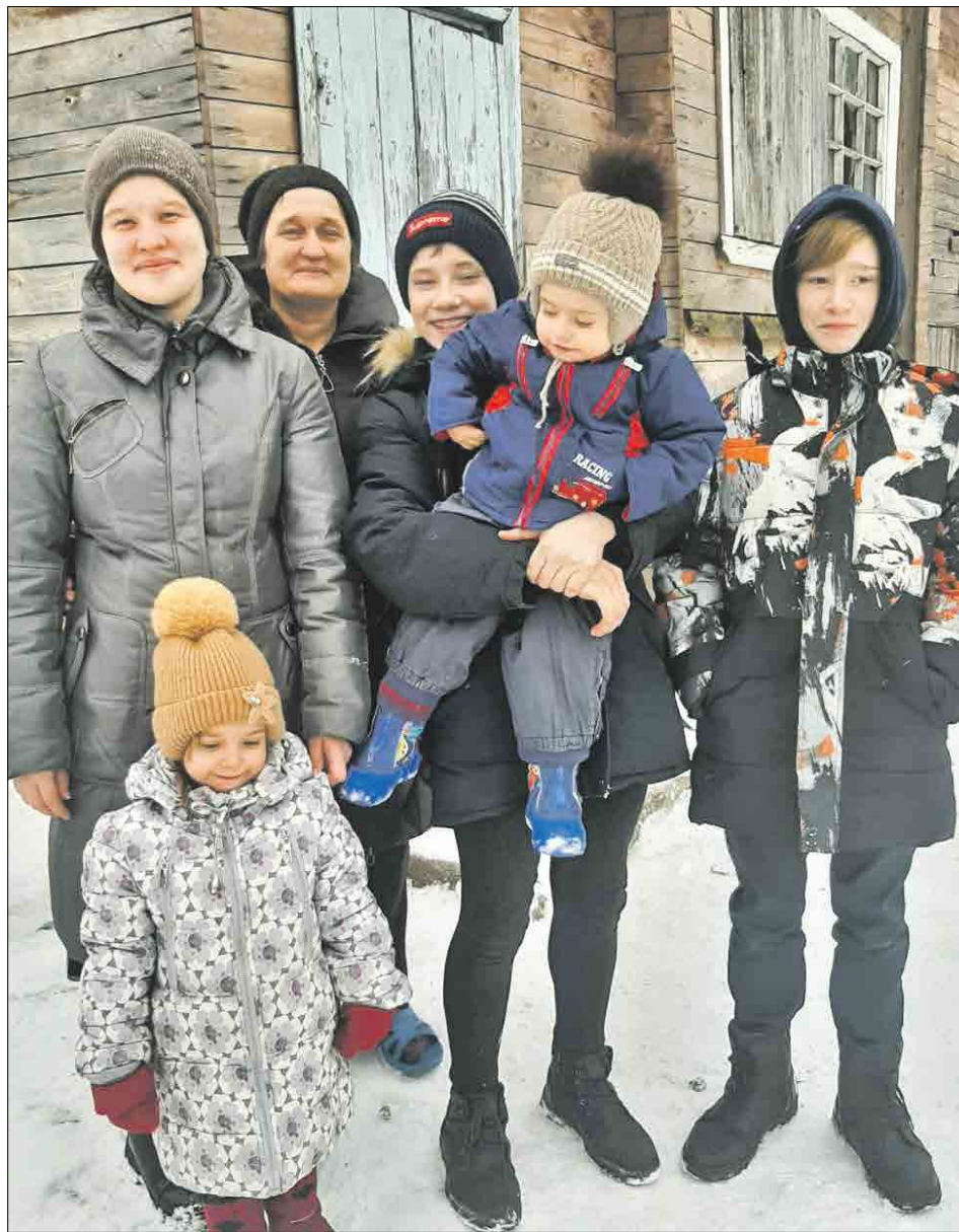
В поселке Пено Тверской области бабушка одна воспитывает внуков