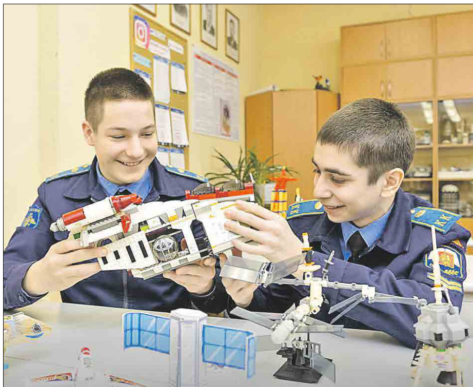
Учащиеся космических классов пройдут обучение на предприятиях Роскосмоса

Например, в медицинских классах в программу по истории включат историю медицины, а на уроках английского языка будут изучать медицинские термины. Аналогичным образом изменятся программы во всех предпрофессиональных классах.