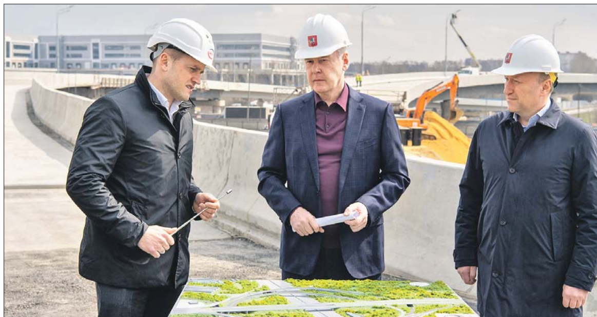
Сергей Собянин во время посещения строительной площадки на МКАД

С ОБЕИХ СТОРОН КОЛЬЦА, МЕЖДУ 26-М И 31-М КИЛОМЕТРАМИ, СДЕЛАЮТ БОКОВЫЕ ПРОЕЗДЫ