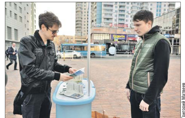
У метро «Сокольники»