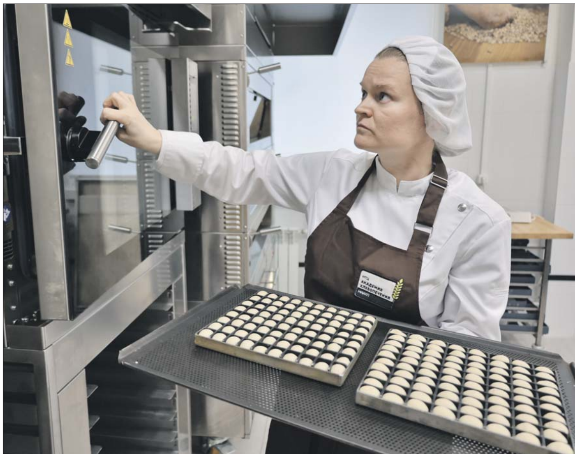
Эти буханки сначала отправятся в печь...

В НИИ хлебопекарной промышленности в Преображенском делают хлеб для космонавтов