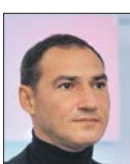
Андрей Любимов / Агентство «Москва»