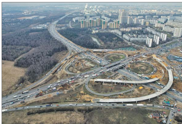
На развязке будет четыре новых съезда

Реконструкция Липецкой развязки позволит обеспечить беспрепятственный выезд на федеральную трассу М-4 «Дон». За счёт увеличе-