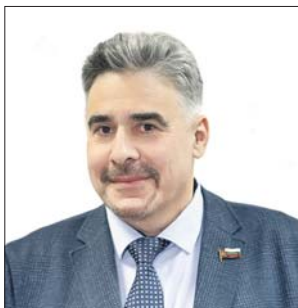
Пресс-служба префектуры ВАО

— Задача муниципальных депутатов — оказывать всяческую помощь жителям округов Москвы в решении проблем. Особенно это важно, когда речь идёт о доступности медицинской помощи. Благодаря тому что Департамент здравоохранения всегда открыт для обращений, рассмотрение нашего запроса прошло оперативно и конструктивно. Мнение жителей районов было услышано, и