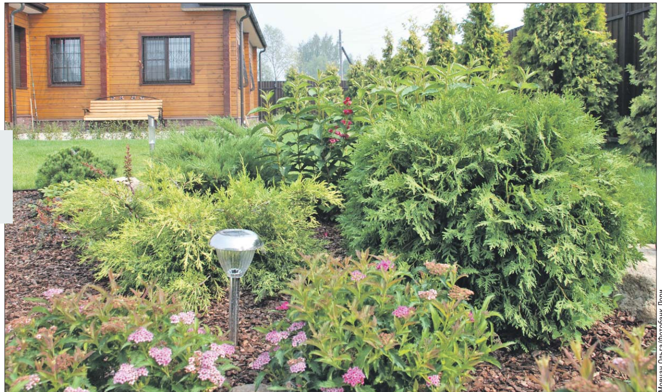
По мере разрастания можжевельника другие растения можно пересадить

Как создать ландшафтную композицию, рассказала дизайнер из Северного Измайлова