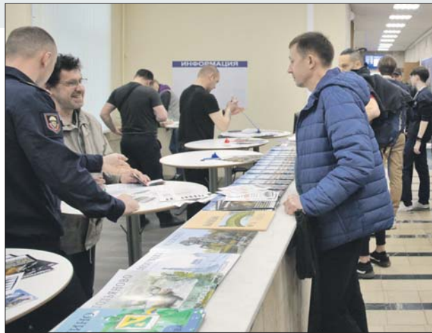
Здесь можно получить всю информацию о контракте

Сейчас особенно нужны разведчики, артиллеристы, танкисты. Учитывается, кстати, не только военно-учетная специальность, полученная во время срочной службы в армии, но и гражданская профессия. Востребованы, например, специалисты в сфере компьютерных технологий.