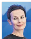
Ирина Апексимова / Агентство «Москва»