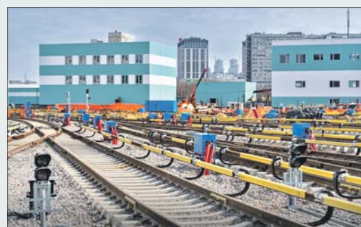
Обслуживать составы станет легче

кольнической и Троицкой линий. «Также проектируем электродепо «Бирюлёвское» на юге Москвы, которое будет обслуживать одноимённую перспективную ветку. Реконструируем «Владыкино» и «Выхино», — отметил Сергей Собянин в своём телеграм-канале.