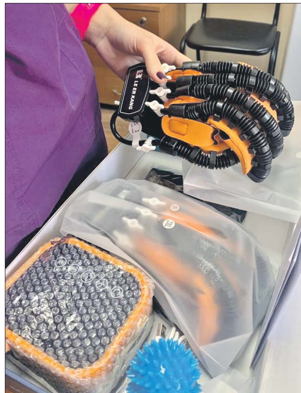
Среди посылок — устройство для разработки кисти

— Я, например, услышала, что родные одного парня просят помочь с приобретением санитарного кресла. Поделилась с подругой — она тут же захотела помочь. Даже удивилась, почему я раньше об этом не рассказывала. И предложила написать об этом в наш общий чат для практикую-