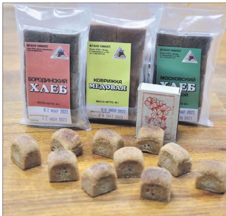
... а потом на орбиту

Сейчас в НИИ хлебопекарной промышленности выпускают восемь сортов выпечки для космонавтов: пшенично-ржаные хлеба «Бородинский», «Столовый» и «Московский», сдобный пшеничный хлеб, а ещё медовые коврижки, кексы и два вида рулетов — с повидлом и сгущённым молоком. Все рецепты соответствуют ГОСТам. При этом они точно такие, по которым пекут хлеб для обычных потребителей.