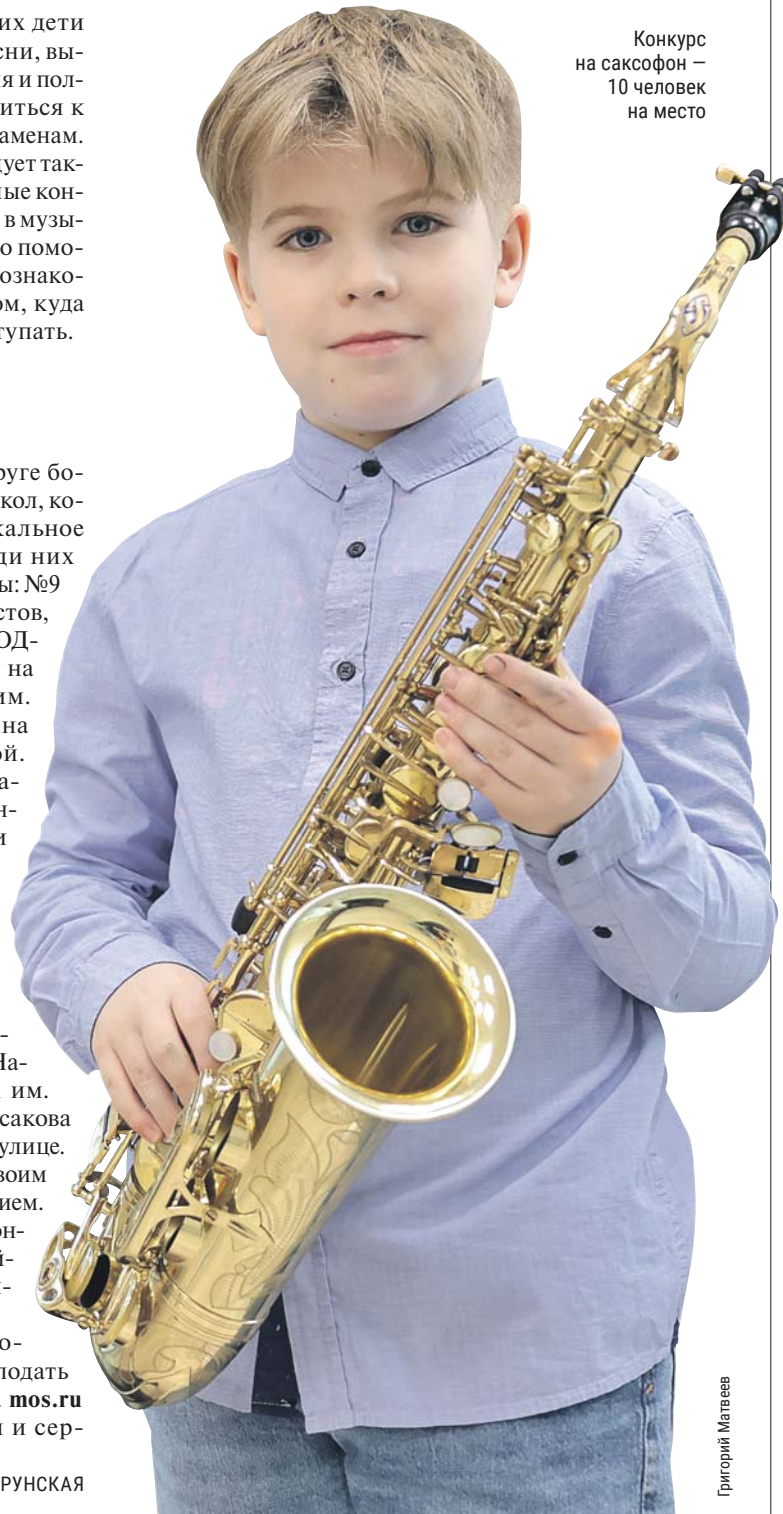
Конкурс на саксофон — 10 человек на место