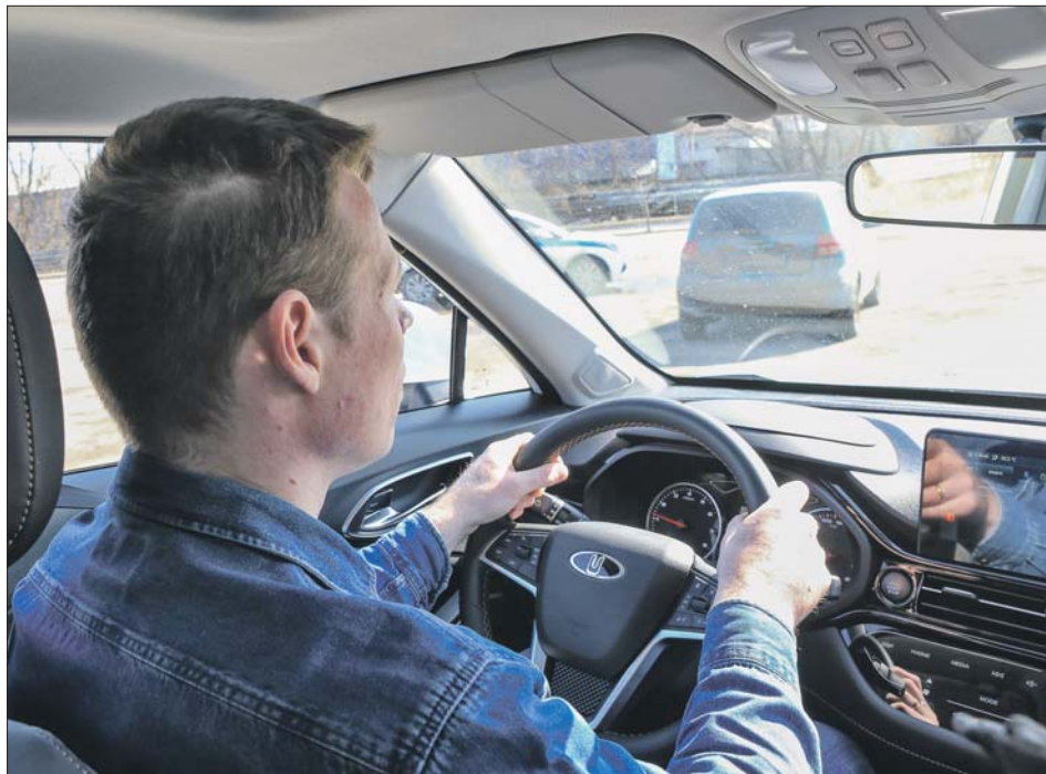
Помимо кроссоверов, на заводе «Москвич» планируют выпуск седанов

Наш корреспондент оценил возможности авто столичной сборки в ходе тест-драйва