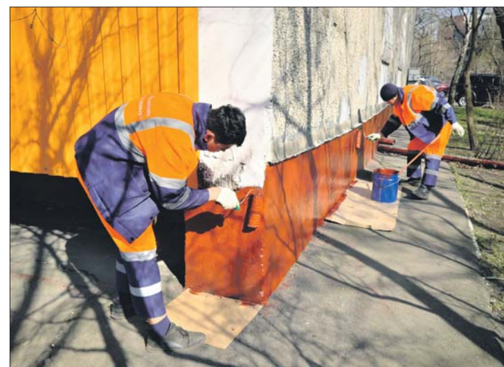
Цоколи многоквартирных домов обязательно красят раз в год