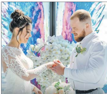
Молодожёны ждут более 30 новых площадок

На выездных площадках и во дворцах бракосочетания будут бесплатно работать профессиональные фотографы.