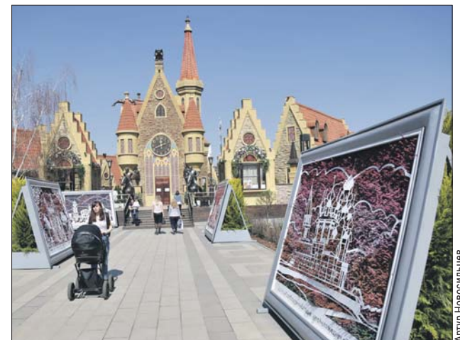
Фестивальная площадка на Гордеевской