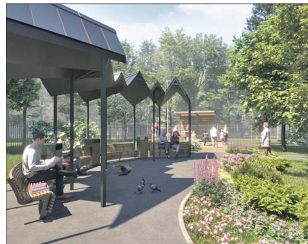
У центра оборудуют зоны отдыха