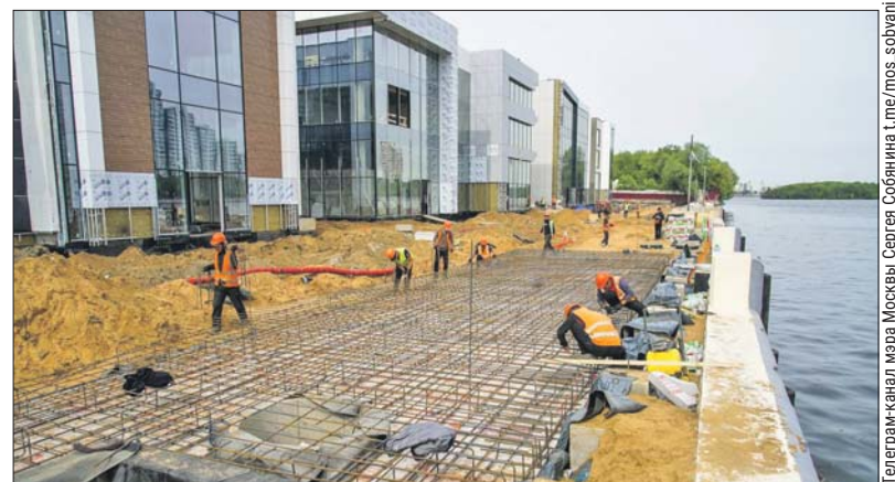
Набережная протянулась на полкилометра

«Протяжённость обновлённой набережной будет 500 метров. Организуем там пять причальных зон для судов разного класса — прогулочных и круизных. Для посадки пассажиров установим ещё три павильона», — написал Собянин.