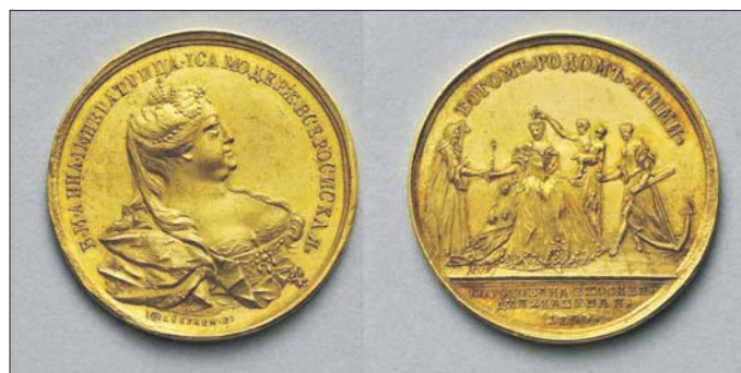
Медаль в память о коронации Анны Иоанновны

сковской фирмой Меллера. А самая древняя находка — с Гоголевского бульвара: кремнёвый нож или наконечник дротика, датируемый эпохой неолита, примерно IV тысячелетием до н.э.