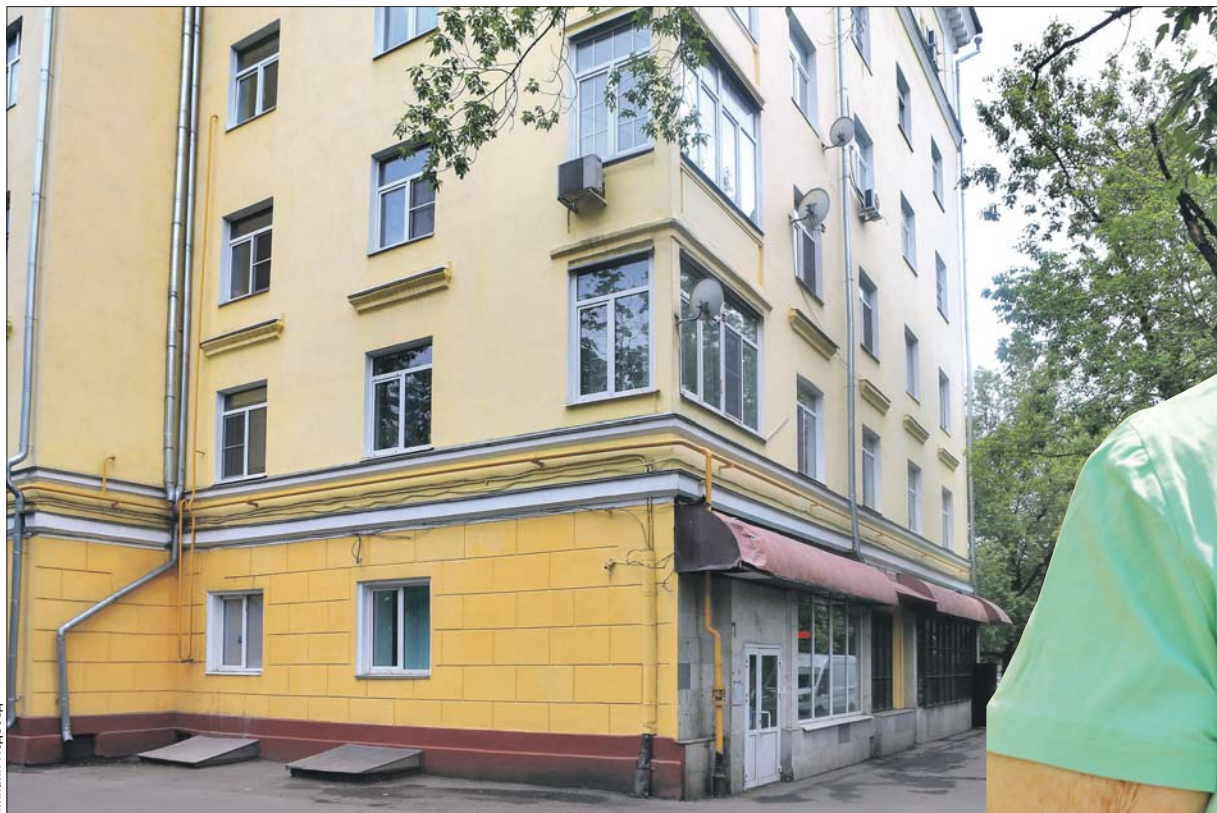
В доме 16 по Кусковской улице была булочная, где получали хлеб по карточкам

Воспоминаниями о военном детстве поделилась жительница Новогиреева