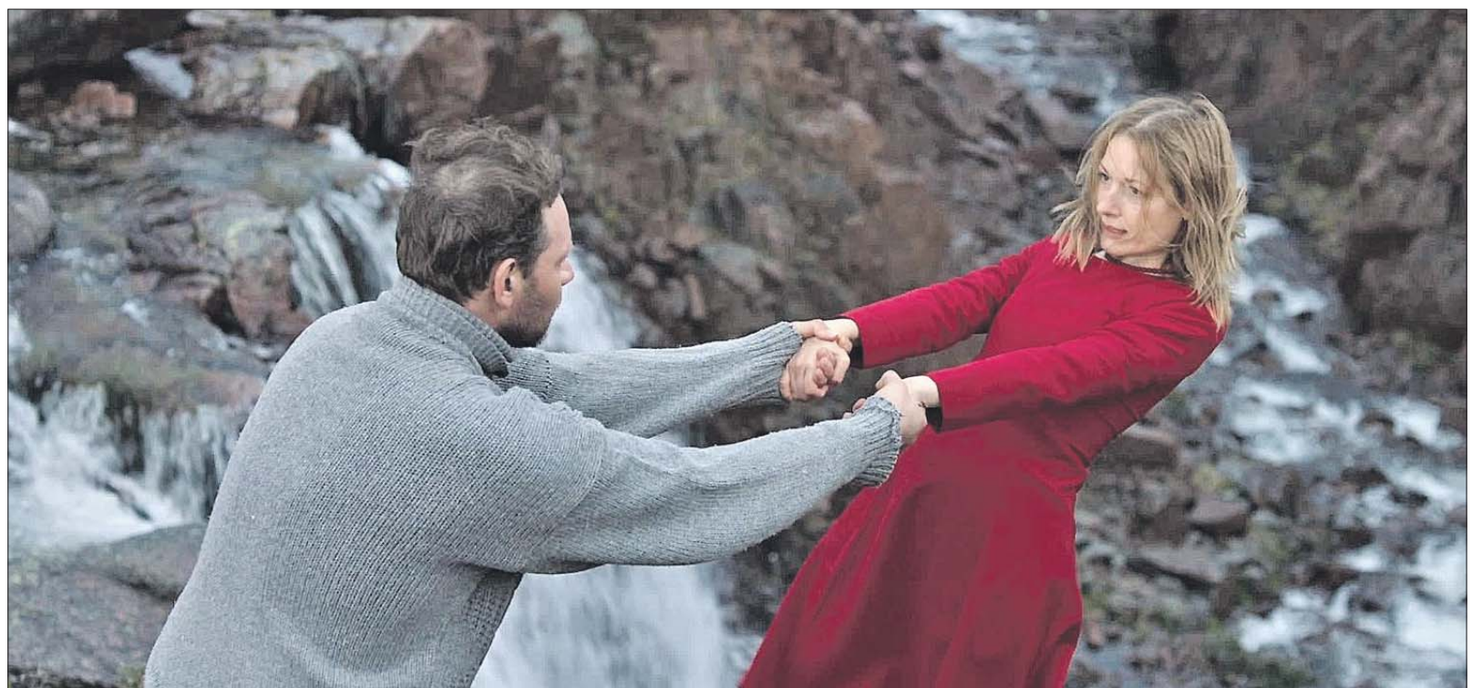
Кадр из фильма «Туман»