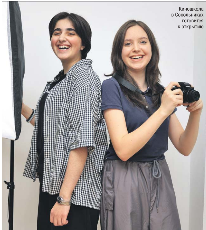
Киношкола в Сокольниках готовится к открытию

В Преображенском откроет свои двери «Заниматика» для детей от 7 до 14 лет. По словам Екатерины Прудниковой, программа построена на смене