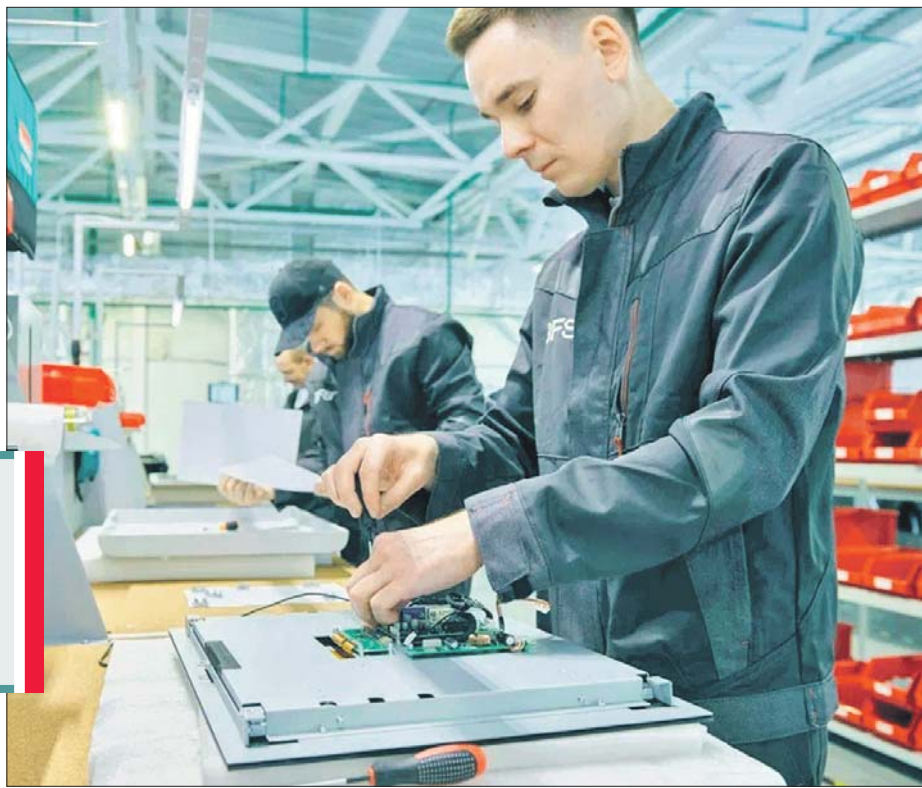
Завод полностью удовлетворит потребности российского рынка

Новый банкомат может выполнять все привычные операции: бесконтактно считывать банковские или транспортные карты, двухмерные штрих- и QR-коды, использовать биометрические данные. Оборудование защищено от мошенников и вандалов.