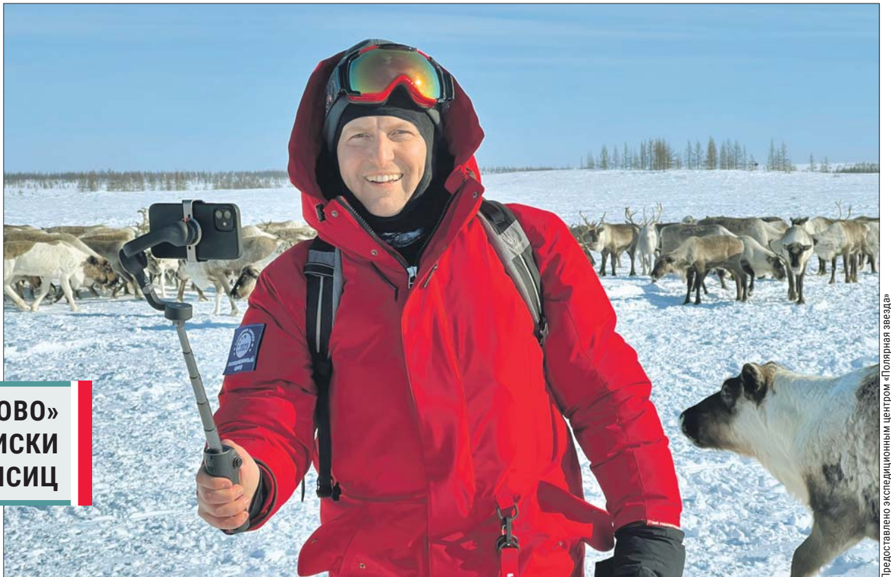
В библиотеке на 11-й Парковой о своих путешествиях расскажут полярники