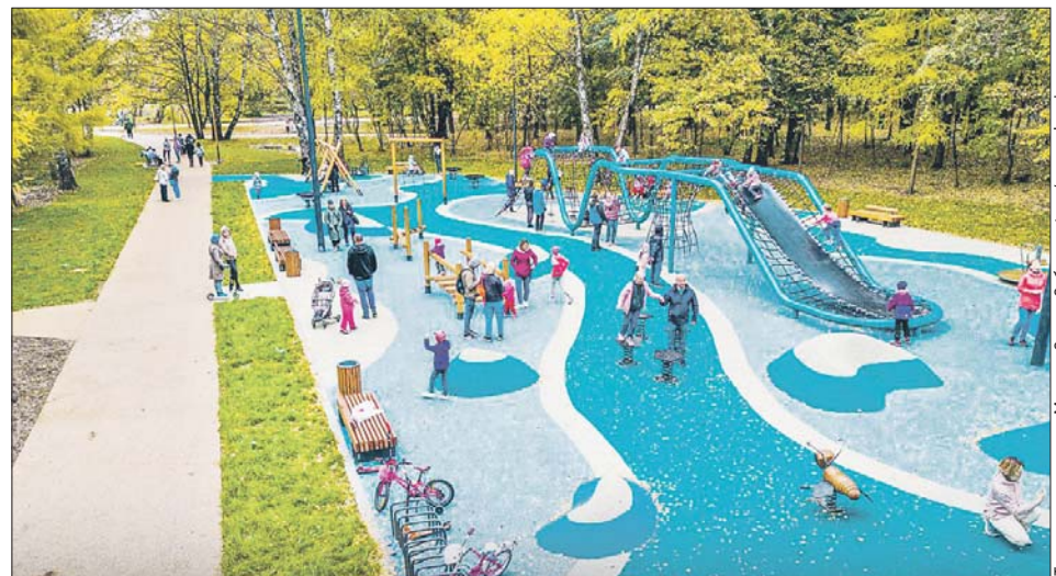
В лесопарке «Кусково» целых девять игровых площадок

А в лесопарке «Кусково» обустроили сразу девять игровых площадок в сказочной и лесной тематике. Площадки рассчитаны на детей разного возраста. Здесь установили игровые комплексы с башенками, закрытыми и открытыми горками, канатными лазательными сетками, тоннелями, полосами препят-