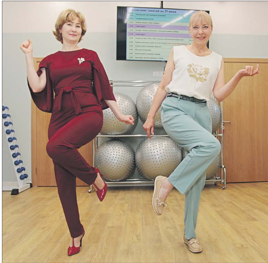
В центре уже работают несколько клубов по интересам

Центры «Московского долголетия» работают без выходных с 10.00 до 20.00. Единый справочный тел. (495) 870-4444. Расписание мероприятий смотрите на сайте dszn.ru в разделе «Центры московского долголетия».