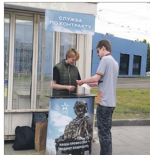
У станции метро «Бульвар Рокоссовского»