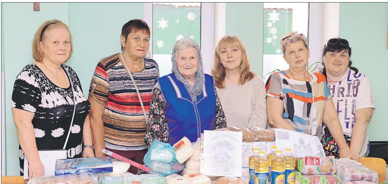
Прихожане храма ведут сбор помощи для бойцов СВО и госпиталей