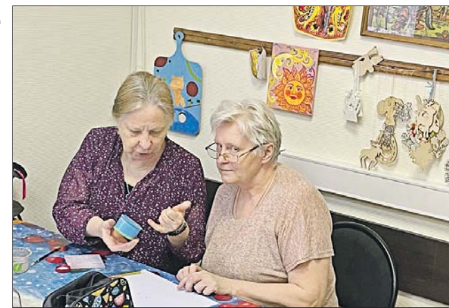
ТУ «Измайлово» ООЦ им. Моссовета

В студии расписывают не только традиционные панно