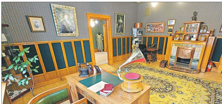
Часть интерьеров удалось сберечь до наших дней