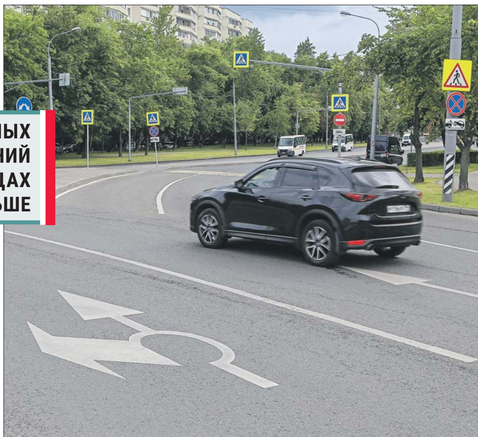
Пару лет назад на пересечении улиц Молдагуловой и Вешняковской открыли первое в ВАО турбокольцо

Подъезжаю, перед кругом стоит привычный синий знак со стрелками. Но есть ещё и таблички, которые подсказывают, какой ряд лучше занять. Нужен первый съезд — держись правее, следующий — левее. Такие же подсказки даёт и разметка. В отличие от обычного круга на турбоперекрёстке из левого ряда на первый же съезд не уйдёшь: придётся пересечь сплошную линию разметки, а это грубейшее нарушение ПДД.