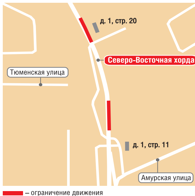
— ограничение движения