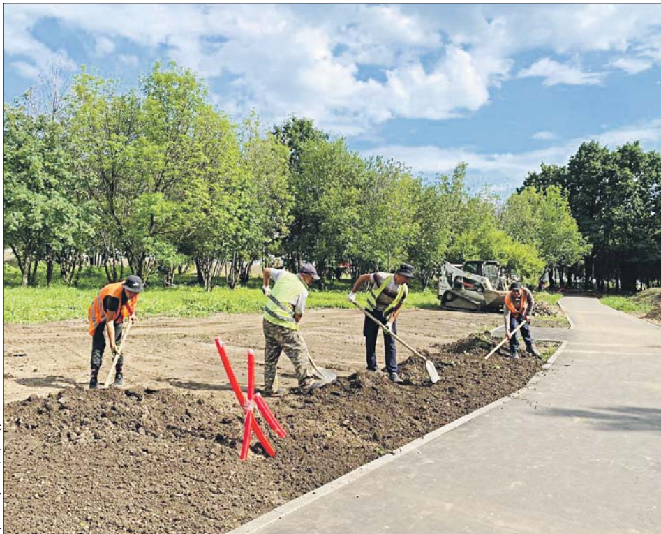
Пешеходную зону обустроят от Новогиреевского пруда до строения 35 на улице Сталеваров