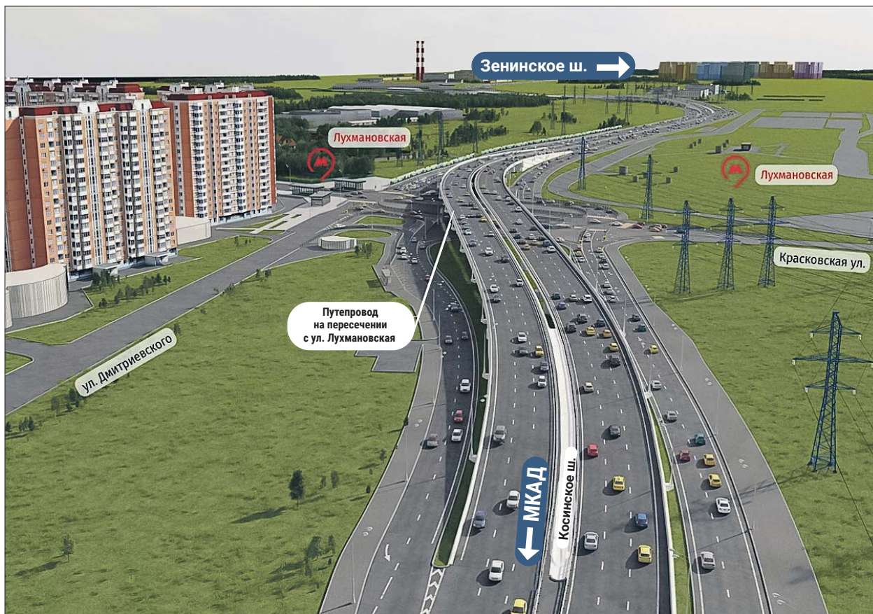
Строится дорога от Лухмановской улицы до Покровской

Затем в январе открыли участок диаметра от Покровской улицы до Зенинского шоссе. Это позволило снизить автотрафик на нескольких объектных улицах — Маресьева, Сочинской, Рождественской, Покровской, а также на улицах 8 Марта, Вертолётчиков, Барыкина и Недорубова. Длина открытого участка составила около 3 километров. Строить его начали в августе 2020 года, а закончили на восемь месяцев раньше срока, указанного в контракте. Здесь было реконструировано и построено больше 8 километров дорог, путепровод и разворотные съезды с него.