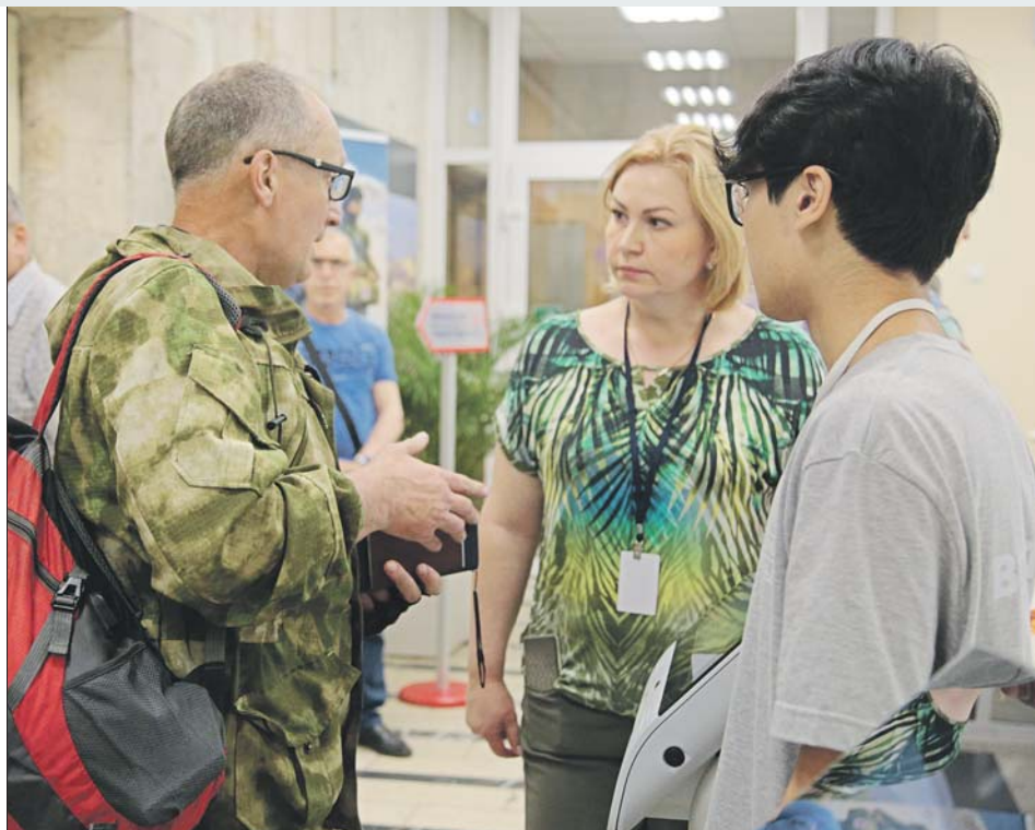
В пункте отбора на улице Яблочкова

Заполнив анкету, мужчина идёт в зал ожидания.