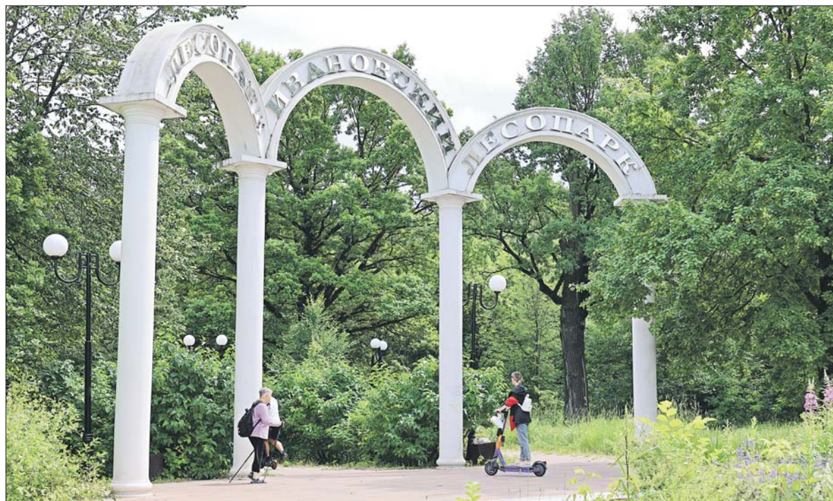
Жестокое убийство произошло в 2002 году в Ивановском лесопарке. На фото центральный вход в парк

ПО ГОРЯЧИМ СЛЕДАМ РАСКРЫТЬ ПРЕСТУПЛЕНИЕ НЕ УДАЛОСЬ