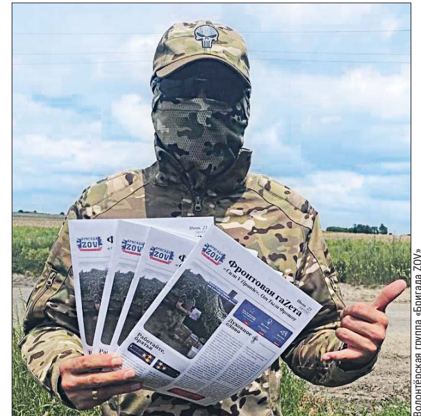
Газета «Сила в правде» издаётся на пожертвования

«ВО» писал о волонтерах «Бригады ZOV», которые плетут маскировочные сети, закупают для бойцов и военных медиков нужные препараты, различное оборудование и снаряжение для фронта. Среди них много жителей Новогиреева, Перова и других районов. Присоединиться к ним могут все желающие.