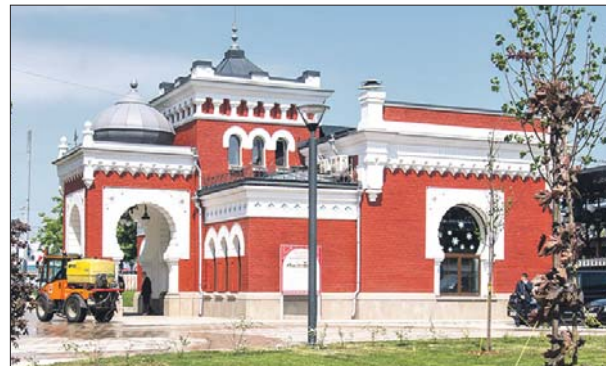
В бывшем царском павильоне теперь касса

Благодаря модернизации двух существующих и строительству 3-го и 4-го главных путей пропускная способность участка Площадь трёх вокзалов — Курская увеличилась более чем вдвое. Это позволит организовать параллельное движение поездов 2-го и 4-го центральных диаметров с интервалом около трёх минут в часы пик. По словам гендиректора ОАО «РЖД» Оле-