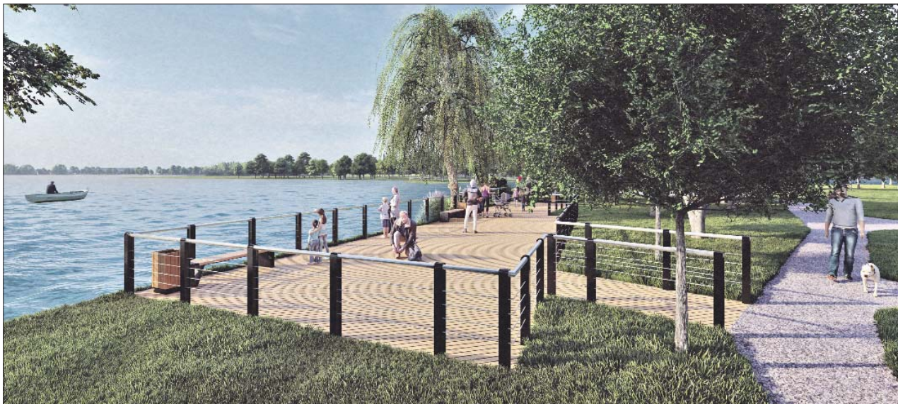
Проект благоустройства зоны отдыха в Косино-Ухтомском

На месте существующего футбольного поля у Чёрного озера создадут спортивный кластер. Там появятся площадки для игры в футбол, теннис, баскетбол, а