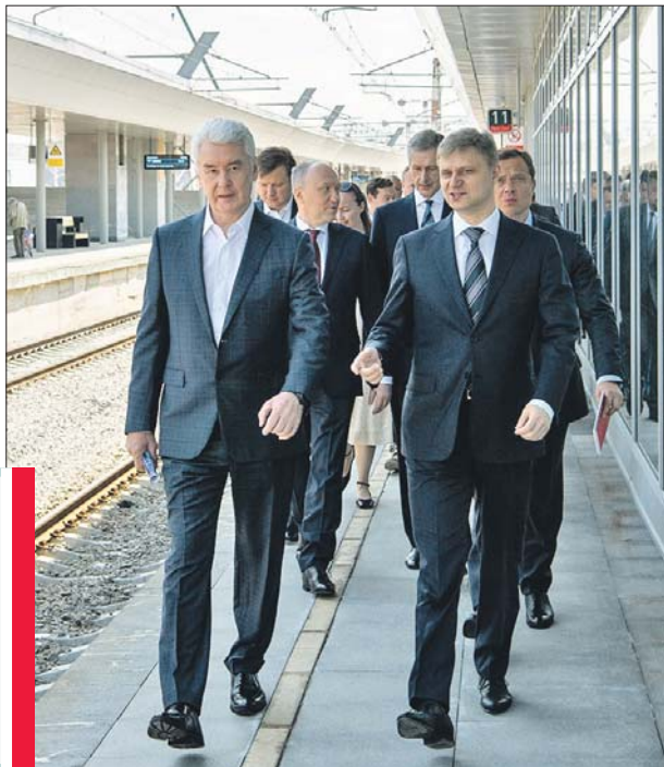
Сергей Собянин на станции Площадь трёх вокзалов

НА НОВОМ ВОКЗАЛЕ УСТАНОВИЛИ ЭСКАЛАТОРЫ И ЛИФТЫ