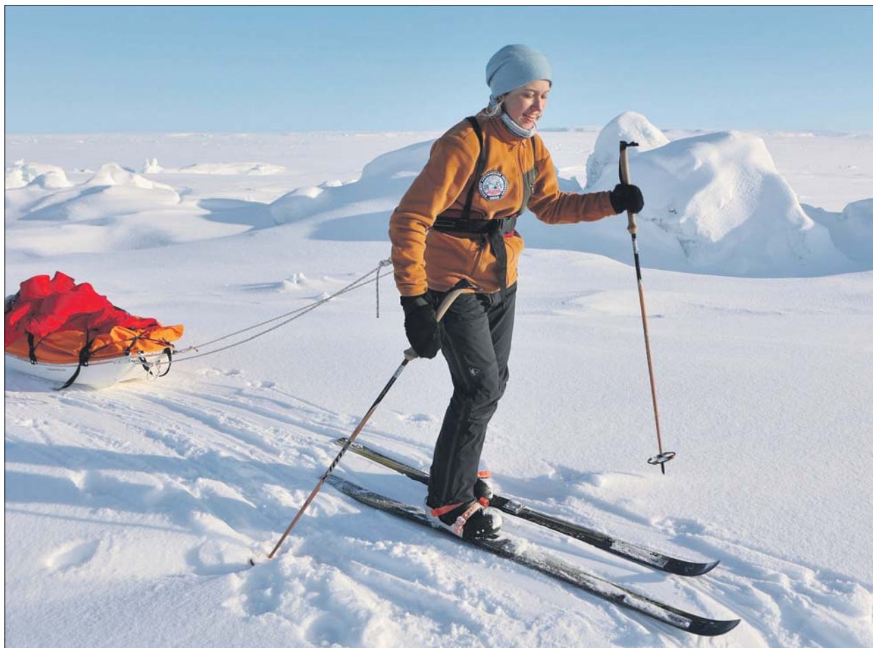
Александре ходить в серьёзные походы не впервые

Студентка из Перова участвовала в Большой Арктической экспедиции