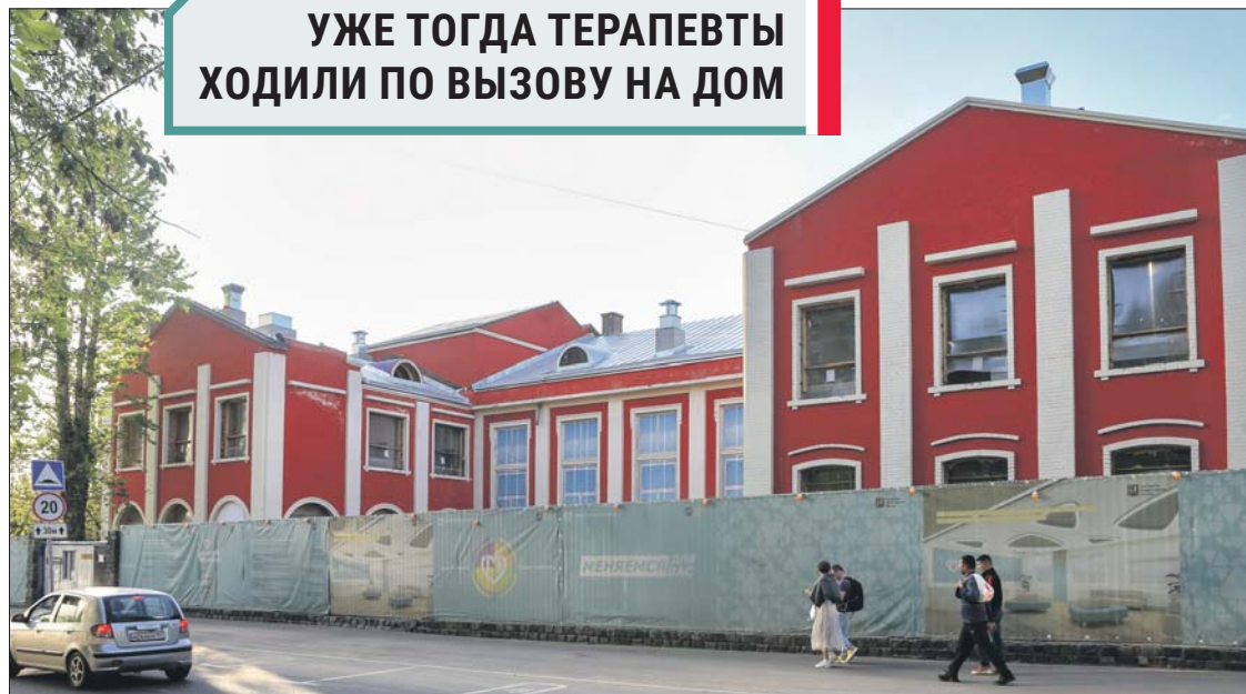
Здание на Малой Семёновской откроют в конце этого года