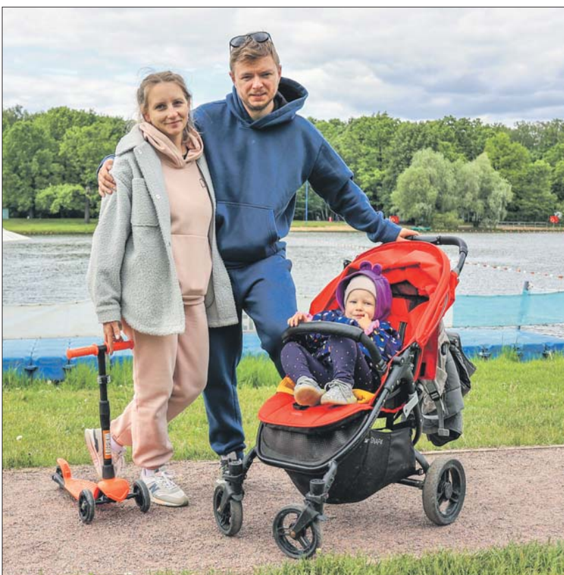
Просто погулять здесь тоже приятно