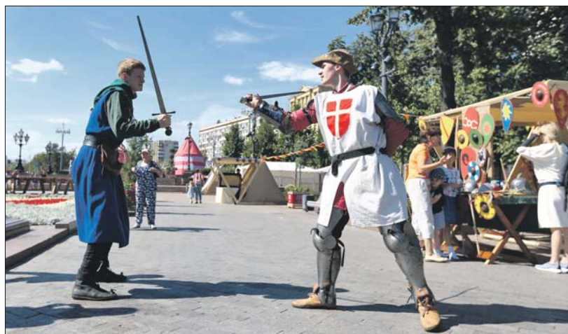
Амуниция реконструкторов скопирована с исторических образцов

В ВАО развёрнуты четыре фестивальные площадки. На Святоозёрской ул., вл. 1, можно ознакомиться с военно-исторической миниатюрой, на Вешняковской ул., вл. 16, Российская академия художеств предлагает принять участие в мастер-классах. Интересные факты об истории и правилах дуэли можно узнать на Городецкой ул., вл. 1, а в сквере у Гольяновского пруда — совершить путешествие в античный Крым. В будни площадки открыты с 12.00 до 20.00, в выходные — с 11.00 до 21.00.