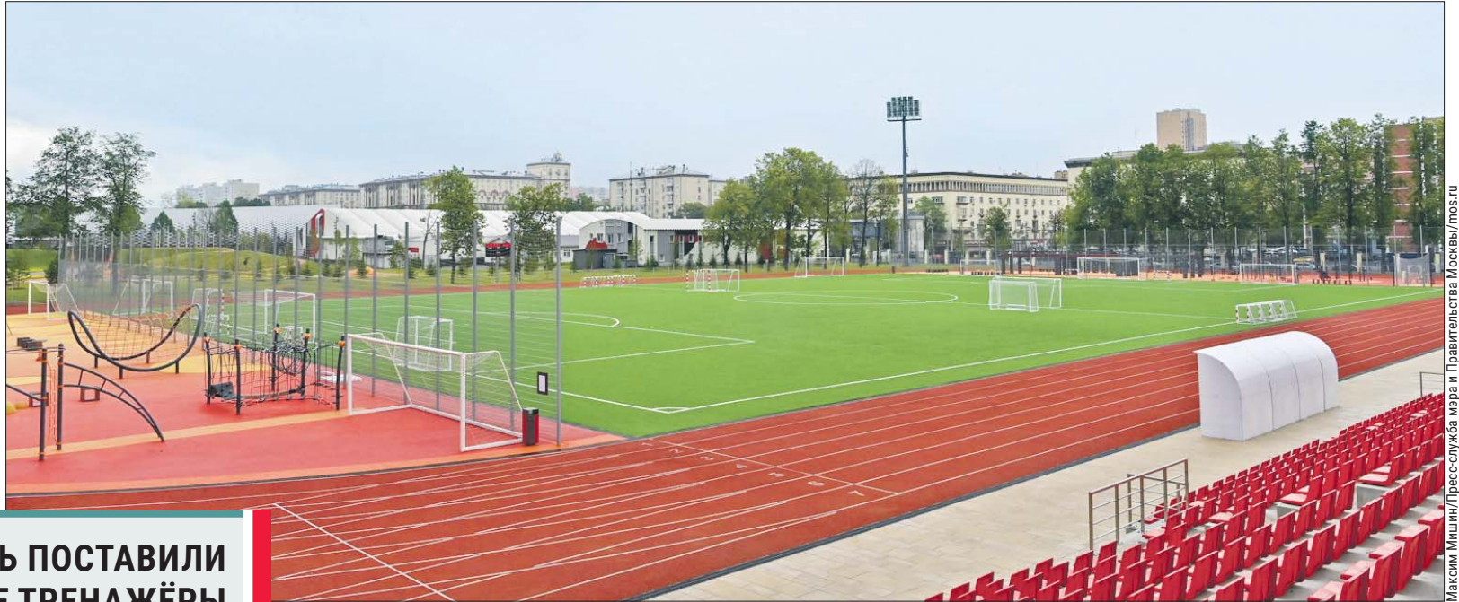
Новое футбольное поле — главная фишка «Авангарда»

Стадион до начала реконструкции был похож на руины и никем не использовался. По многочисленным просьбам жителей провели полную реконструкцию. Теперь же «Авангард» — это современный стадион с шестью спортивными площадками для занятий разными видами спорта. Есть фитнес-зона со специальными трена-