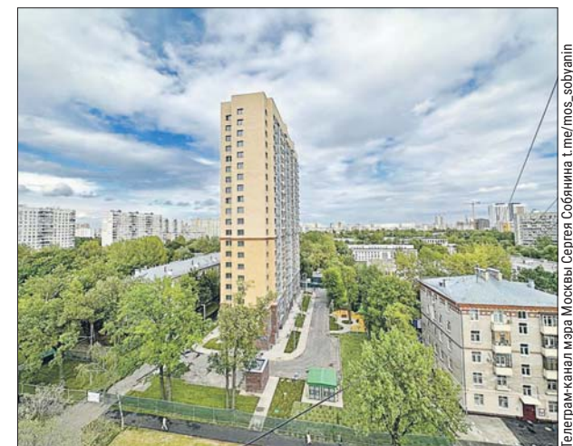
Многоэтажку на Свободном проспекте почти доделали

дома, в новых квартирах отметят новоселье 16 тысяч человек», — написал Сергей Собянин.