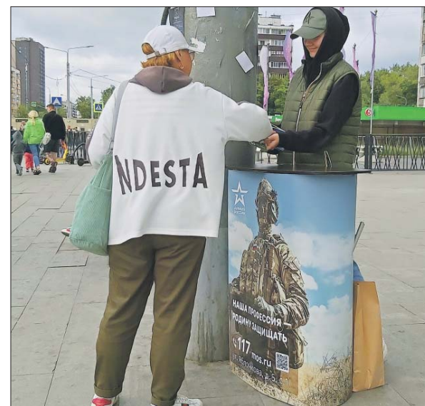
Стойка у входа в ТРЦ «Щёлковский»