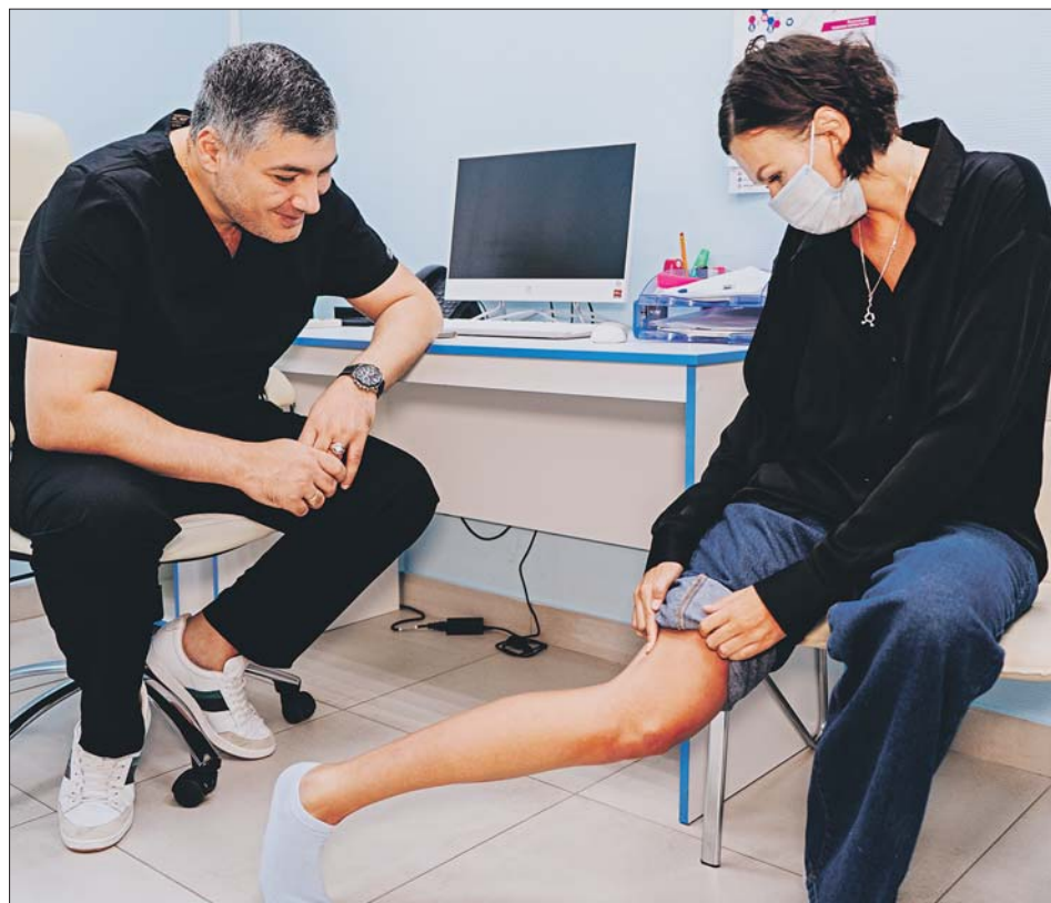
Болезнь нельзя пускать на самотёк

ДОБАВЛЕНИЕ В РАЦИОН РЫБЫ, ПТИЦЫ, ПЕКИНСКОЙ КАПУСТЫ И ЯГОД СНИЖАЕТ РИСК ВАРИКОЗА