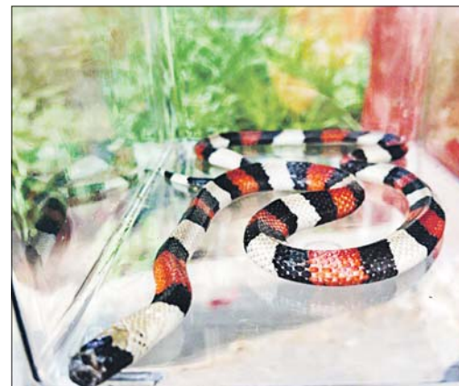
Эта красotka неядовита