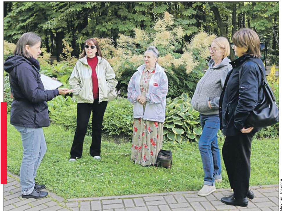
Наглядные уроки ландшафтного дизайна в Измайлове

На занятия по ландшафтному дизайну вход свободный, расписание можно найти на официальном сайте парка izmailovsky-park.ru в разделе «Чем заняться». А на занятия по