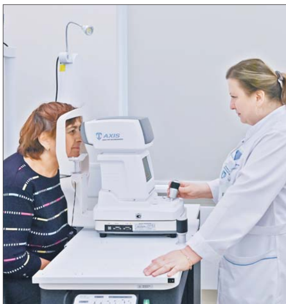
Новая поликлиника в Новогирееве приняла первых пациентов

Первых пациентов на днях также приняли обновлённые поликлиники в Очаково-Матвеевском, Орехово-Борисове, Южном Бутове и Северном Тушине.