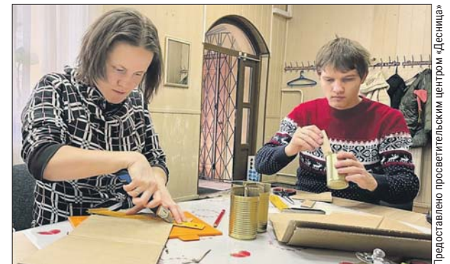
Для добровольных помощников здесь всегда есть работа