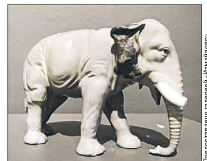
Ухо слона хранит следы пальцев скульптора Меркулова

до 4 сентября. Выходной — понедельник (0+).