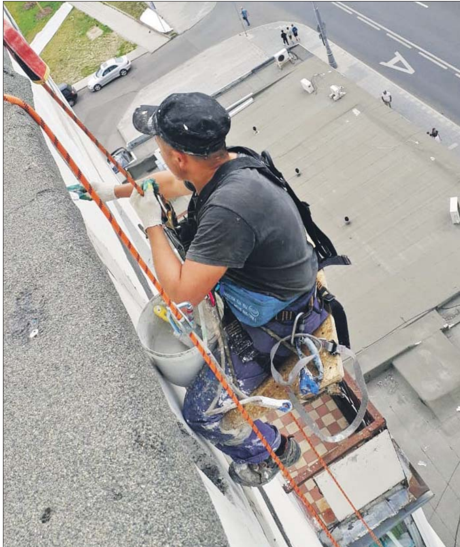
Работы на фасадах проводят только в тёплое время года

Коммунальщики добавили, что проницаемость межпанельных швов может привести к неприятным последствиям. Помимо того что в тёплое время года после дождей в квартиру может проникнуть вода, зимой из-за перепадов температур в стенах может появиться конденсат. А это чревато образованием плесени под обоями. Также при сильных ветрах в квартиру может задувать с улицы. И тогда зимой никакое отопление не поможет — придётся одеваться теплее даже дома. Именно поэтому при подготовке к новому отопительно-