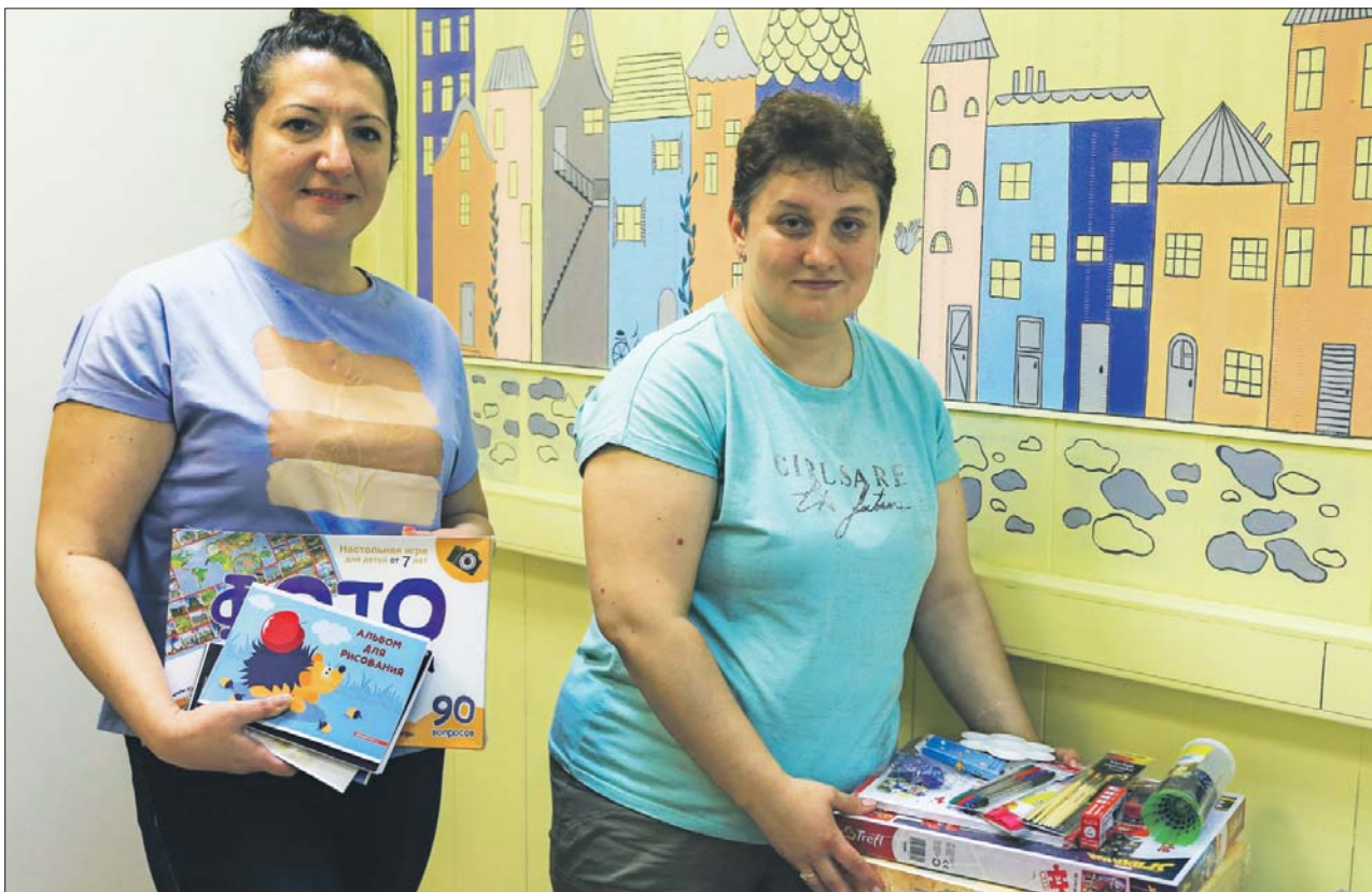
Волонтеры «Ладощки» собирают наборы для детского творчества

Центру в Новокосине нужны волонтеры и бытовая техника