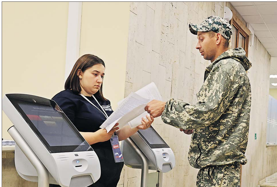
Пункт отбора на контрактную службу на улице Яблочкова, 5

Почему жители округа идут служить по контракту