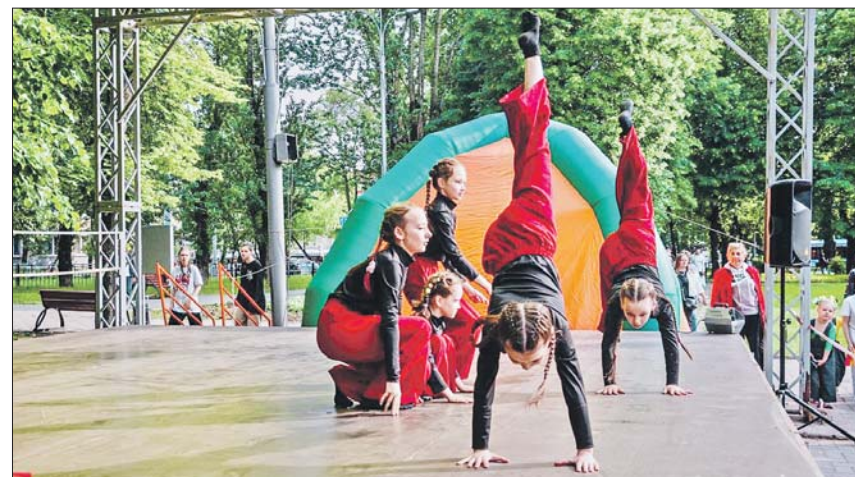
Это и танец, и акробатика