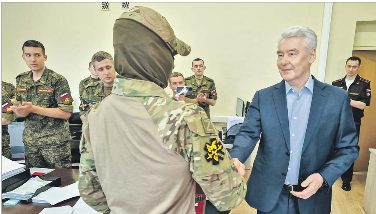
Сергей Собянин поздравил одного из участников встречи с присвоением офицерского звания