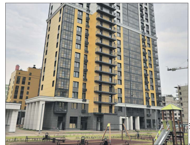
Дом строили с использованием информационной цифровой модели