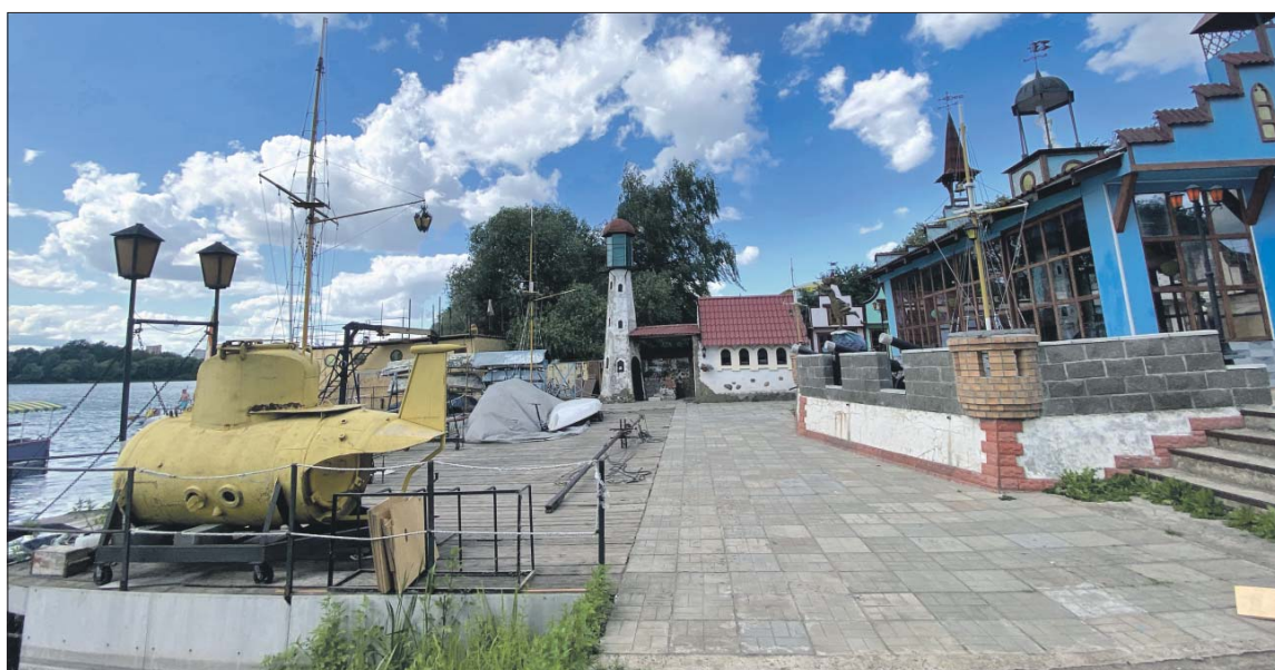
У клуба есть своя флотилия, верфь и даже порт

МЕЖДУ ЧЁРНЫМ И БЕЛЫМ ОЗЕРОМ ПРОЛОЖАТ ЕДИНЫЙ ПЕШЕХОДНЫЙ МАРШРУТ