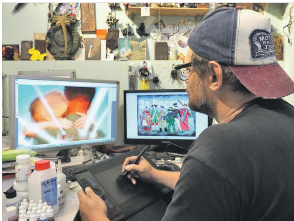
В графических программах он настоящий дока

— Координатор движения предлагает свои идеи,