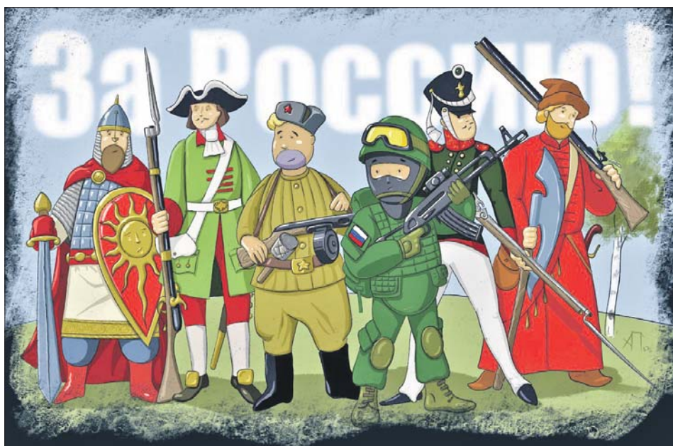
Рисунок с кратким названием «За Россию!»