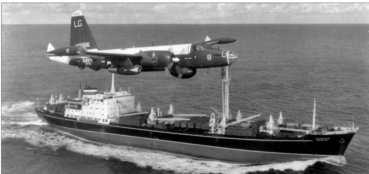
Патрульный самолёт США над советским судном. 1962 год