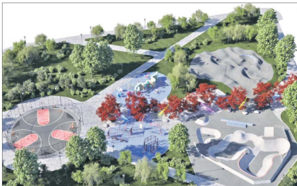
Так должно измениться место, где сейчас стоят старые гаражи