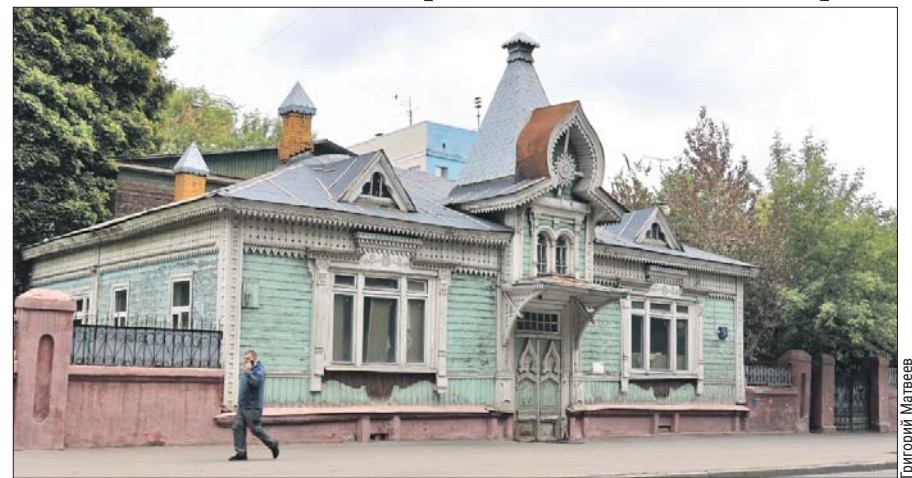
«Жилой дом Страховых» охраняется государством