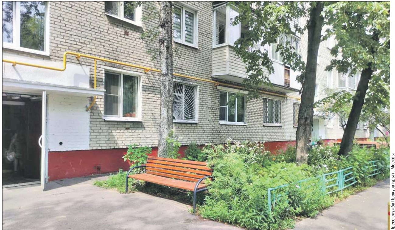
Дом на Оренбургской. Здесь и произошло несчастье с ребёнком

Сейчас Перовская межрайонная прокуратура контролирует ход проверки, которая должна уста-