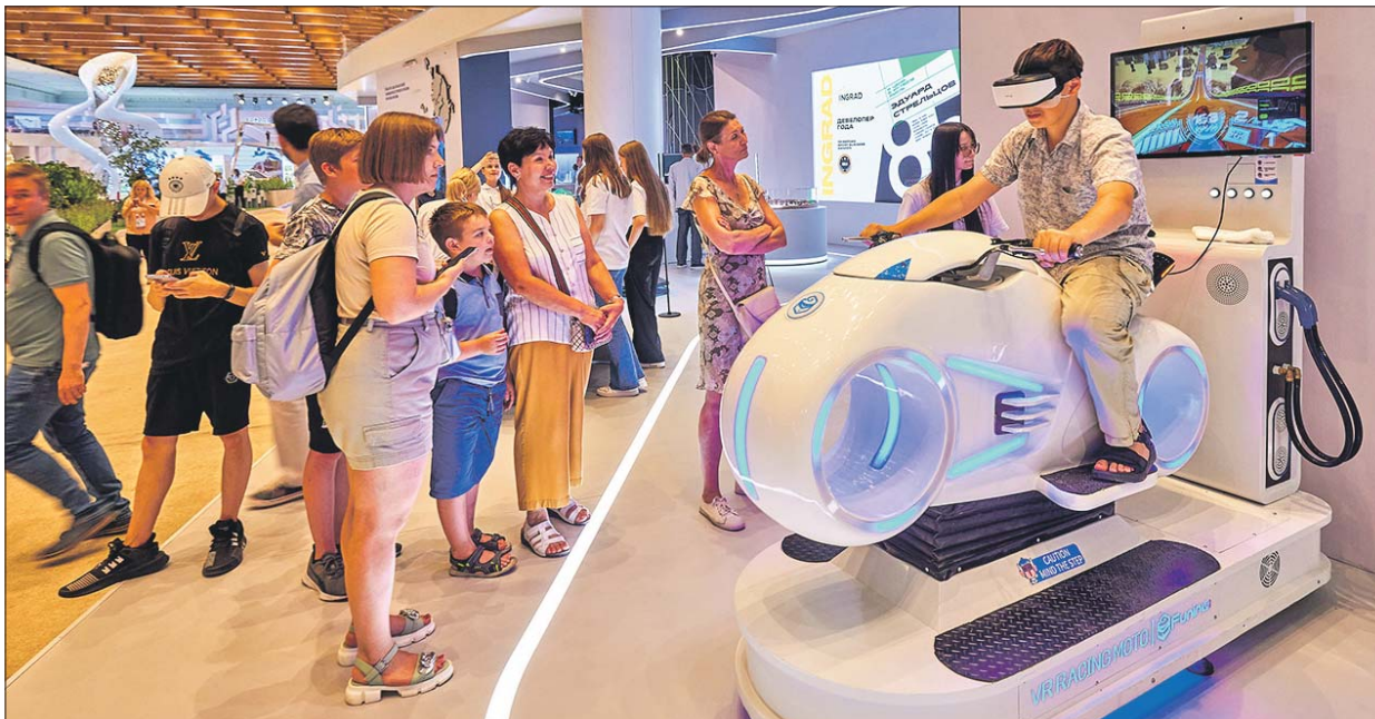
На форуме гостей знакомят с передовыми технологиями

Чем удивит Москва участников и гостей Урбанфорума