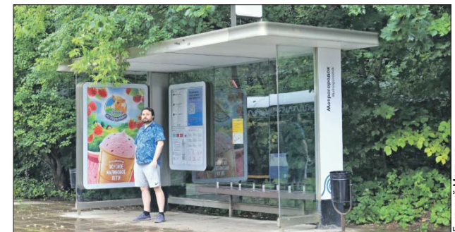
Крыши павильонов стали шире