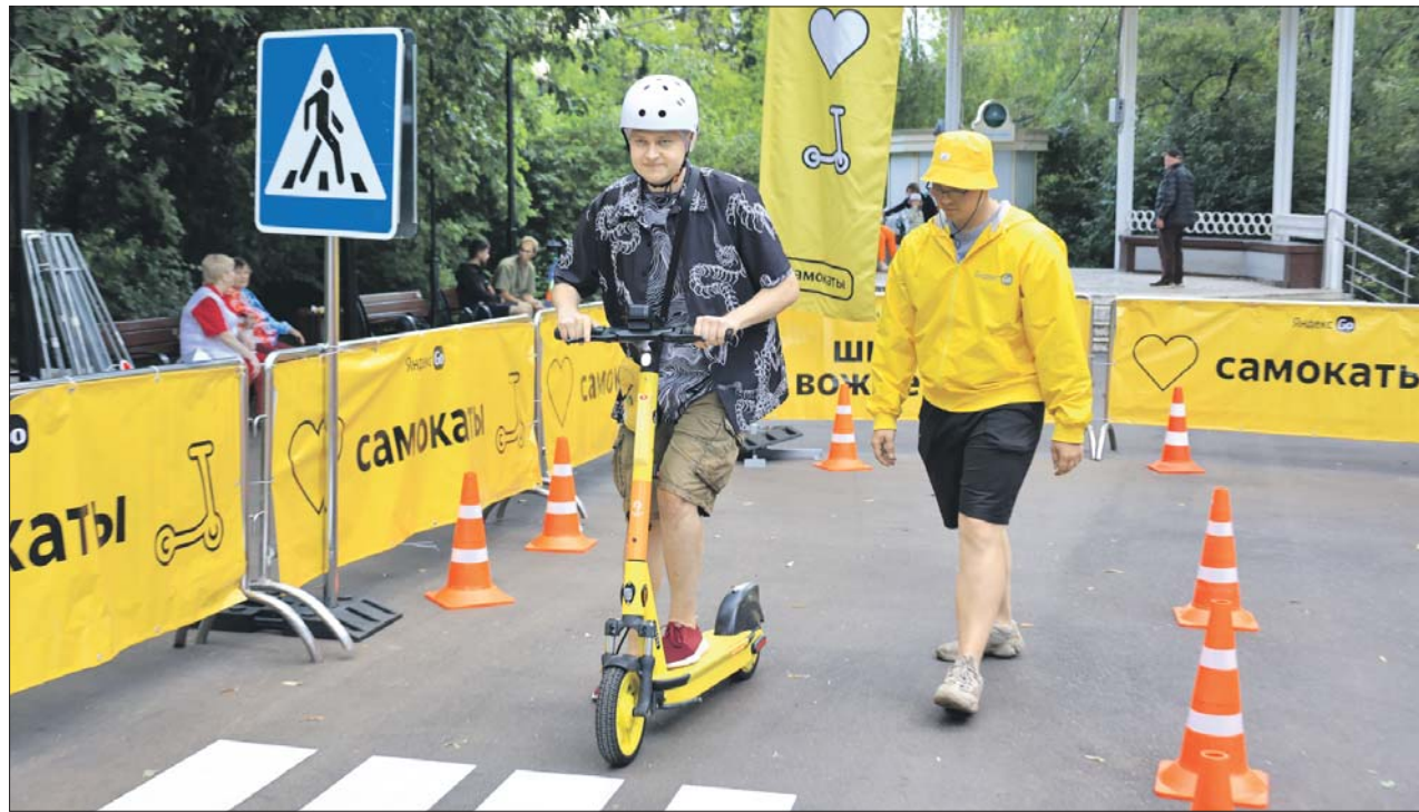
Терпение инструктора наш корреспондент испытывал около часа

Посетителям выдают одноразовые шапочки и шлемы. За каждым новичком закреплён инструктор, который будет обучать и