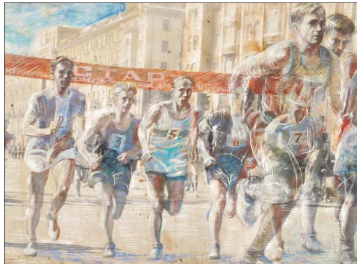
Здесь отражены самые значимые события 1947 года

Авторы панно — архитекторы Николай Шумаков и Александр Некрасов, а также художник Александр Рукавишников.