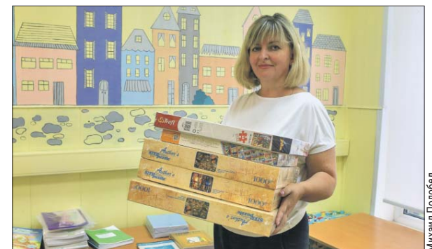
Центр «Ладощка счастья» помогает многим семьям