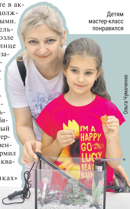
Детям мастер-класс понравился