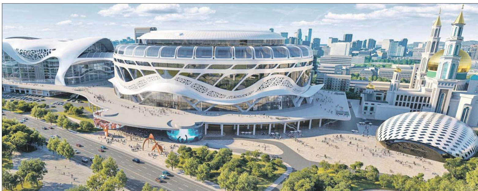
Новый спорткомплекс будет состоять из четырёх сооружений

ПОЯВИТСЯ ПРОГУЛОЧНАЯ ЗОНА МЕЖДУ КОРПУСАМИ — ОЛИМПИЙСКИЙ БУЛЬВАР