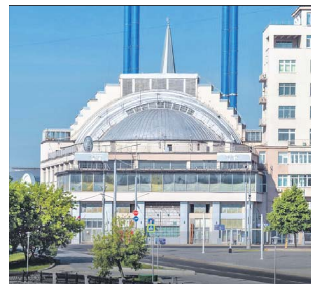
Купол над залом снова будет открываться

После завершения реставрации в кинотеатре будут проходить кинопоказы, премьеры и фестивали. В здании разместят несколько кинозалов, кафе, книжный магазин, помещения для просветительских и выставочных проектов. На крыше откроют террасу и смотровую площадку.