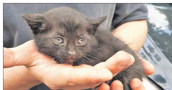
Котёнок охотно отдался в девичьи руки

— Малыша виртуозно достала хрупкая девушка-спасатель. Она сумела про-