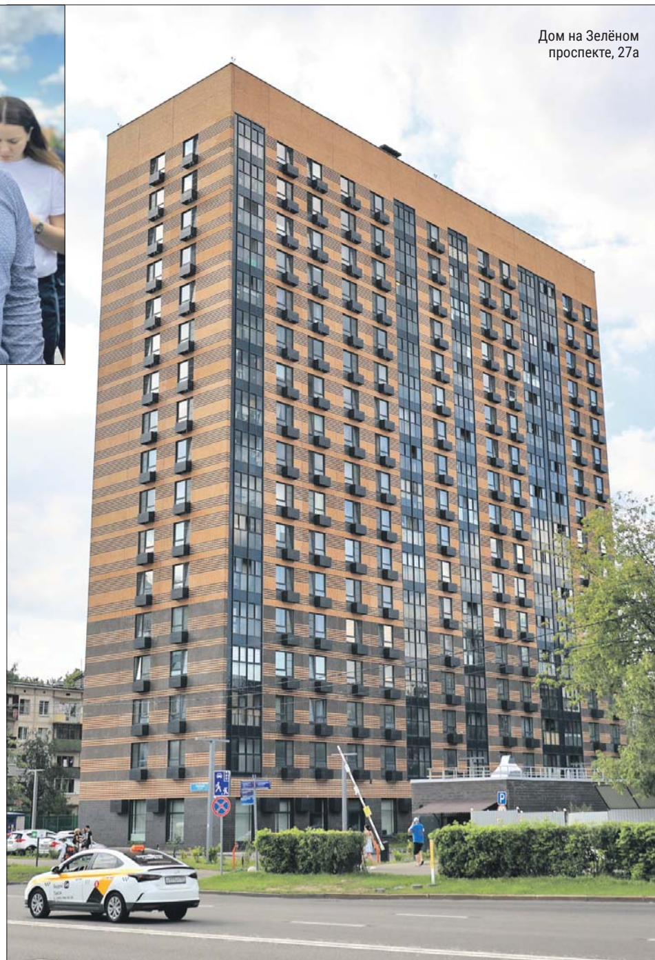
Дом на Зелёном проспекте, 27а

Город активно помогает новосёлам при организации переезда.