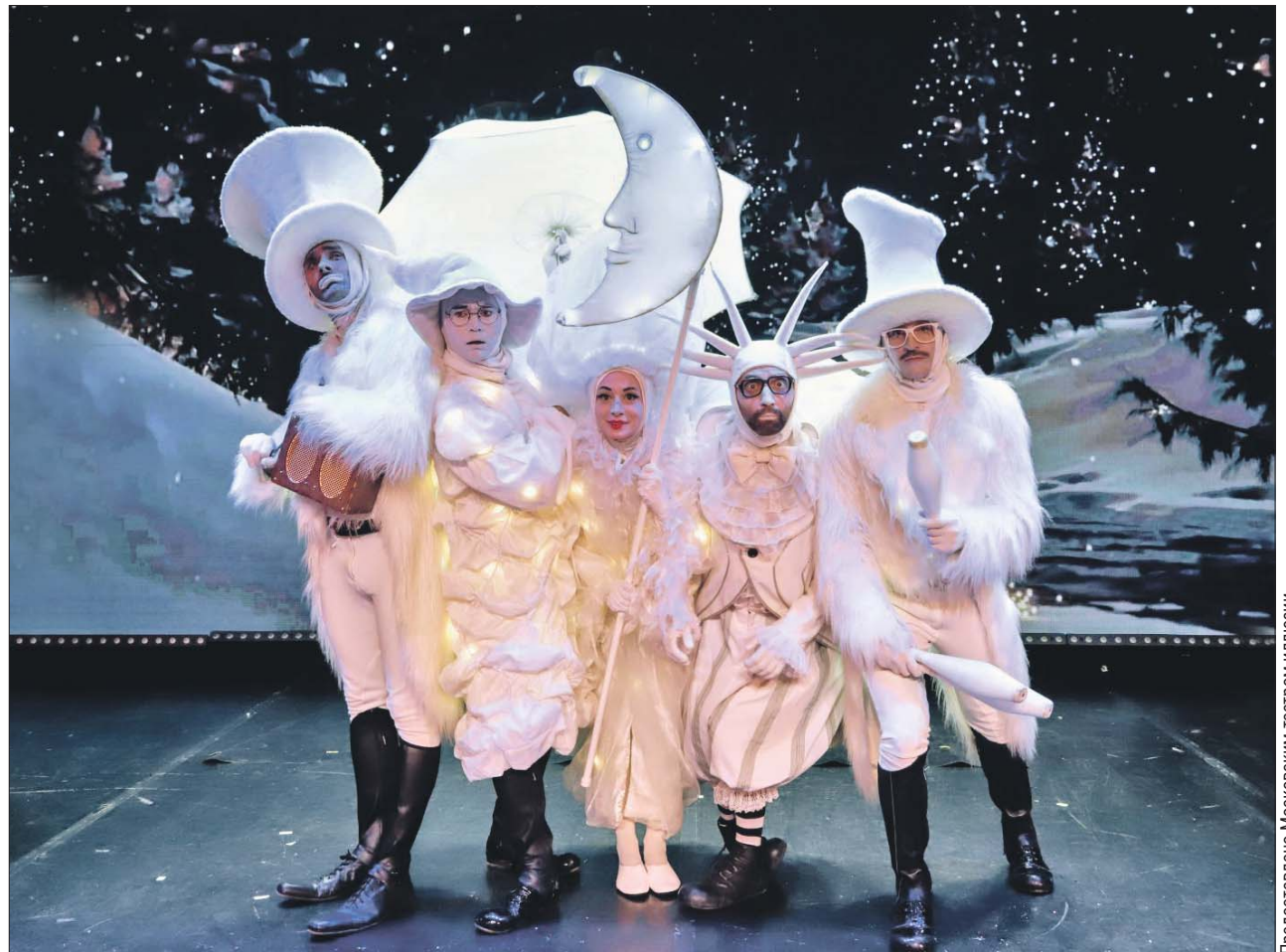
Сцена из спектакля «Королевство цыркляндия»

Премьеры сезона в Московском театре иллюзии