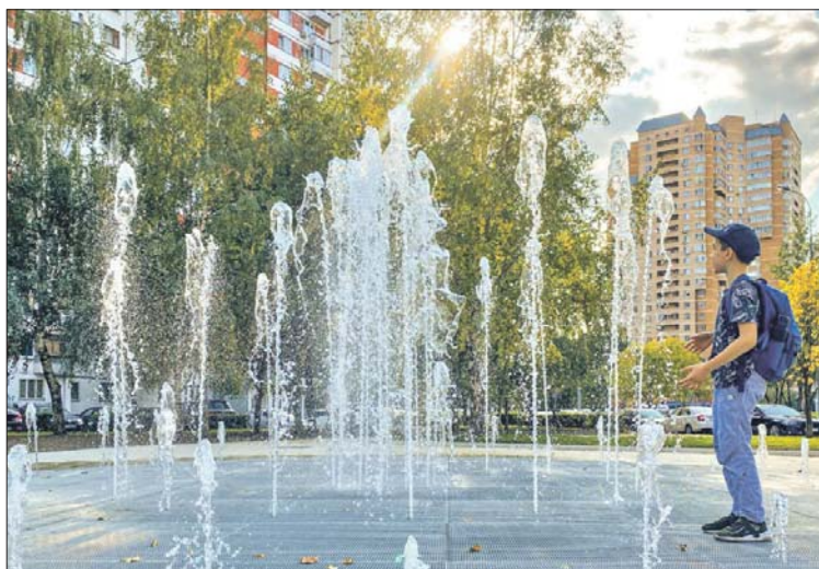
«Сухой» фонтан на Новокосинской

В районе Ивановское благоустроена улица Сталеваров. От Новогиреевского пруда проложен удобный пешеходный маршрут с уличными фонарями в сторону города Реутова.