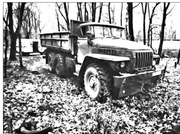
Тот самый «Урал» на месте преступления

Житель Владимира 44 лет попал в базу, когда его проверяли на причастность к краже на работе, но тогда он действительно оказался ни при чём.