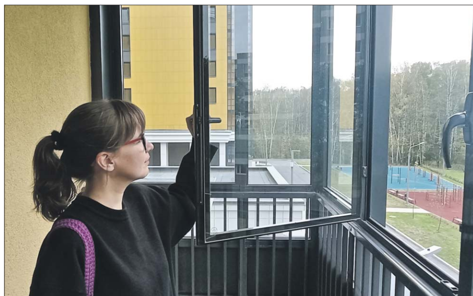
Знакомство с новым домом