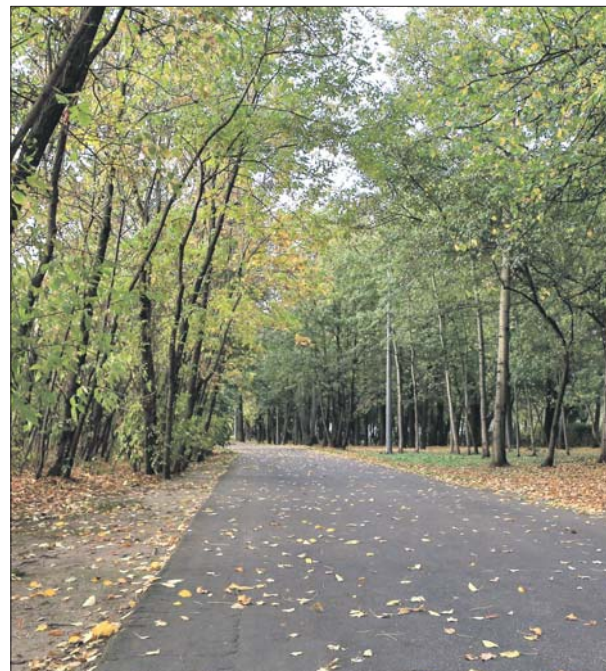
Трагедия произошла в этом уголке Измайловского парка

Все эти годы он вёл примерный образ жизни, у него жена и взрослый сын, которые не догадывались о его злодеянии.