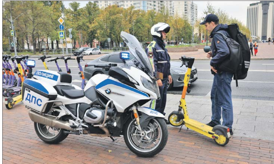
Самое распространённое среди самокатчиков нарушение — проезд по «зебре»

— Перед переходом надо обязательно сойти с самоката и вести его рядом с собой до следующего тротуара. Если в толпе человек