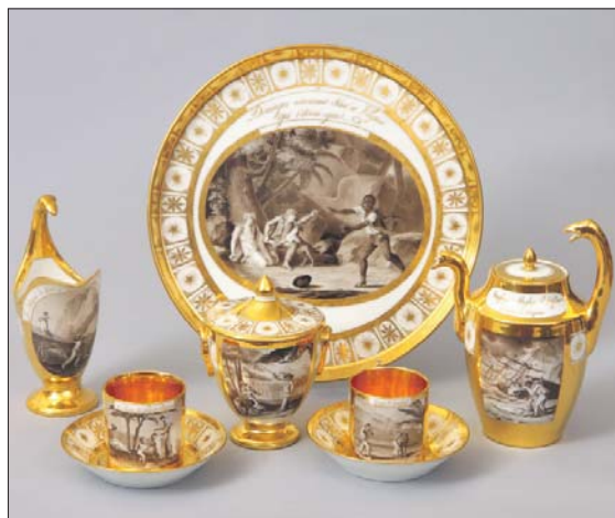
Французы любили писать картины на тарелках