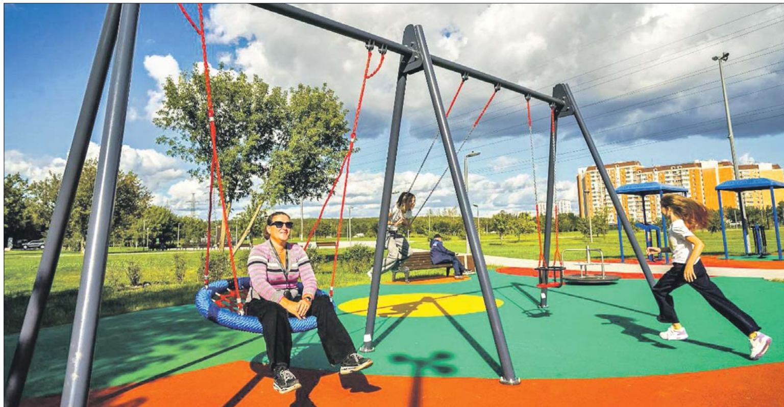
В парке у Святого озера

Теперь в парке можно отдохнуть на поляне с шезлонгами, заняться йогой и физкультурой на специальной площадке, поиграть в футбол на поле с новым искусственным газоном, прокатиться на велосипеде по новой дорожке, а в скейт-парке попрыгать через препятствия. Для детей у озера сделали детскую площадку с игровым комплексом в виде корабля.