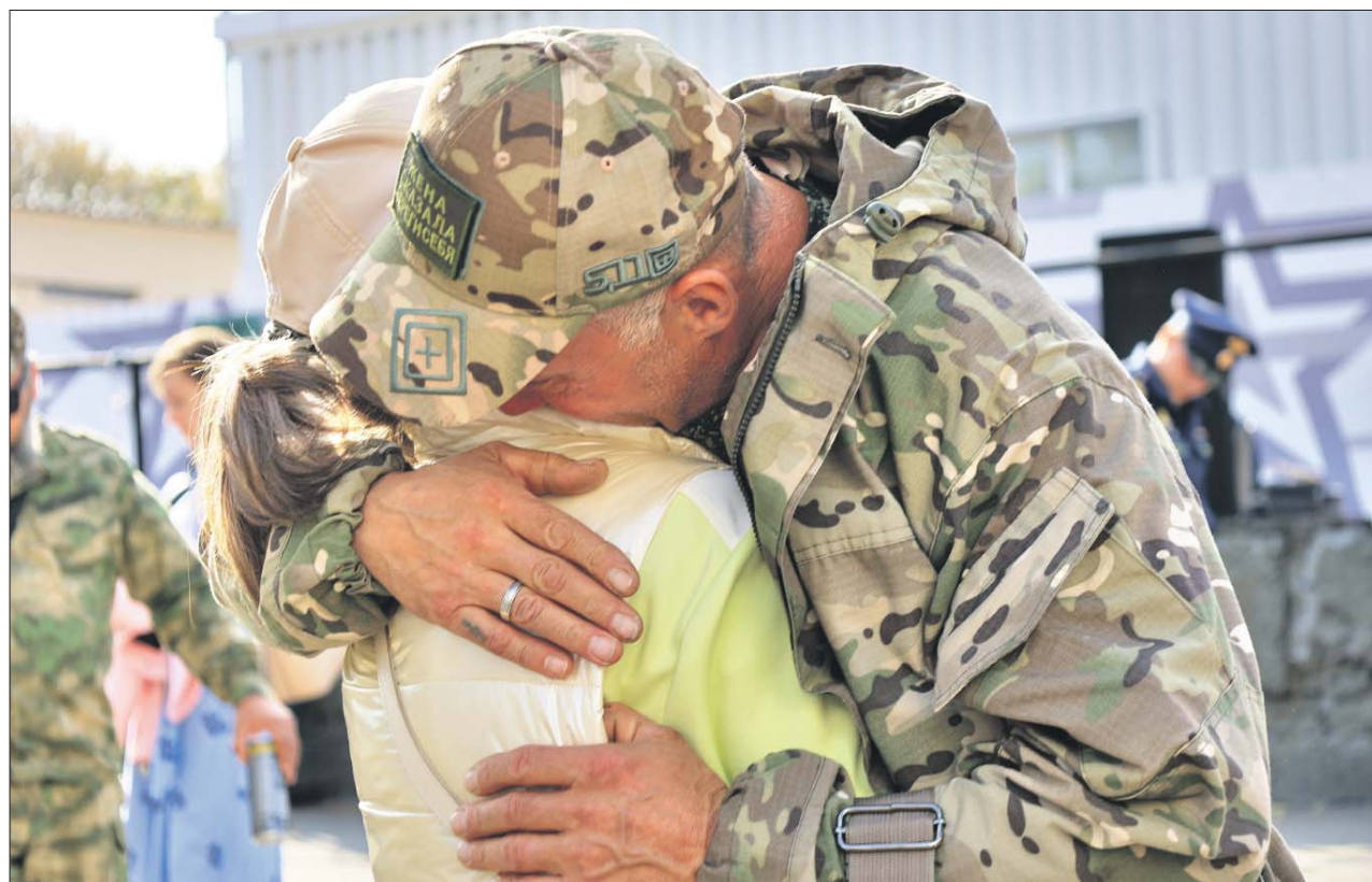
Он обещает, она надеется

Между тем приходит время отправления к местам службы. Будущих солдат приглашают к автобусам. Родные и близкие желают новобранцам удачи, обнимают. Людмила, например, про-