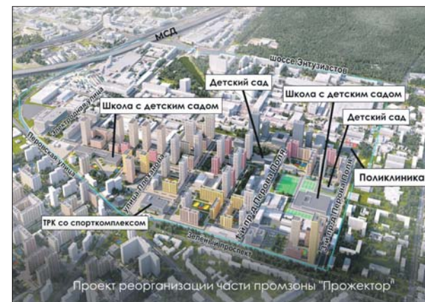
Проект застройки промзоны

Реализация проекта позволит создать комфортные условия для проживания более чем 17,6 тысячи человек, а также около 10 тысяч рабочих мест.