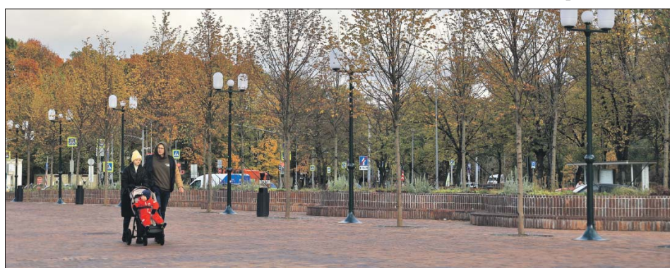
У станции БКЛ «Сокольники» установили новые фонари

Город завершил благоустройство территории около 10 станций Большой кольцевой линии. Об этом в своём телеграм-канале написал мэр Москвы Сергей Собянин.