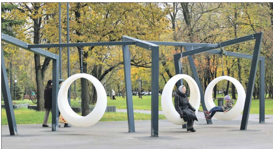
Такие качели по душе и детям и взрослым