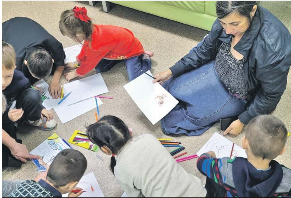
Наш корреспондент предложила ребятам что-нибудь нарисовать для одиноких бабушек

Корреспондент «ВО» вместе с волонтерами отвезла в детский социальный центр подарки от наших читателей