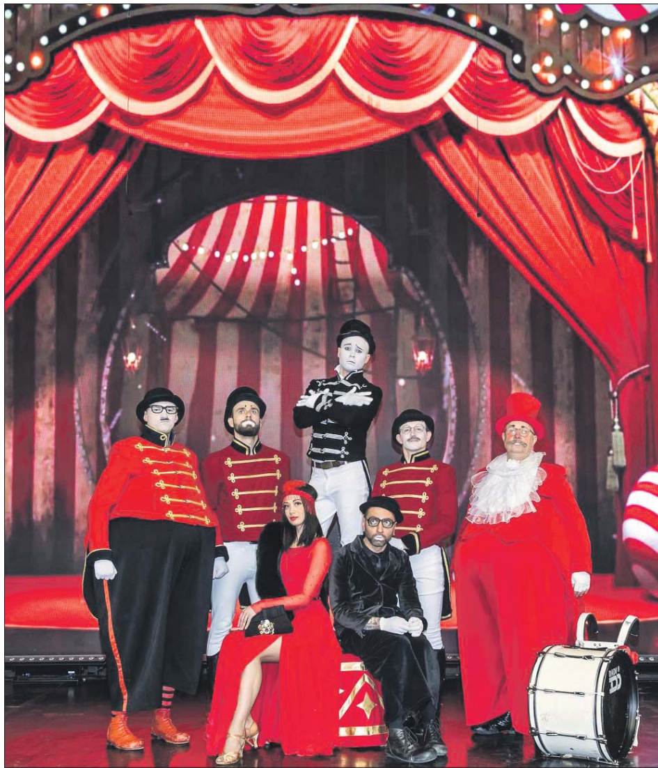
«Высокие братья» на сцене Московского театра иллюзии в Перове