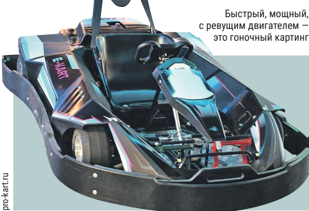
Быстрый, мощный, с ревушим двигателем — это гоночный картинг

Затем открыл интернет-магазин запчастей для таких машинок. Треков, где за деньги катались на картингах, в России было много. Продажи быстро пошли в гору.