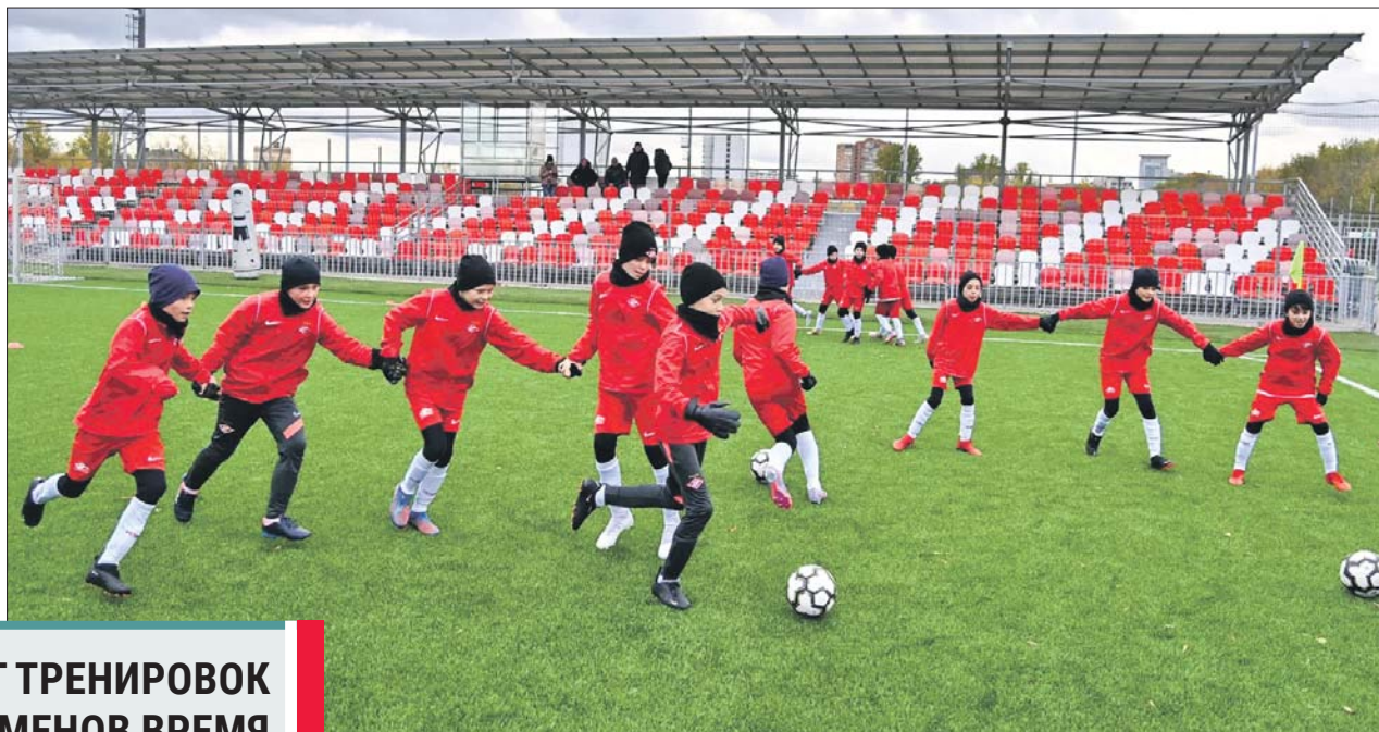
На поле — будущие звёзды «Спартак»

Футбольную академию имени Фёдора Черенкова в Сокольниках планируют реконструировать