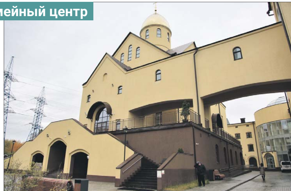
Храм соединён с семейным центром галереями

— Конечно. Это искусство, лишённое сладости земного бытия. Никакой красоты. Рядом с этими образами ничто не мешает