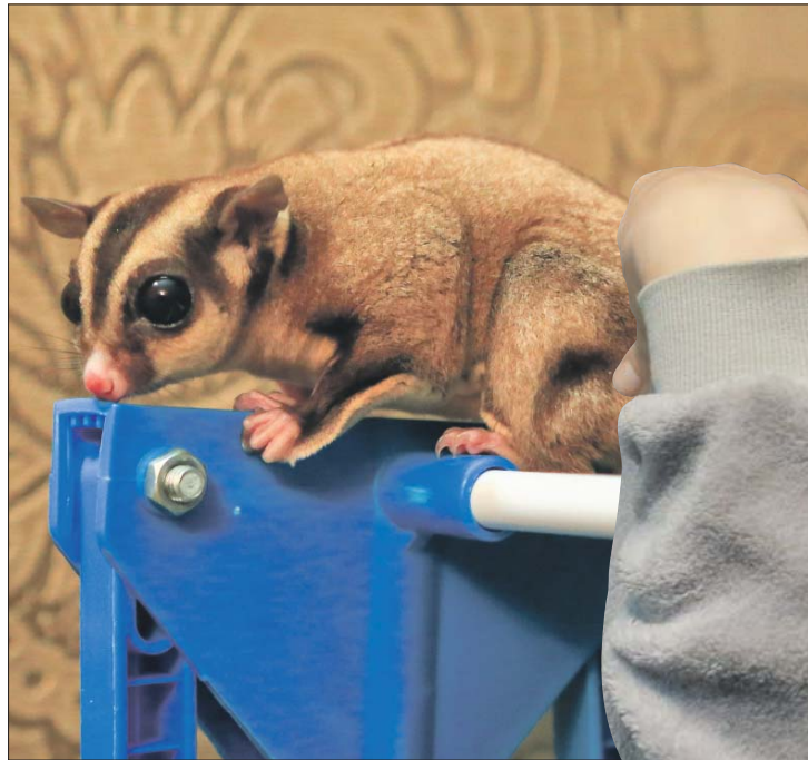
Стич потолстел и летает нечасто