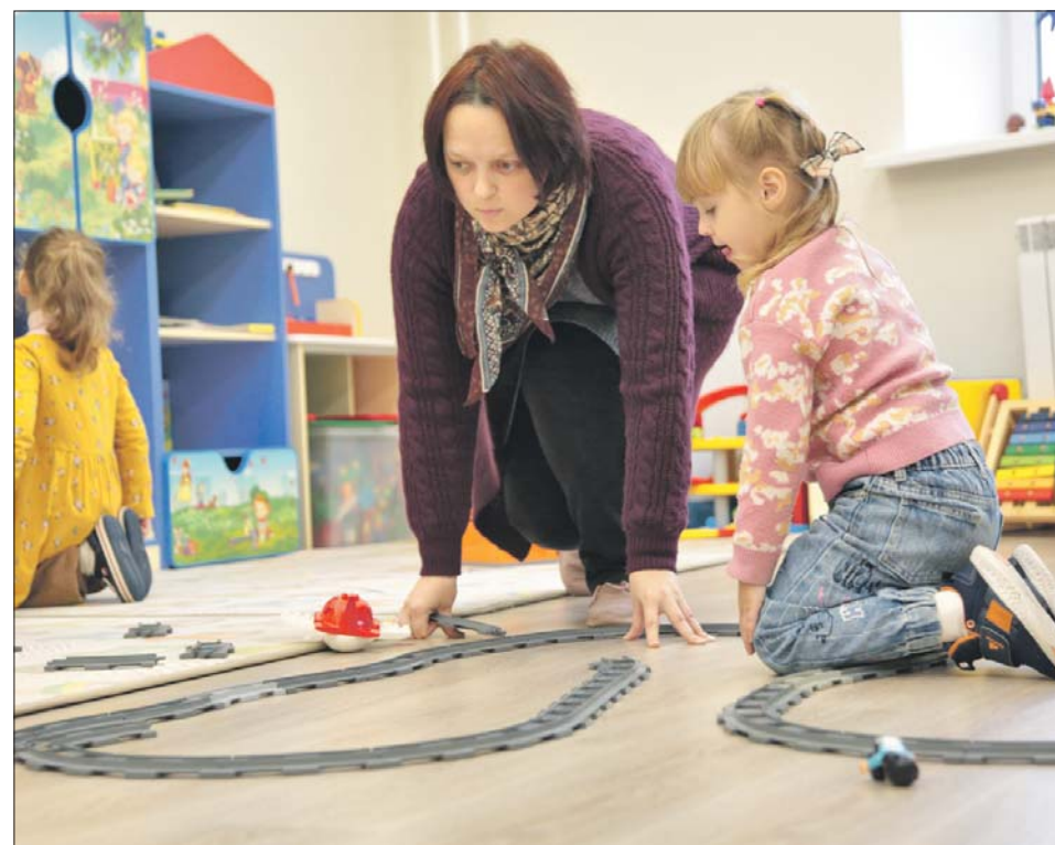
Здесь можно на полдня привести и оставить ребёнка