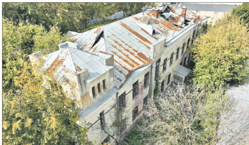
После реставрации в историческом здании будут действовать творческие и спортивные кружки и студии

Будут отреставрированы парадная лестница, метлахская плитка на полу и сохранившиеся своды Монье. Во всех помещениях установят деревян-