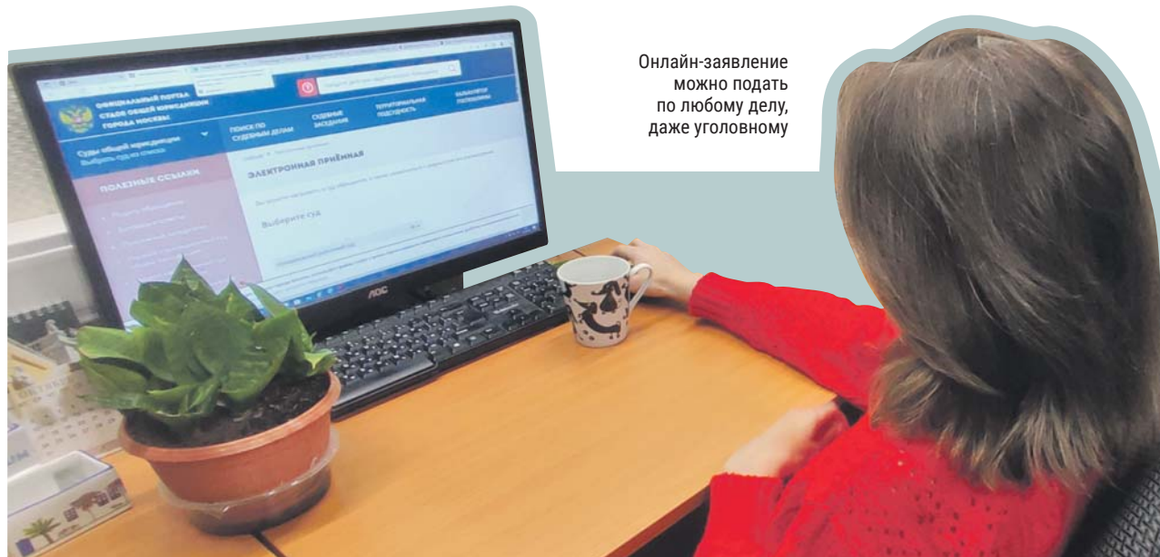
Онлайн-заявление можно подать по любому делу, даже уголовному

После входа система сама предлагает подать иск. Интерактивный помощник в диалоговом режиме помогает составить исковое заявление даже тем, кто совершенно не разбирается в юриспруденции, рассчитывает размер госпошлины и направляет иск в электронном виде в суд. Также на портале размещены типовые формы заявлений для разных случаев. Нужную мне форму подобрала быстро: споры в области ЖКХ очень