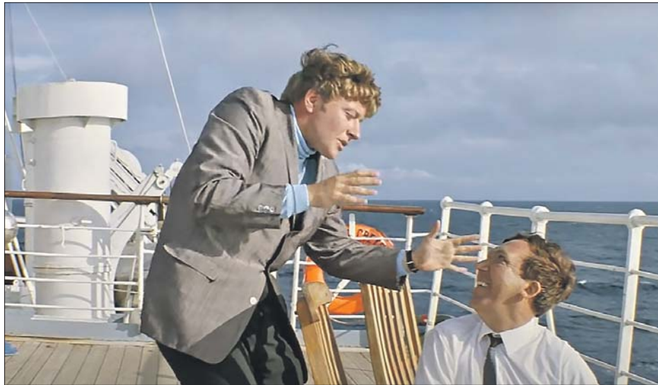
Кадр из фильма «Бриллиантовая рука»

▶ В Школе Арины Шараповой в рамках театрально-литературного проекта «Культурное пространство» состоялась творческая встреча с легендарным, одним из самых востребованных композиторов заслуженным деятелем искусств Александром Зацепиным. 97-летний Александр Сергеевич не только ответил на вопросы, но и сыграл свои нестареющие шлягеры, среди которых «Песня про зайцев», «Остров невезения», «Есть только миг» и многие другие.