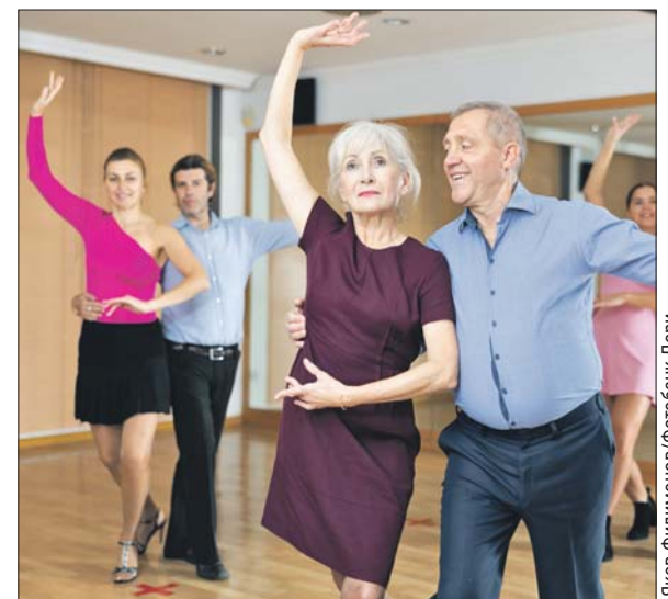
Пасодобль подходит для всех возрастов

Адрес: аллея Большого Круга, 7/а. Тел. (499) 166-6119