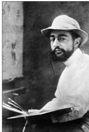
Анри де Тулуз-Лотрек

4 ноября галерея «Измайлово» приглашает на бесплатную программу, посвящённую ежегодной акции «Ночь искусств». Её главной темой станет творчество французского художника-постимпрессиониста XIX века Анри де Тулуз-Лотрека. В 19.00 всех желающих от 12 лет ждут на мастер-классе по рисованию в стиле художника. — Сначала участники познакомятся с картинами Анри Тулуз-Лотрека,