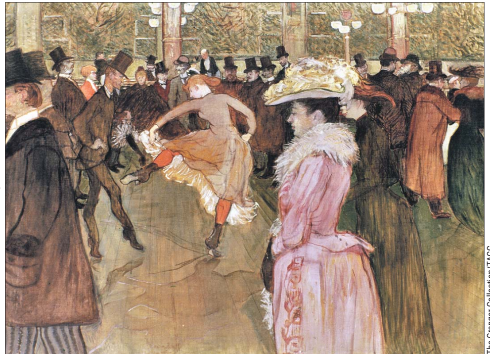
«Танец в «Мулен Руж», 1890 год