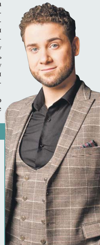
Предоставлено Владимиром Брилёвым