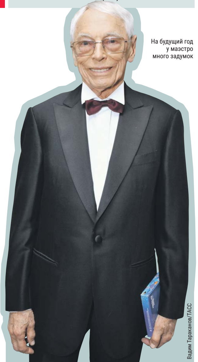
На будущий год у маэстро много задумок