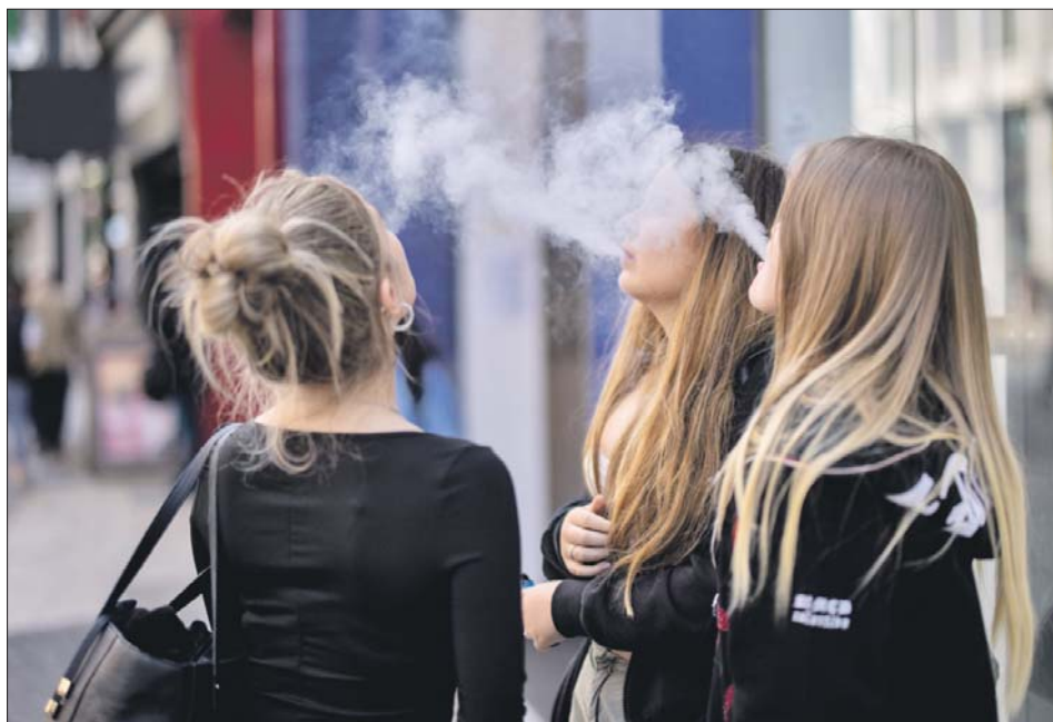
Подростки считают, что болезнью вейперов их просто запугивают

Мифы об электронных парилках развеяла врач из ВАО