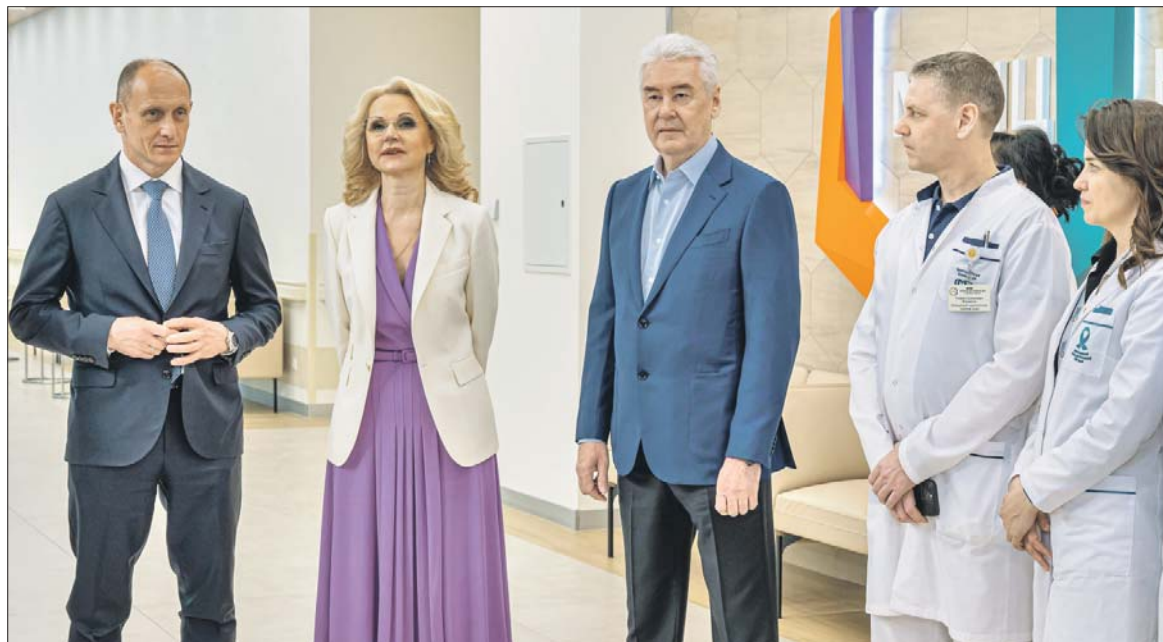
Вице-премьер РФ Татьяна Голикова и мэр Москвы Сергей Собянин во время посещения клиники. Июнь 2023 года

По словам мэра Москвы, при проектировании комплекса были