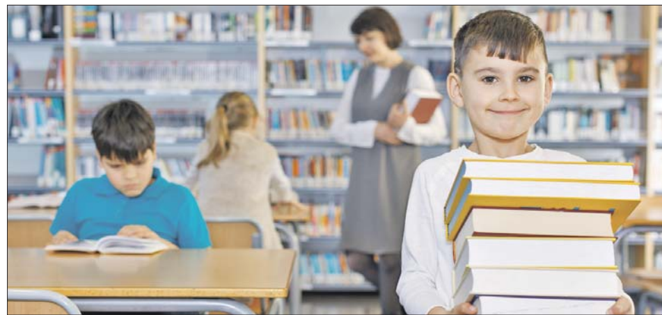
Семейные выходные можно интересно провести и в библиотеке

4 ноября библиотека №70 им. М.А.Шолохова (Халтуринская ул., 18) приглашает взрослых и детей старше 6 лет на познавательную программу «Семейные выходные».