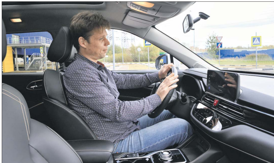
Звук мотора в салоне почти не слышен

Корреспондент «ВО» прокатился по дорогам округа на электромобиле «Москвич»