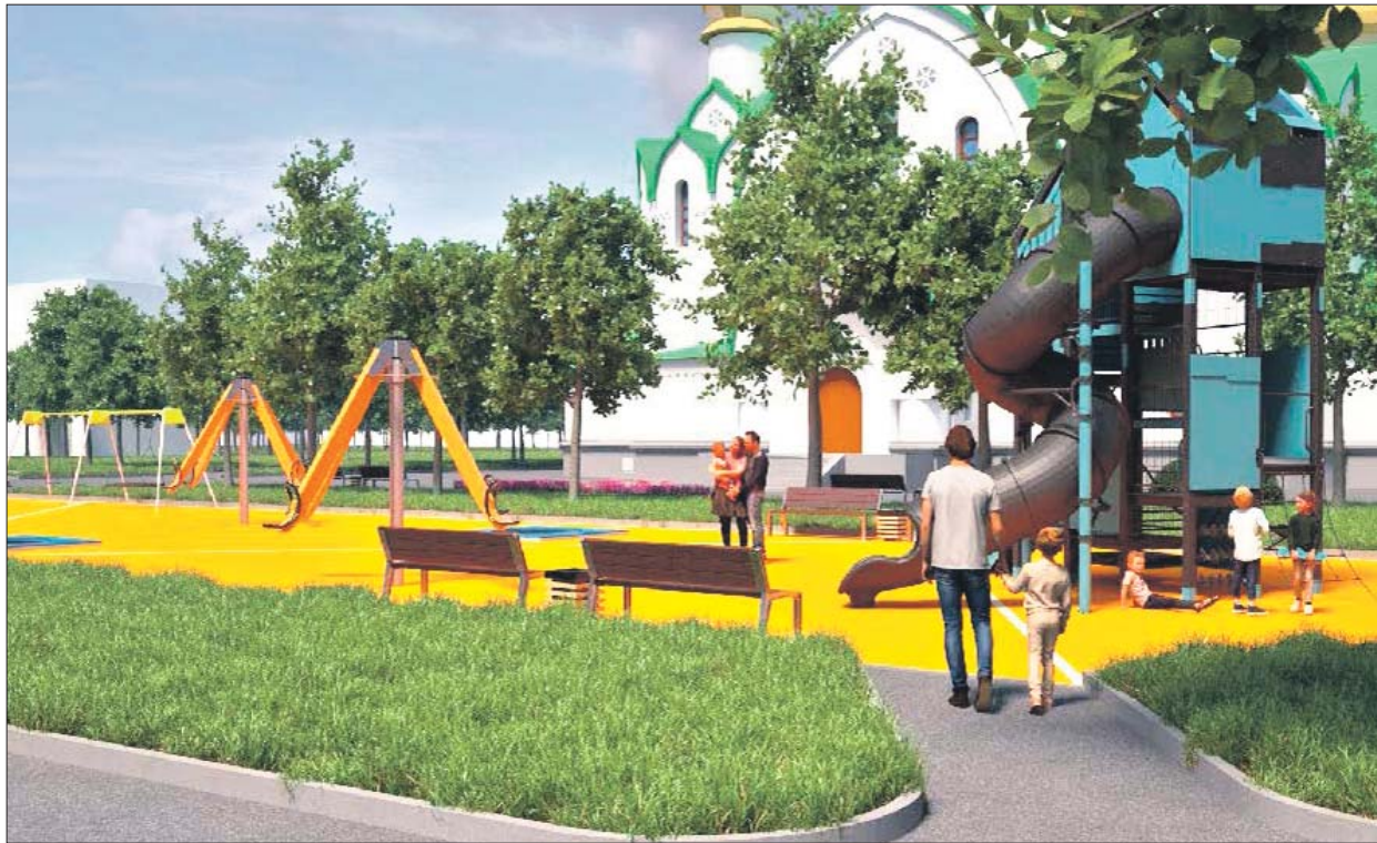
Площадь у церкви обустроят с учётом и мнения прихожан

С жителями Северного Измайлова обсудили планы благоустройства знакового объекта