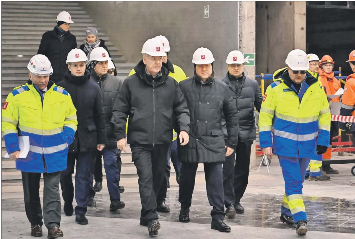
Сергей Собянин проверил, как идут работы на станции «Тютчевская»

Строящаяся Троицкая линия метро станет одним из самых протяжённых радиусов столичной подземки — 43 км. На линии будет 17 станций, она пройдёт от станции «ЗИЛ» МЦК до Троицка. Сейчас ведётся строительство первой очереди — участков Троицкой линии от станции «ЗИЛ» до станции «Комму-