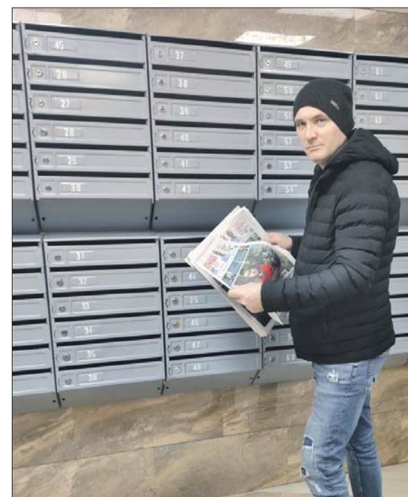
При такой подработке можно самому регулировать свой график