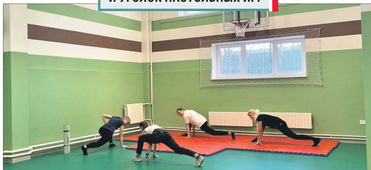
Фитнес-тренировки уже начались