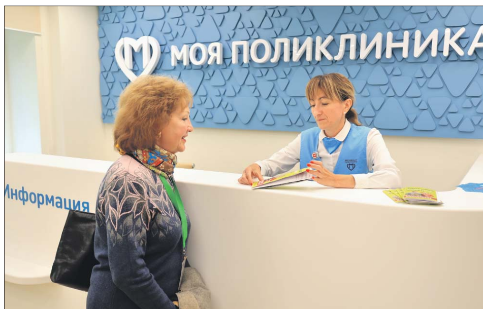
Модернизации системы здравоохранения будет уделено особое внимание

Поэтому бюджет сформирован на базе реалистичного прогноза: роста московской экономики, благодаря замещению импорта, выхода московской продукции на новые рынки, сохранения мер