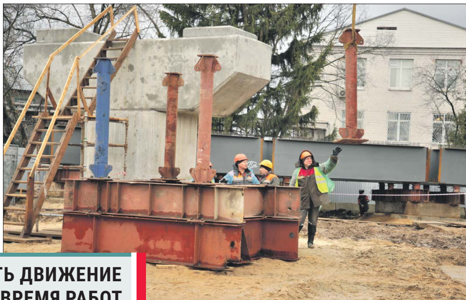
Из этих конструкций формируют основу будущей эстакады