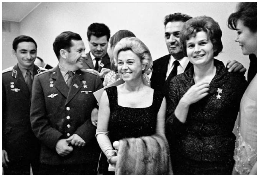
Среди новинок Мультимедиа Арт Музея — снимок Джульетты Мазини и Федерико Феллини с советскими космонавтами

В Музей К.Г.Паустовского поступил архив писателя 1940-1960-х годов. Государственный музей А.С.Пушкина получил в дар от мецената Михаила Карисалова картину немецкого художника Карла Шульца «Казачий разъезд» и 14 работ русских мастеров первой четверти XIX — начала XX века. Карисалов также передал городу редчайшие образцы «гротической» скульптуры — «Дантист (Цирюльник)» и «Скупой муж». Новый экспонат появился и в Доме Н.В.Гоголя — шкатулка Марии Александровны Быковой (урождённой Пушкиной).