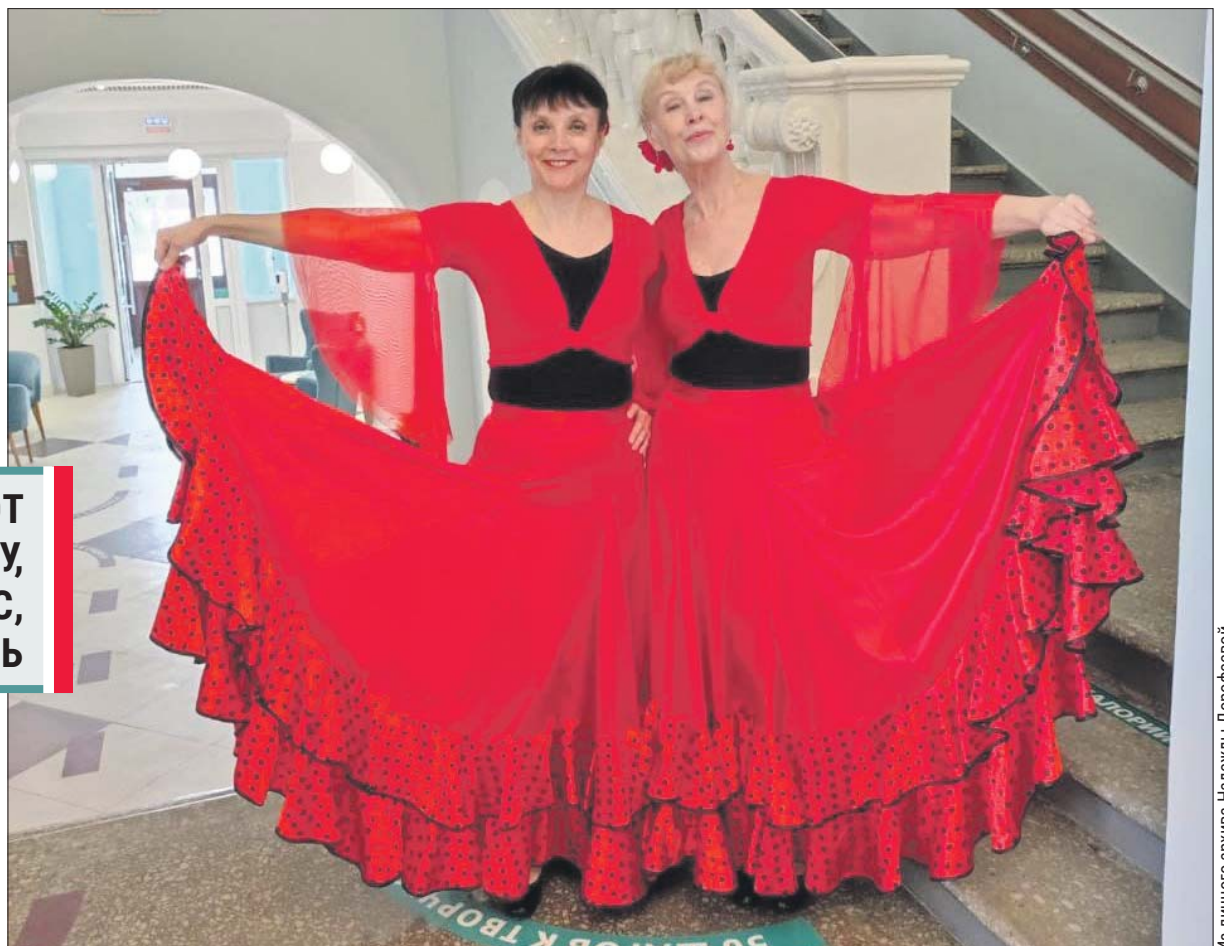
Участницы серебряного возраста готовы исполнить фламенко