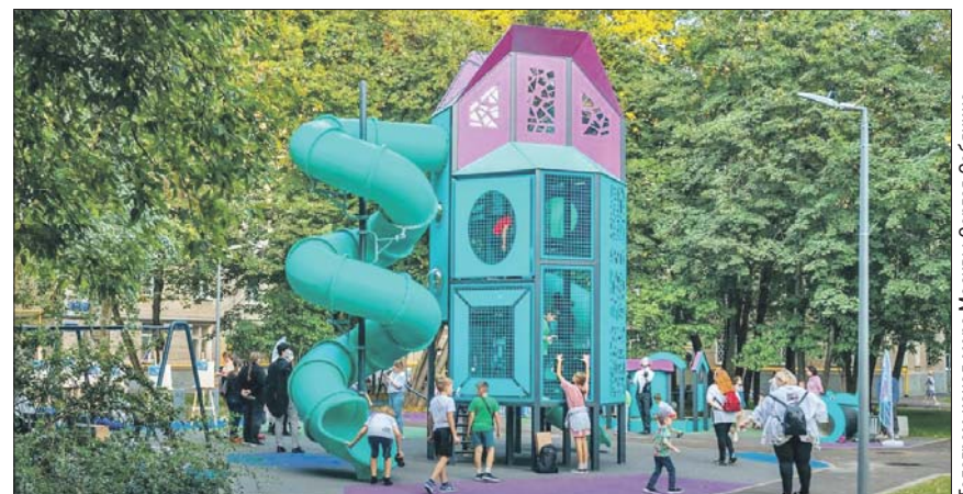
Двор по адресу: 5-й проезд Подбельского, 4а, корпус 1, — пример совместного проектирования с жителями

жане могут во время встреч с архитекторами, а также проголосовать в опросе на платформе «Электронный дом». Кроме того, работает горячая линия проекта по телефону (499) 288-8788 с 9.00 до 21.00. График очных встреч с жителями размещён на сайте «Проектируем район» в разделе «Проектируемые объекты» под соответствующим адресом.