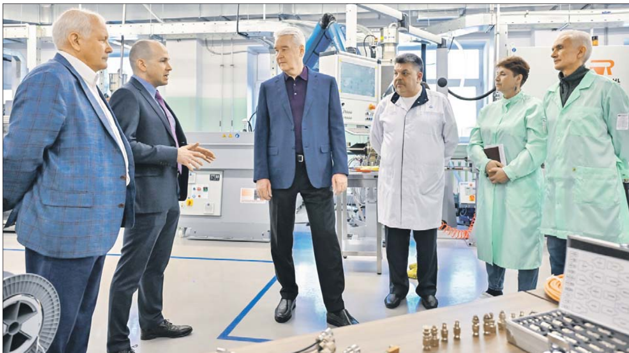
Сергей Собянин осмотрел обновлённый цех по производству оптических кабелей в Гольянове