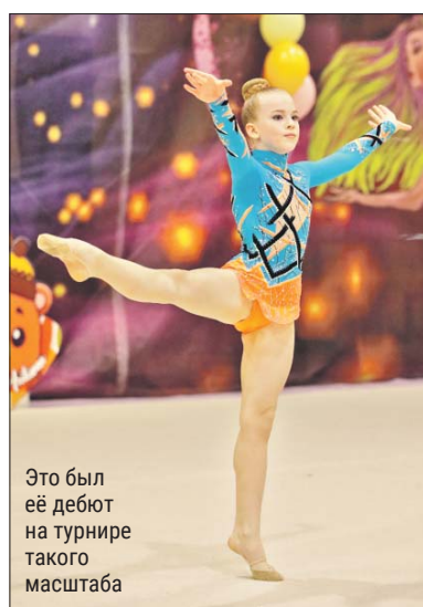
Это был её дебют на турнире такого масштаба