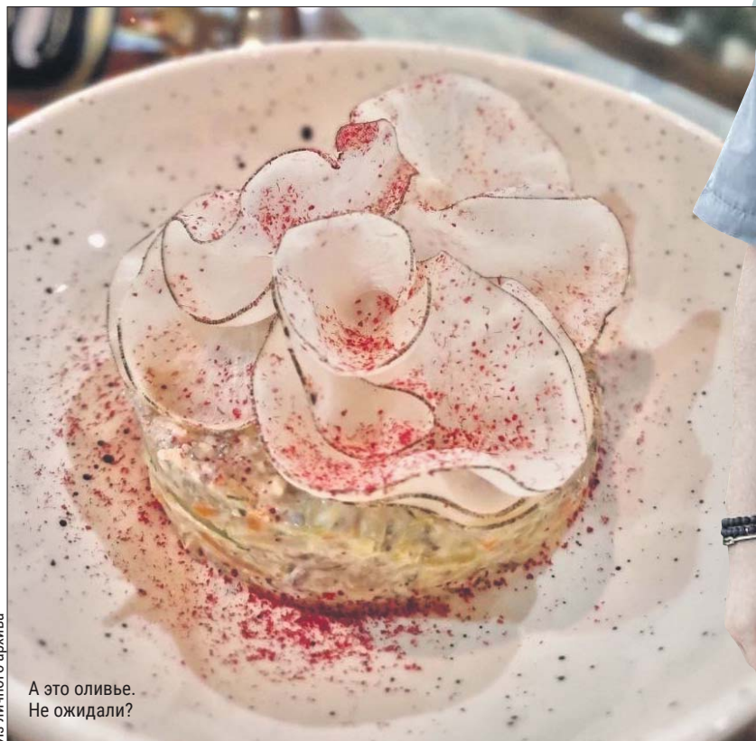
А это оливье. Не ожидали?

Говядину можно заменить куриным филе или колбасой. Для