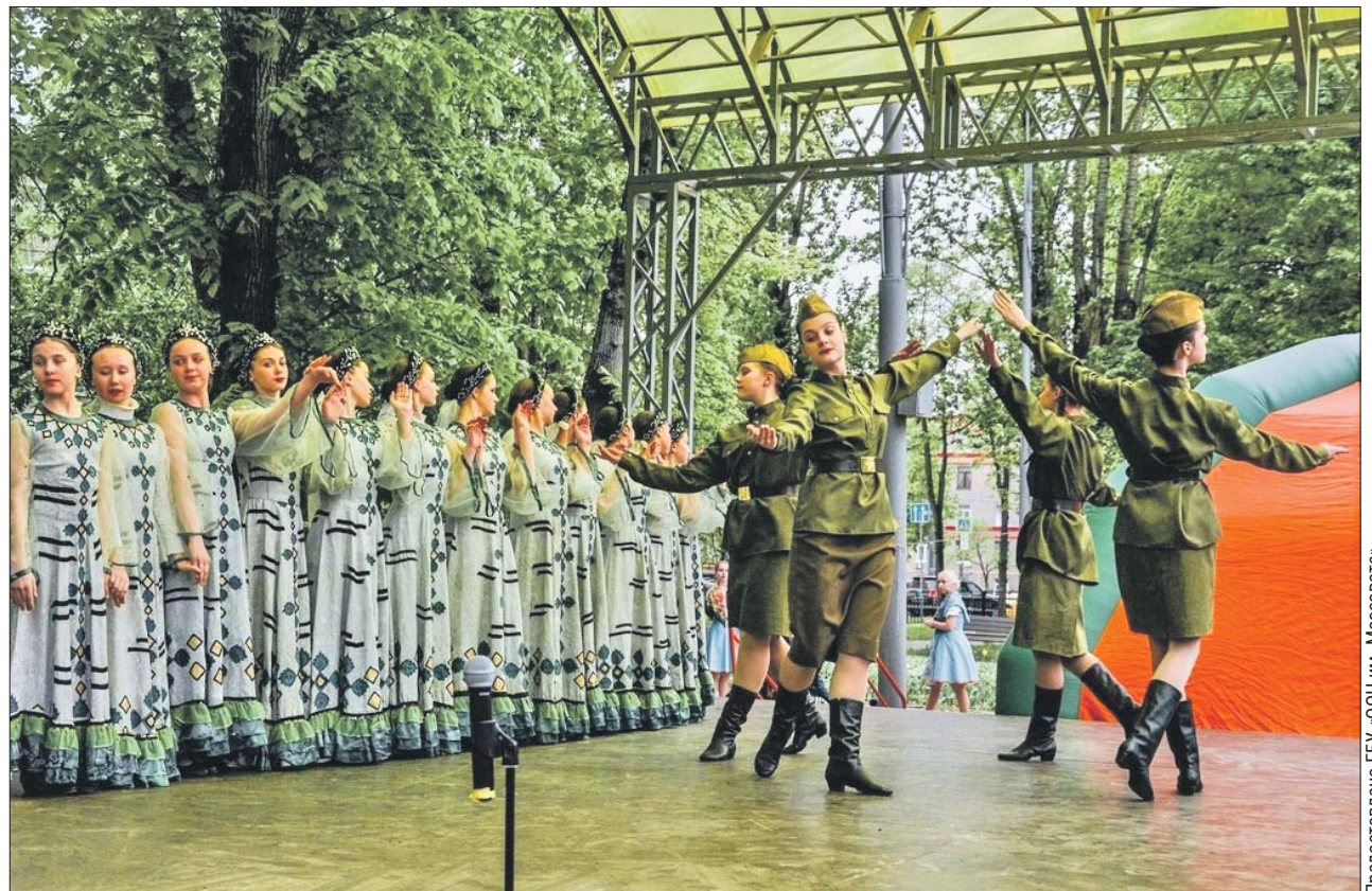
В программе праздничных гуляний — выступления творческих коллективов ООЦ им. Моссовета