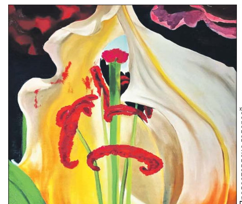
Тема этой выставки — цветы

Адрес: Открытое ш., 5, корп. 6. Выставка открыта ежедневно, кроме понедельника, с 11.00 до 20.00 до 25 мая. Билеты: 300 рублей, льготный — 150 рублей (6+).