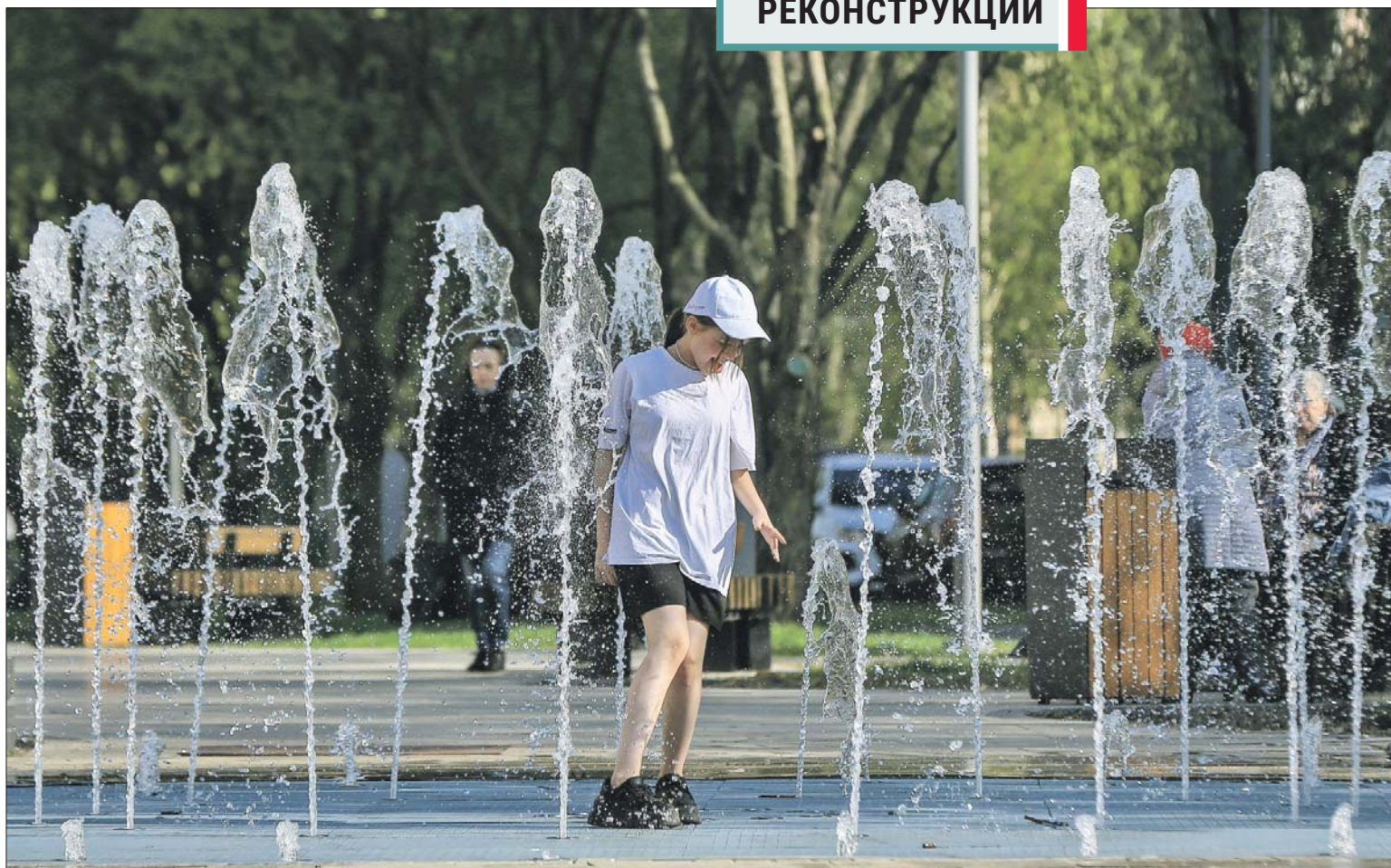
«Сухой» фонтан на Новокосинской улице

«СУХОЙ» ФОНТАН ПОЯВИЛСЯ НА СТАДИОНЕ «АВАНГАРД» ПОСЛЕ РЕКОНСТРУКЦИИ