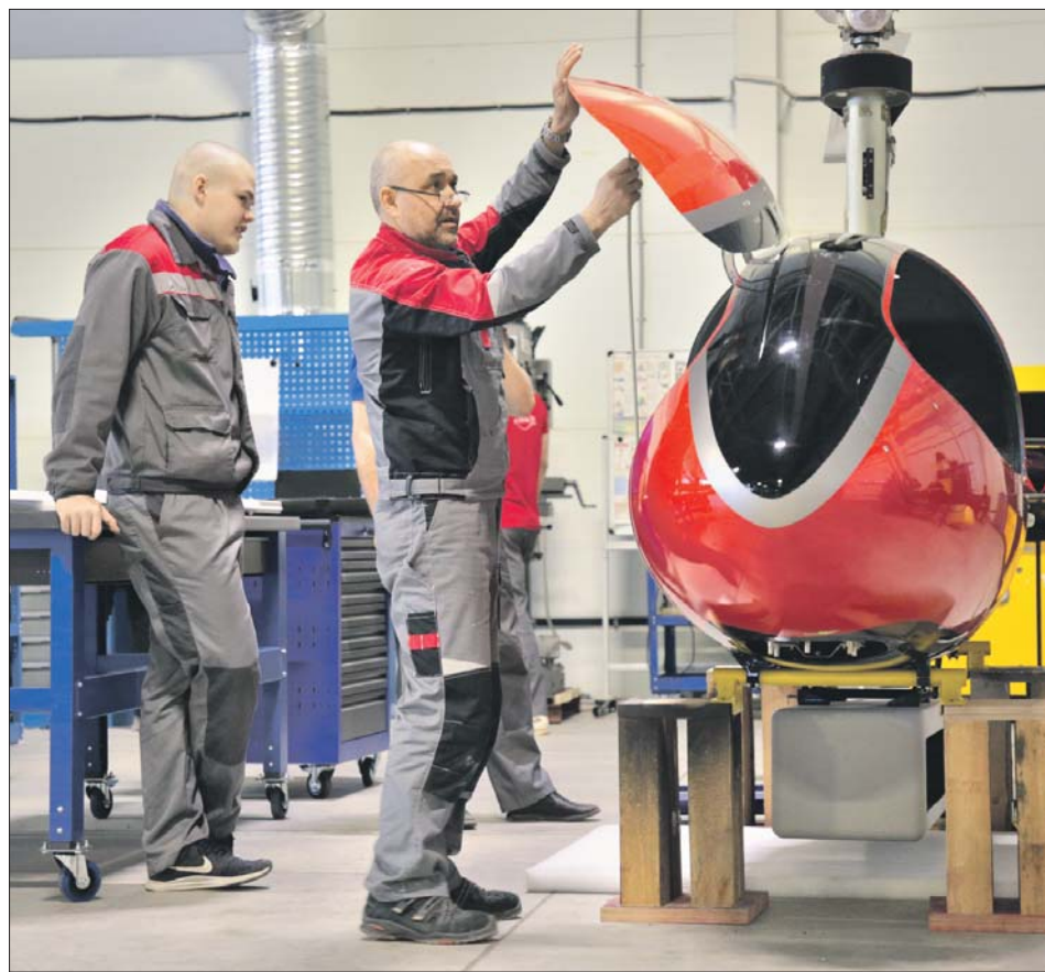
В цехе окончательной сборки работают над вертолётom SH-450

РАБОЧИЕ В ЗАВИСИМОСТИ ОТ КВАЛИФИКАЦИИ ПОЛУЧАЮТ ЗДЕСЬ ОТ 80 ДО 110 ТЫСЯЧ РУБЛЕЙ