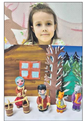
Дети здесь постигают весь процесс создания мультфильма

Адрес: Большая Черкизовская ул., 20, корп. 4.