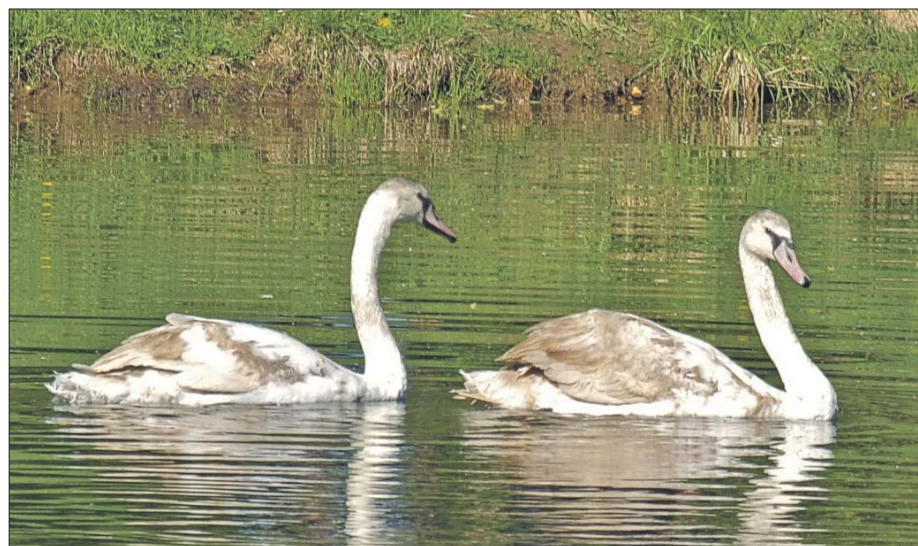
Снежинка и Зефир, но имена эти пока временные