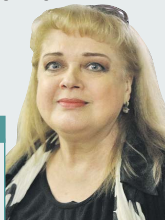
Кирилл Зыков / Агентство «Москва»

Куриные грудки выложить на блюдо и сделать небольшие надрезы, по-