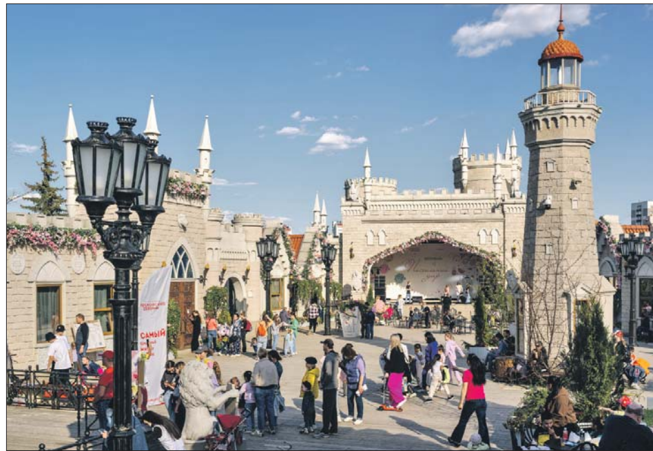
Фестивальная площадка на Уральской улице в районе Гольяново

На территории храмов фестиваль пройдёт 5 мая — в пасхальный день. Для гостей