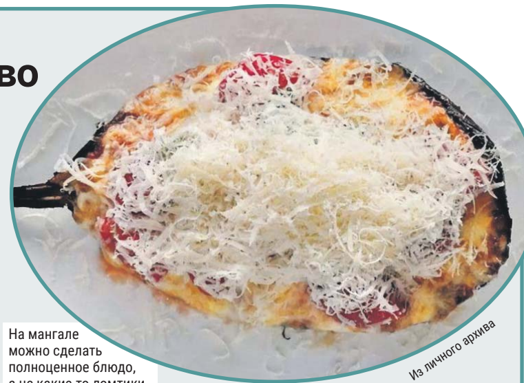
На мангале можно сделать полноценное блюдо, а не какие-то ломтики

— Средние баклажаны разрезаем напополам и в мякоти делаем лёгкие надсечки в форме квадратов. Замачиваем на 15 минут в солевом растворе: на литр воды две столовые ложки крупной соли, около 60 граммов. Это поможет убрать горечь, и плоды впитают в себя ровно столько соли, сколько нужно. Обжарить в решётке на мангале с двух сторон минут 7-10. Как будут готовы, сразу сбрызнуть лимонным или несколькими каплями острого соуса шрирача, — говорит шеф.