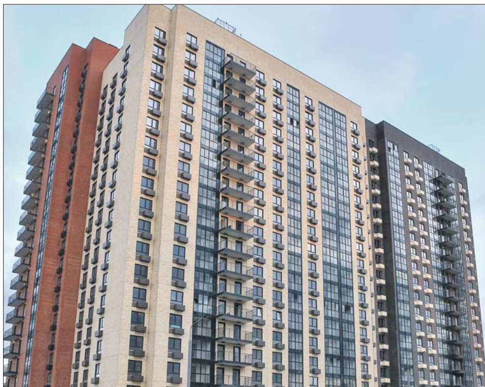
После сдачи дома по реновации сразу готовы к заселению