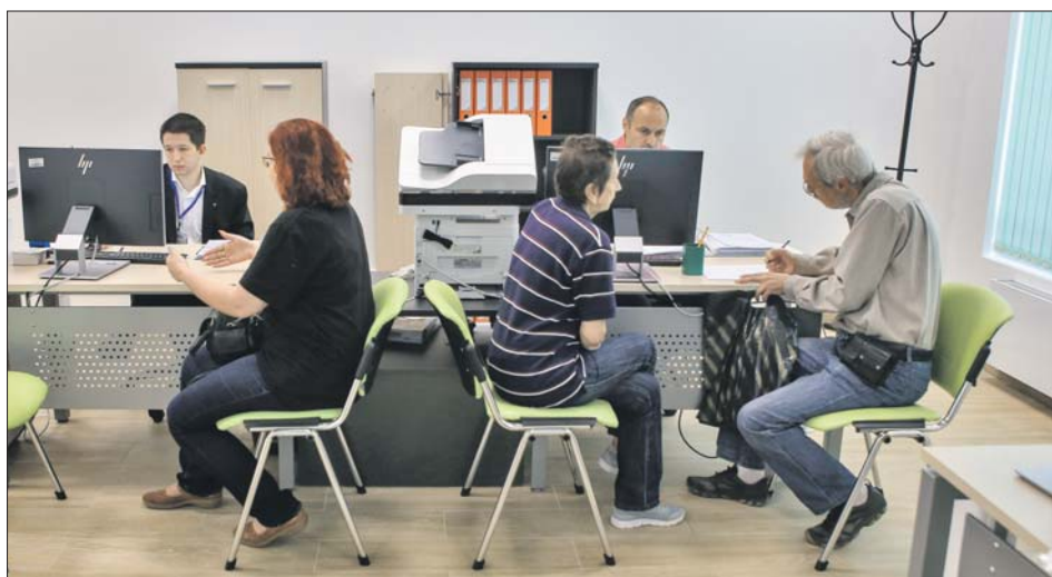
Центр информирования работает на первом этаже новостройки на улице Константина Федина, 3

В строительстве сейчас 46 новостроек. С начала программы реновации в округе заселено уже 20 новых домов.