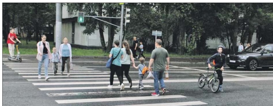
Переход на 15-й Парковой улице, где в этом году случилось ЧП с ребёнком

Пешеходы были почти на другой стороне улицы, когда машина потихоньку тронулась. В этот момент на «зебру» справа выехала девочка на самокате. Ребёнок оказался в слепой зоне автомобиля, то есть водитель попросту его не видел.