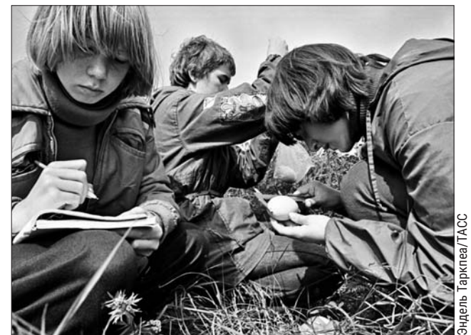
Юннаты советских лет действовали с особым энтузиазмом