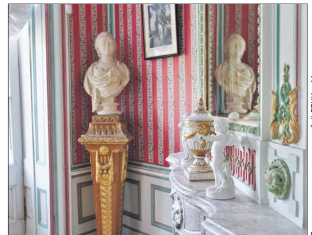
Выставка посвящена Прасковье Жемчуговой

Адрес: ул. Юности, 2. Выставка проходит в графских покоях усадебного дворца до 15 сентября . Расписание: ср.-вс. с 10.00 до 18.00. Билеты: 100 рублей, льготный — 50 рублей, дети до шести лет проходят бесплатно.