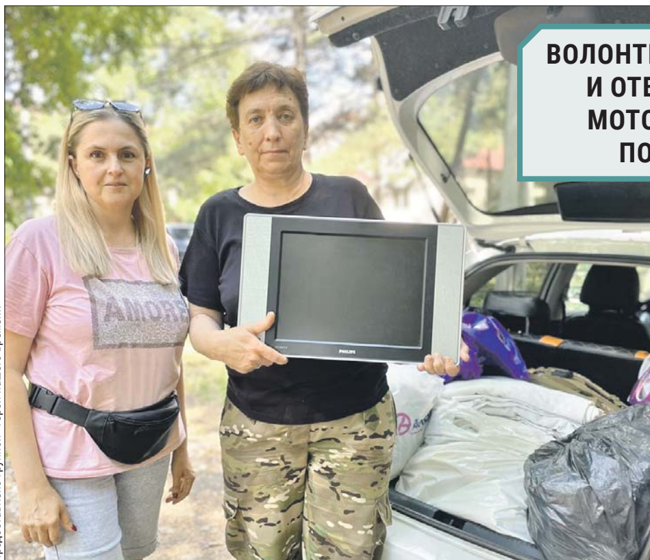
Волонтеры принимают очередные посылки — теперь от жительницы Перова

Их принимают в неограниченном количестве. В южных регионах России с мая стоит 30-градусная жара, а в июле и августе воздух раскаляется обычно до 33-35 градусов.