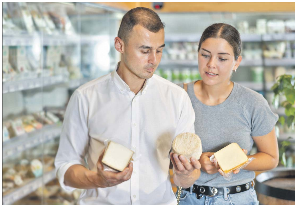
По опросу Роскачества, две трети покупателей почти не разбираются в тонкостях маркировки продуктов