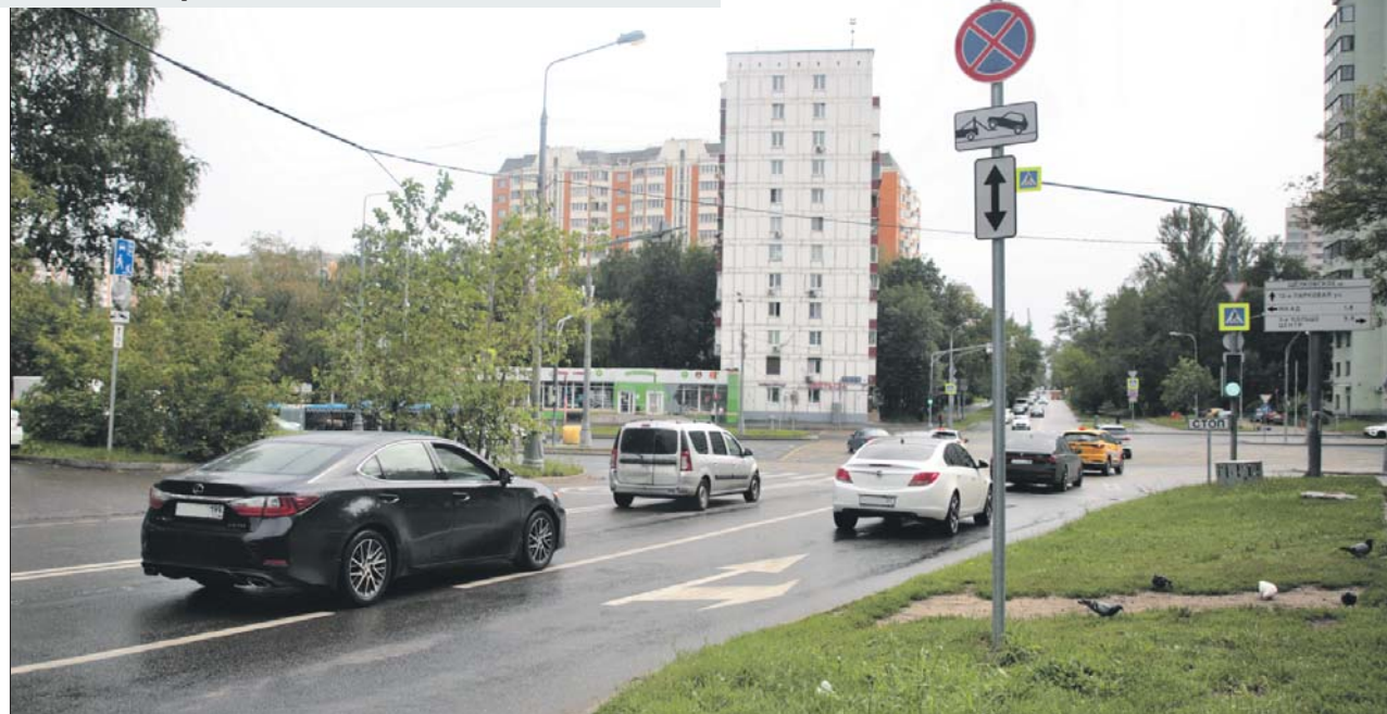
На повороте с Чусовской на Щёлковское шоссе теперь два ряда

Та же ситуация на пересечении Монтажной улицы и 2-го Иртышского проезда. На Монтажной улице при движении со стороны Щёлковского шоссе был только один ряд. В июне за счёт изменения разметки их стало два. Проезд перекрёстка у водителя занимает меньше времени.