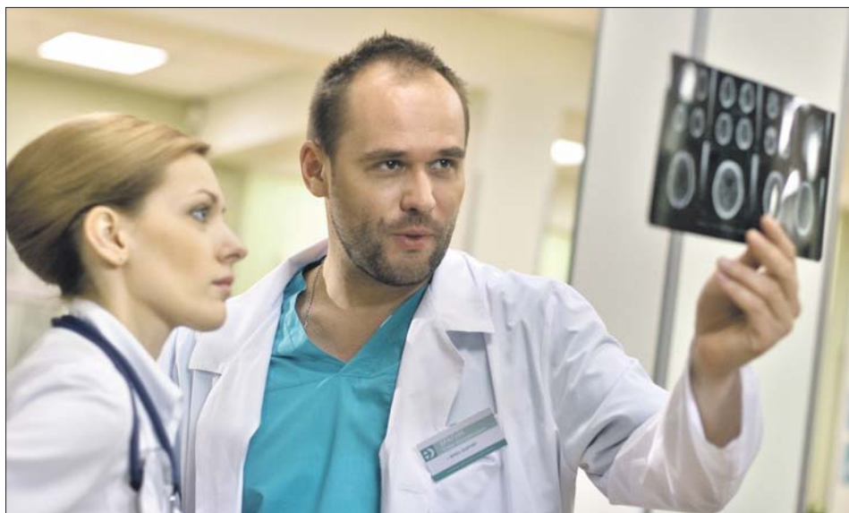
С Максимом Авериным в сериале «Склифосовский»