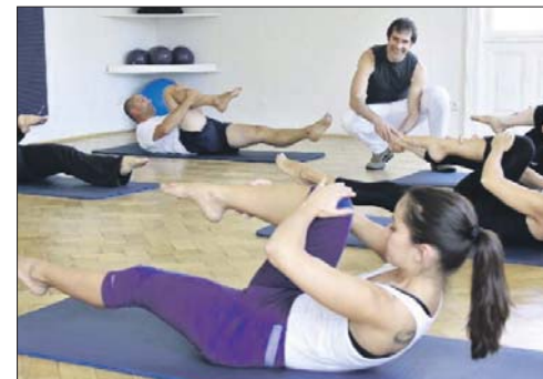
Пилатес всем на пользу

ТУ Перово приглашает всех желающих в студию пилатеса для взрослых. Занятия этим видом фитнеса помогают сбалансировать тело, восстанавливают тонус слабых мышц, оздоравливают позвоночник, развивают дыхательную систему, улучшают гибкость, подвижность суставов, координацию и качество движений, внешний вид и самочувствие (18+).