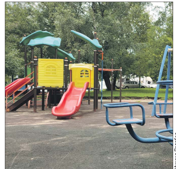
Детскую площадку привели в порядок

Эл. почта: vesh@mos.ru . ГБУ «Жилищник района Вешняки»: Вешняковская ул., 24а, тел. (499) 653-8311. Эл. почта: info@post.gbu.ru