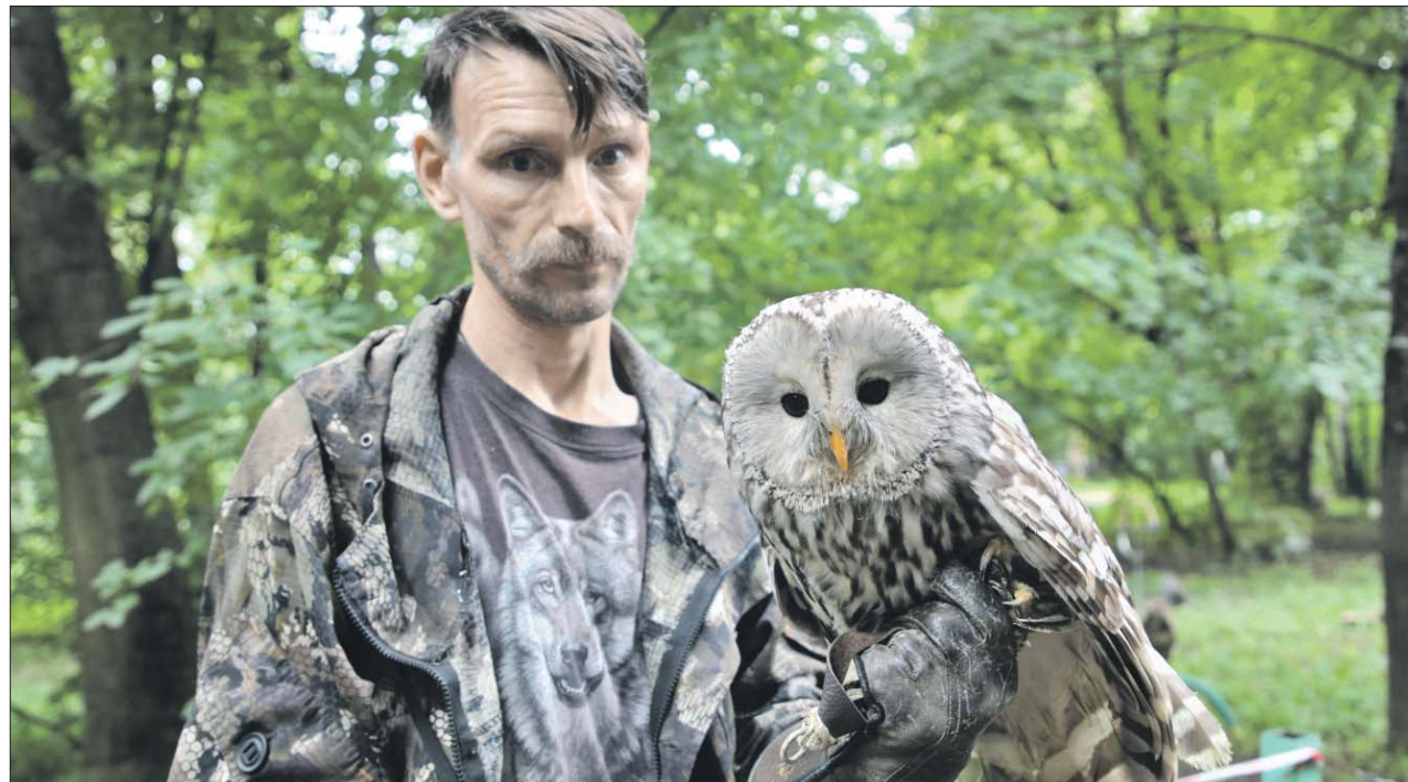
Одну из уральских красоток выходили в орнитарии

Сегодня широко известна история с красноухими черепахами. «Любители природы» выпускали их в наши московские водоёмы, и вот печальный итог: красноухие агрессоры практически полностью вытеснили сегодня коренных обитателей — болотных черепах. Не получится ли нечто похожее с уральскими гостями? Не станут ли они инвазивным видом,