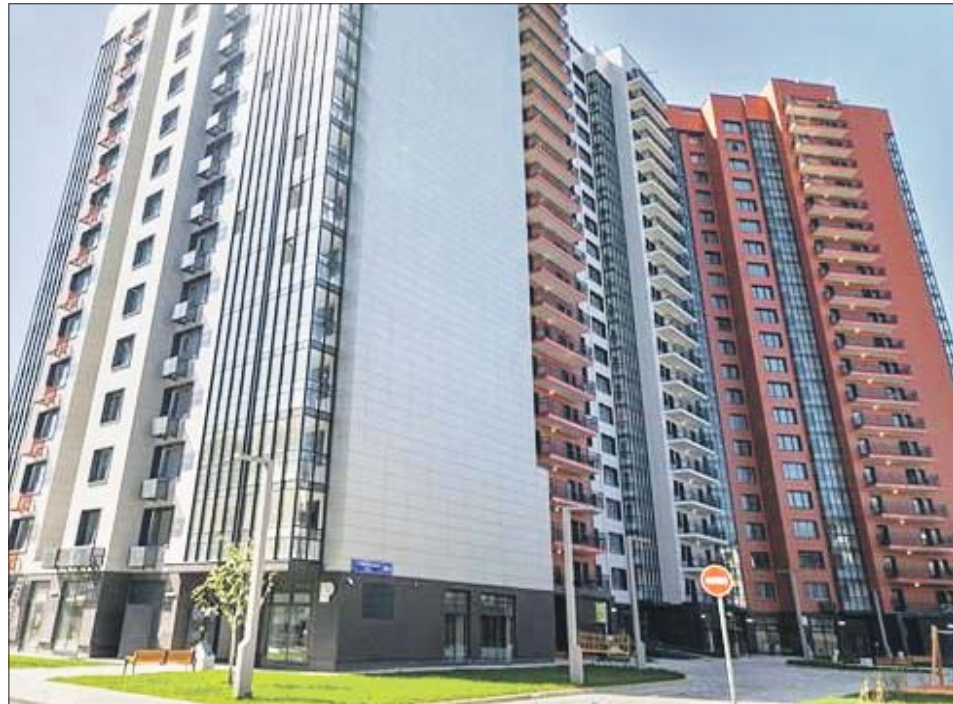
Сюда переезжают жители Братской и Кусковской улиц