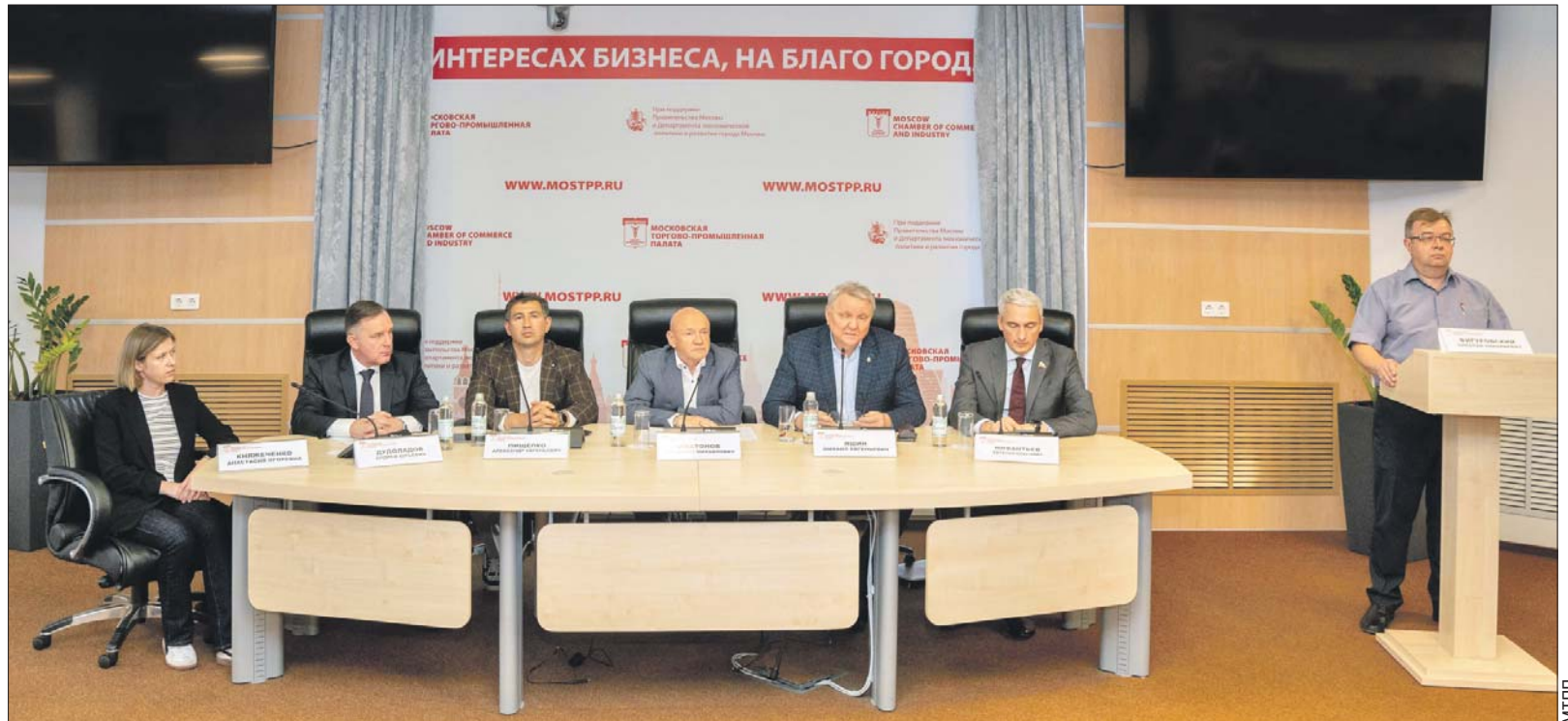
На пресс-конференции в Московской торгово-промышленной палате, посвящённой подготовке к новому этапу программы «Миллион призов»