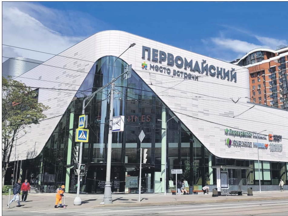
Культурный центр собираются открыть уже в августе