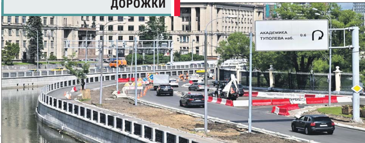
Благоустройство охватило 20 километров набережных