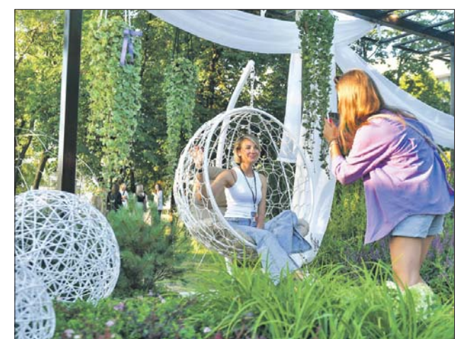
Здесь съедутся мастера ландшафтного дизайна из многих городов