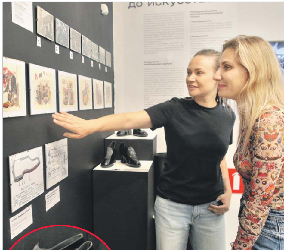
Резиновую обувь запечатлели в красках ведущие советские художники

Чёрные галоши с малиновой подкладкой были