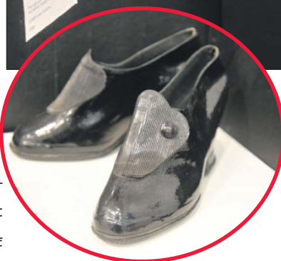
Непромокаемые туфельки для модниц

фирменным стилем «Красного богатыря». Их отправляли на экспорт как модную защиту от дождя и грязи — в Чехословакию, Польшу, Болгарию, Румынию, Монголию, во Вьетнам, на Кубу и другие страны соцлагеря.