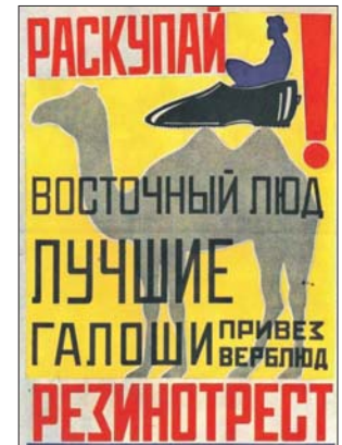
Тот самый плакат от Маяковского

мер, на одном из плакатов изображён верблюд, на спине которого мужчина сидит внутри большой галоши. Поверх изображения — двусторонний текст: «Раскупай, восточный люд! Лучшие галоши привез верблюд!» — рассказывает куратор. — Или — земной шар, а рядом с ним галоша и надпись: «В дождь и сля-