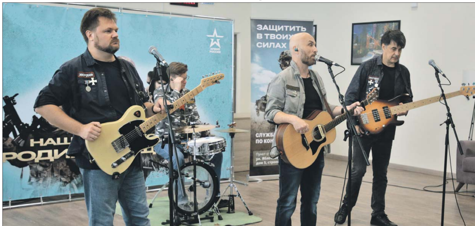
Группа «Зверобой» после экскурсии по пункту выступила с концертом

— Новые карты выдаём не часто, потому что у многих уже есть свои. Некоторые помнят только их номера. При этом для оформления документов нужны