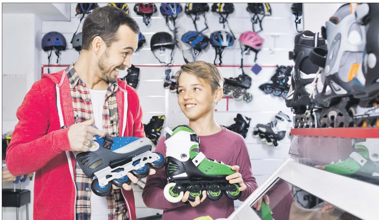
Победители розыгрыша смогут получить скидки и бонусы при покупке товаров

Подробности акции и правила участия в ней можно посмотреть на ag-vmeste.ru