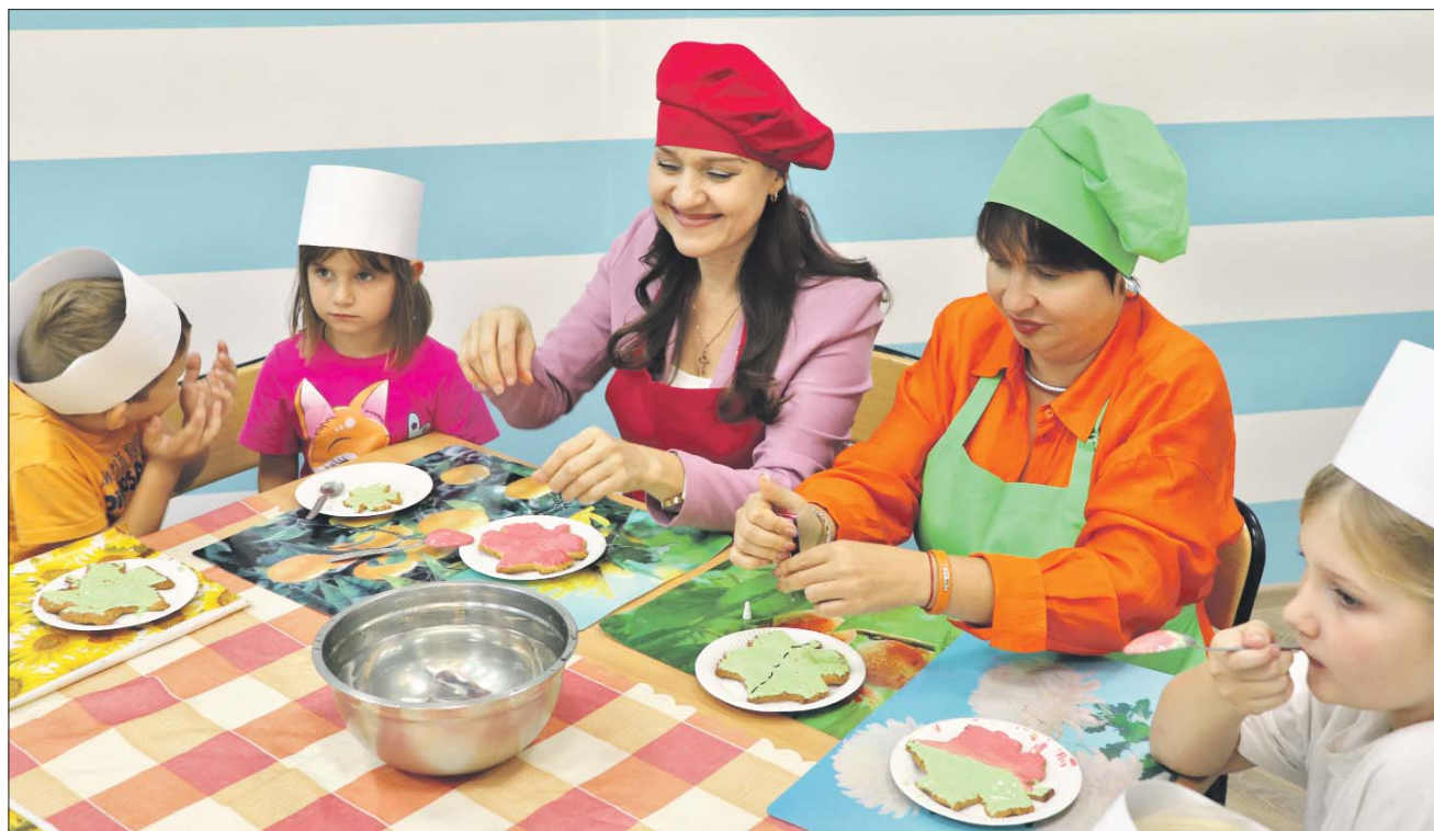
Одним из первых мастер-классов стал кулинарный

Адрес: Большая Косинская ул., 16, корп. 1