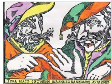
«Трое дураков шальных блаженных»

в то время делали сразу несколько мастеров. Но именно эти картинки мог держать в руках и вдохновляться ими лично Иван Андреевич Крылов, — говорит Дарья. — Ведь притчи — это предвестники басен. Цель и тех и других — инскапательно научить слушателей, как правильно поступать в разных ситуациях.