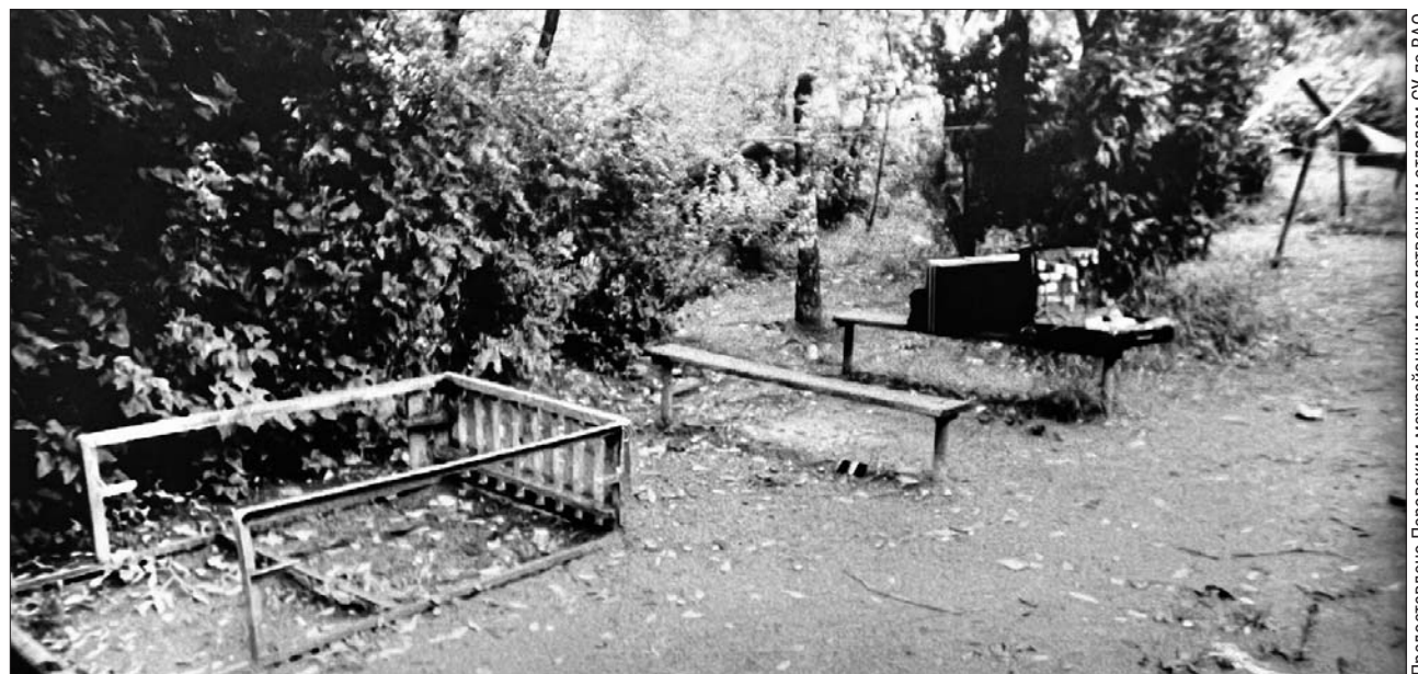
Так выглядело место преступления (из материалов уголовного дела)

В Ивановском раскрыли жестокое убийство, совершённое из-за ревности в начале 90-х годов