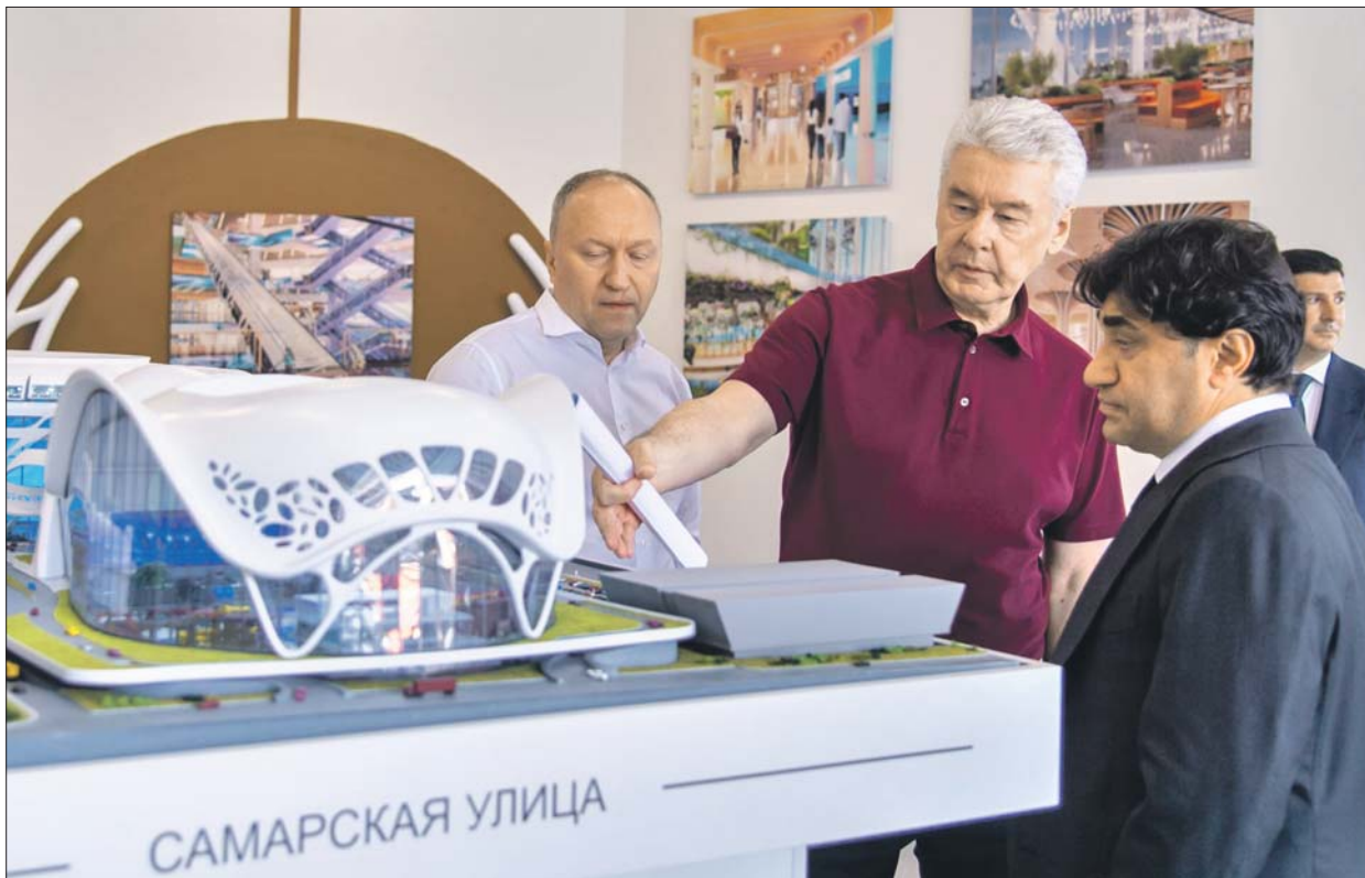
Август 2023 года. Сергей Собянин осматривает макет будущего СК «Олимпийский»

Как реконструируют легендарный спорткомплекс, рассказал Сергей Собянин