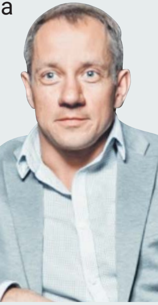
Предоставлено Сергеем Рудзевичем

ки. Яблоки также наре- зать кольцами, удалив сердцевину. В противень налить не- много воды и положить туда мясо, вода не должна его покрывать. На каж- дый мясной ломтик вы- ложить кольца апель- сина и яблок. Посыпать тёртым сыром и сбрызнуть майонезом, слегка его размазав. Противень отправить в разогретую до 200 гра- дусов духовку. Запекать примерно час. Ирина МИХАЙЛОВА