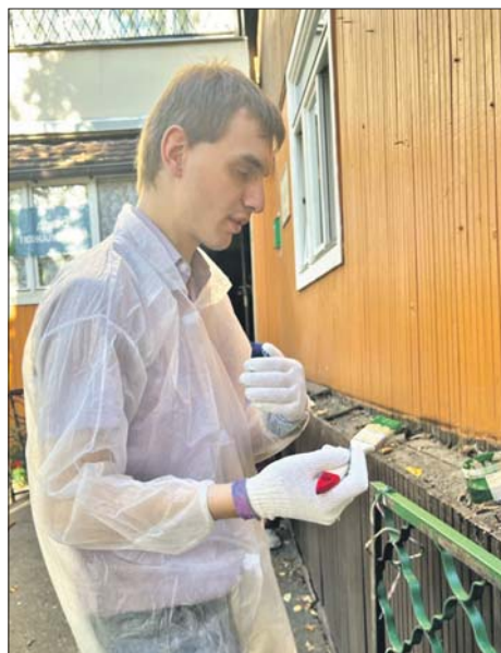
Инклюзивные волонтеры за работой