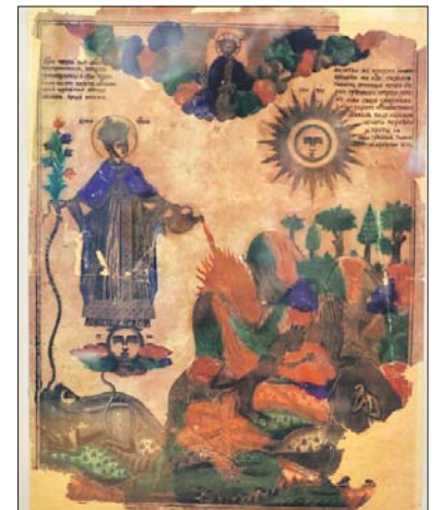
«Душа чистая» — один из старейших экспонатов

— Несмотря на название, на ней изображены только два человека. Многие спрашивают: кто же тре-