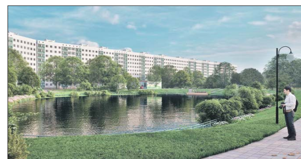
На прудах обустроят четыре зоны биоплато