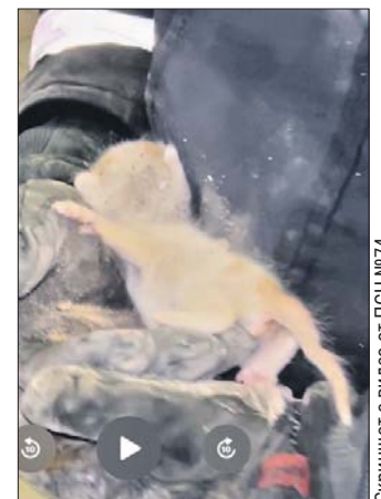
Спасённого забрал себе работник магазина