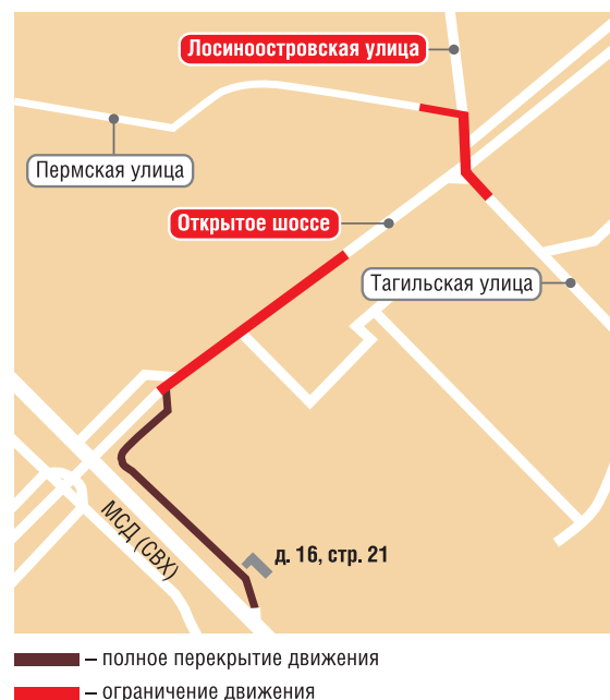
— полное перекрытие движения — ограничение движения