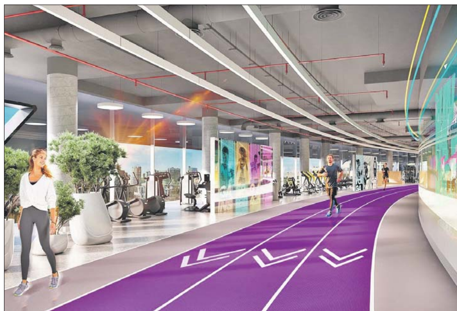
Проект обновлённого спорткомплекса: беговые дорожки, рядом тренажёры

На протяжении десятилетий «Олимпийский» был местом проведения тренировок около 20 национальных сборных России и соревнований по 22 олимпийским видам спорта. Был он и популярной