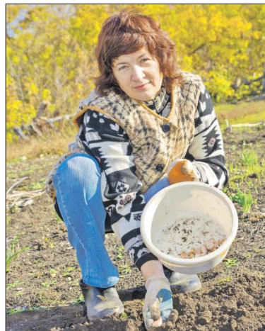
Самое время для посадки чеснока

Семенные культуры, чтобы они не проросли раньше времени, сеют, когда