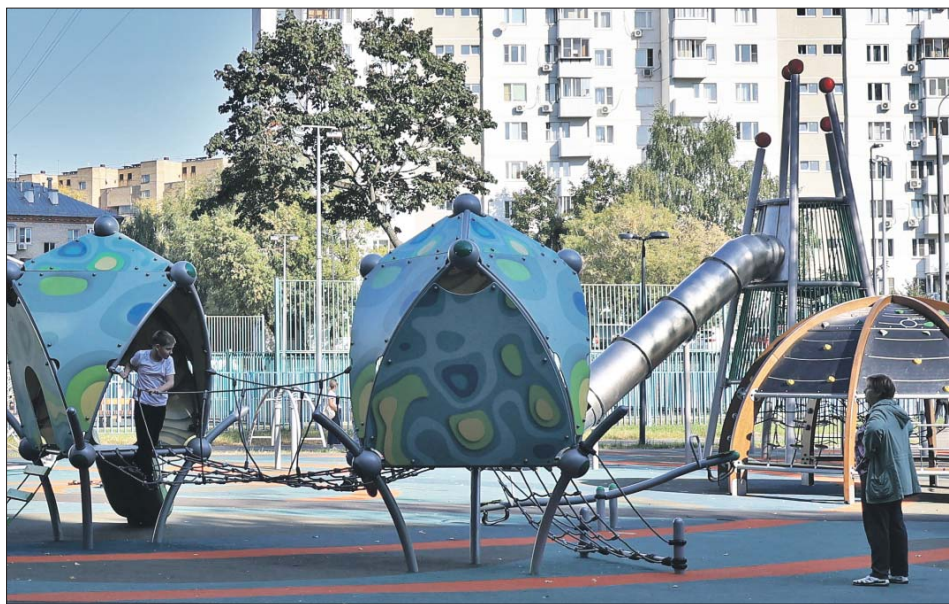
На такой площадке можно не только поиграть, но и узнать что-то новое

Галина с Погонного проезда приходит на «космическую» площадку со своими детьми.