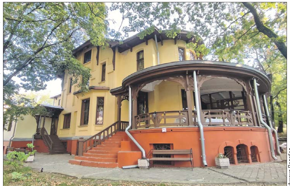
За 120 лет не повело ни одной стены, хотя дом деревянный