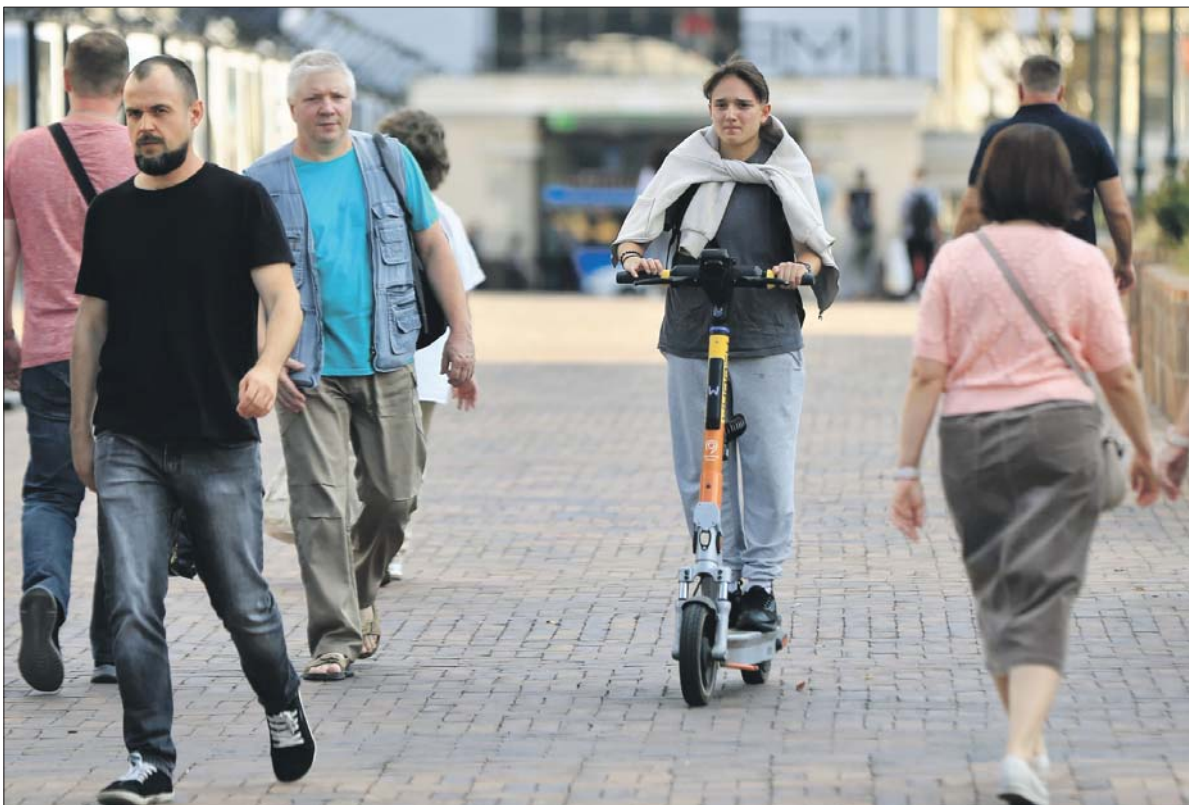
На Сокольнической площади прокатный самокат сам скинет скорость

В округе стало больше зон для электросамокатов, где снижен скоростной режим