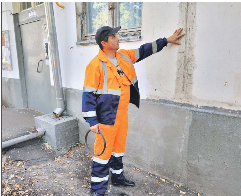
Дом на Открытом шоссе надо бы подлатать